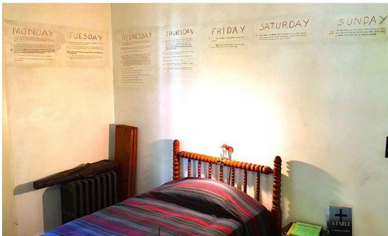
Studio e camera da letto di William Faulkner a Rowan Oak, Oxford Mississippi. Sulle pareti la cronologia del romanzo Una favola, 1954

Il Blues, con il significato allusivo di malinconia e condizione di tristezza, è il ritmo che racconta la segregazione degli stati del Sud, e lo fa seguendo costantemente il ritmo del treno, la marcia liberatoria, il biglietto per il North East dove nella seconda metà dell'Ottocento si cominciavano a unire le prime forze dell'emancipazione antischiavista. In quegli anni nasce il Jazz, modulazione sincopata della musica afro-americana che, non seguendo più il ritmo di quei vagoni che per la maggior parte dei neri rimasero un miraggio, anima la sua musica seguendo la pulsazione del cuore, lo swing , il battito che dà voce e forza alla lotta contro l'emarginazione razziale. L'arteria principale di trasmissione della nuova musica è l'Interstate Highway 55 che collega il Golfo del Messico ai Grandi Laghi, ossia New Orleans a Chicago. La I-55 attraversa tutto il Mississippi e passa vicino a Oxford, dove l'umidità appanna le bottiglie di Bourbon semivuote e gonfia il legno delle sedie a dondolo che oscillano sotto coccigi costretti tutto il giorno alla semina, al raccolto, alla mietitura mentre tramonta un sole rovente che sposa perfino gli alligatori e gli armadilli della zona.