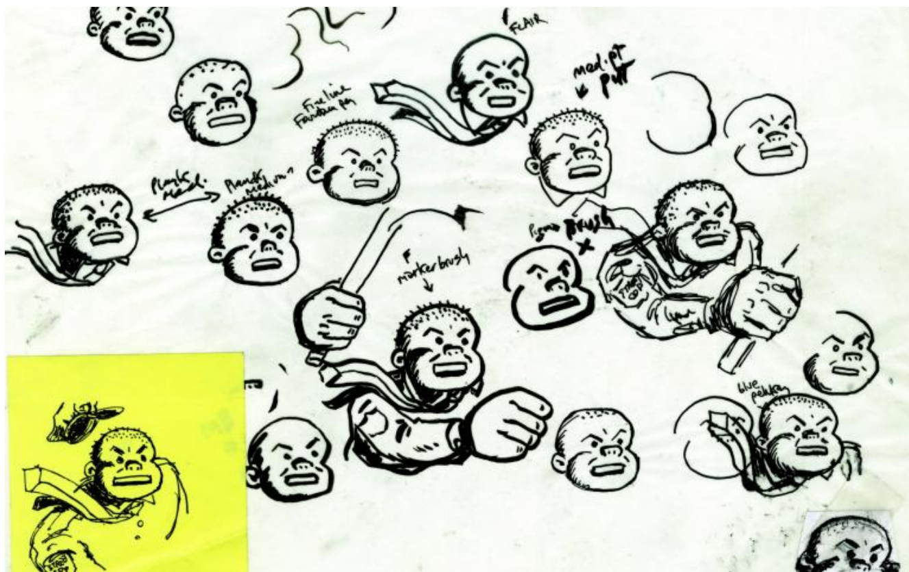
Una tavola da Street Cop Uncovered!

Nel catalogo Street Cop Uncovered! , c'erano le decine e decine di schizzi, prove e bozzetti da cui sono nate le illustrazioni per il libro. Questo è uno degli aspetti più interessanti del lavoro di Art Spiegelman: nonostante sia l'autore del graphic novel più famoso al mondo, l'iniziatore di un intero genere, il suo rapporto con il disegno rimane una lotta corpo a corpo. Lo aveva già scritto in Baci da New York , il bel volume pubblicato da Nuages che raccoglie e racconta il lavoro di Spiegelman per le copertine del settimanale The New Yorker : "Le mie insicurezze e la mia incapacità di disegnare di getto mi hanno sempre portato a fare una montagna di studi preliminari solo per mettere a fuoco un disegno". Non è detto che un disegnatore talentuoso sia anche un bravo fumettista, mentre capita spesso che un autore meno sicuro delle proprie doti artistiche si riveli uno splendido narratore per immagini. È il caso di Art Spiegelman, che però ha anche un'altra qualità: una profonda conoscenza dei meccanismi e della storia del fumetto, e in particolare delle strip americane.