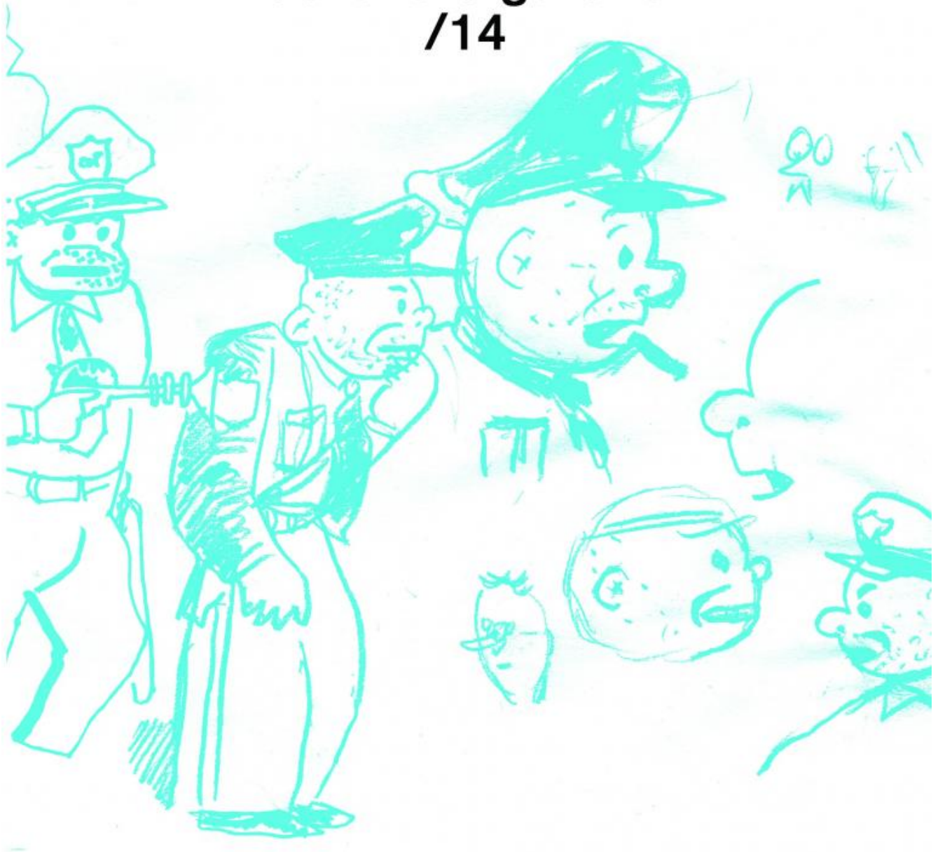
La copertina di Street Cop Uncovered!