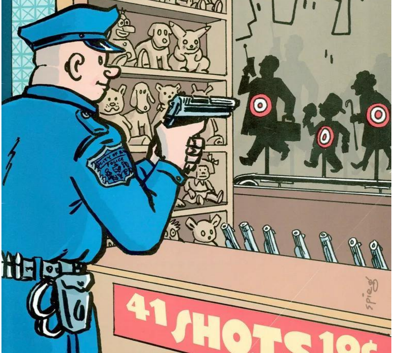
La copertina di The New Yorker del marzo 1999.