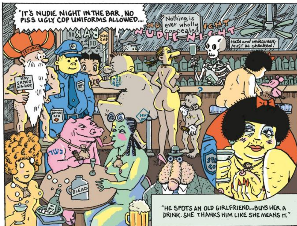
Una tavola da Street Cop.

Nel volume pubblicato da Sigaretten si possono vedere le innumerevoli prove e tentativi che hanno portato il disegnatore al risultato finale. La collaborazione tra Spiegelman e le Sigaretten è nata in seguito alla mostra del cartoonist alla Galerie Martel di Parigi, per cui quelli di Sigaretten - uno degli ideatori della collana è l'illustratore Stefano Ricci - avevano curato le serigrafie. Una collana indipendente, contraddistinta da una curatissima ricerca stilistica, non poteva non attirare l'attenzione di Spiegelman, a suo tempo fondatore della rivista Raw (su cui appunto uscì originariamente Maus ). Inaspettato ma non fortuito, l'incontro tra Art Spiegelman e le Sigaretten è una fortuna per noi, che possiamo così scoprire il lavoro dietro le quinte di uno degli autori più importanti del fumetto mondiale.