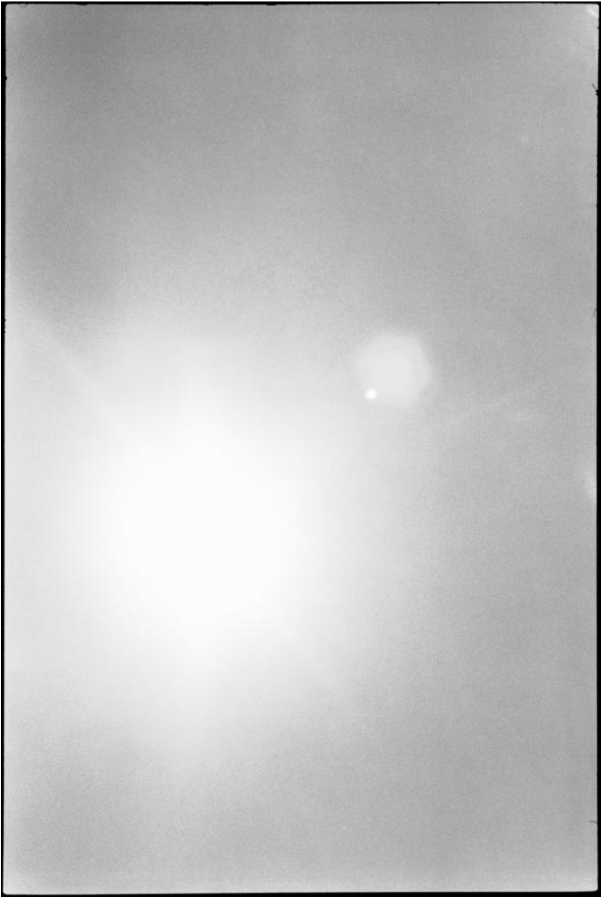
Zoe Leonard, January 23, frame 8, 2011. Gelatin silver print 47 Å? 70 cm.