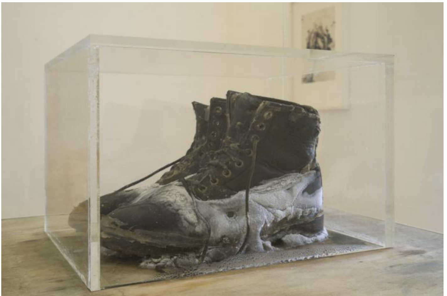
Lawrence Carroll, Untitled, 2006.

Eppure, lâ?eterogenea produzione di Carroll non si limita affatto alla sola ed enigmatica rappresentazione dellâ?empietÃ : le opere dellâ?artista, al contrario, mostrano tratti spesso antitetici rispetto alla dilagante irrequietezza delle quattro copertine realizzate per gli Slayer â? Reign in Blood (1986), South of Heaven (1988), Season in the Abyss (1990) e Christ Illusion (2006). Dalla seconda metÃ degli anni Ottanta, infatti, Carroll decide di abbandonare progressivamente il proprio lavoro come grafico e illustratore per dedicarsi alla realizzazione di opere incentrate sul mezzo pittorico. Lâ?assordante afflizione delle illustrazioni cede il passo al silenzio delle tele, all'assenza figurativa, mentre lâ?ocra, il giallo e lâ?avorio hanno la meglio sull'esasperazione policroma. Tuttavia, si tratta di un candore incerto, diafano, irresoluto, e forse proprio per questo tangibile. Assistiamo alla contraddizione del concetto apparentemente univoco di monocromia, come se il tempo lasciasse un segno del proprio passaggio, annullando ogni presunta differenza tra colore e materia, tra rappresentazione e realtÃ , tra Immagine e tatto. La pittura diviene corpo.