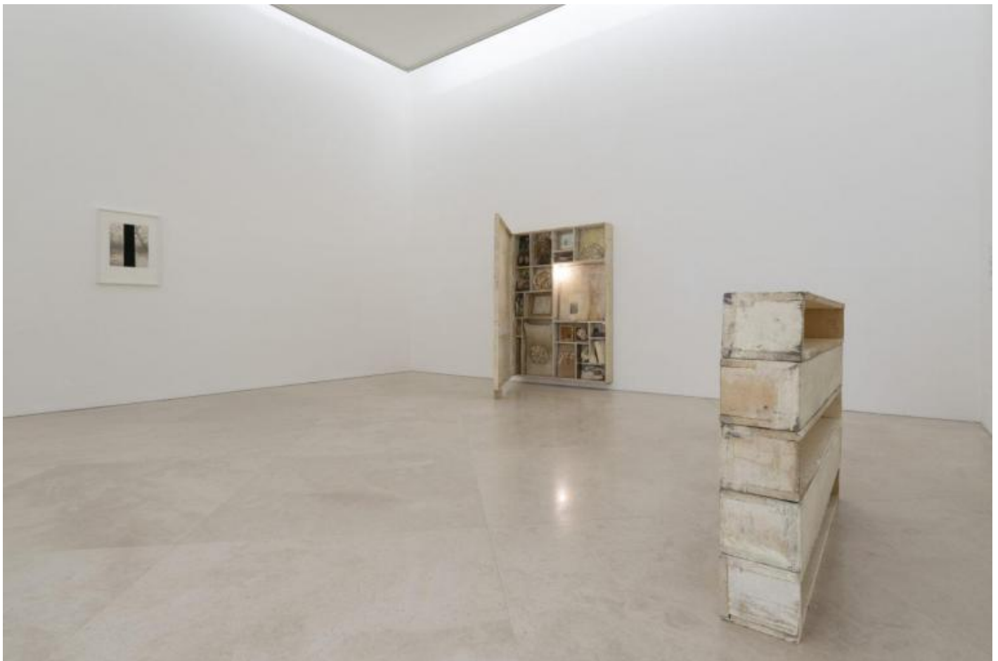
Lawrence Carroll, Madre, Veduta della mostra.

L'esordio nell'arte contemporanea avviene alla metà degli anni Ottanta, proprio in concomitanza con la realizzazione della copertina di Reign in Blood degli Slayer, introducendo la tridimensionalità oggettuale degli scarti all'interno del proprio operato. La prima personale dell'artista si tiene alla Stux Gallery di New York (1988), tuttavia l'affermazione internazionale coincide con la partecipazione alla collettiva Einleuchten , curata dallo svizzero Harald Szeemann presso la Deichtorhallen di Amburgo (1989), a fianco di Joseph Beuys, Bruce Nauman e Robert Ryman, per poi consolidarsi in occasione della nona edizione di documenta a Kassel, curata dal belga Jan Hoet (1992).