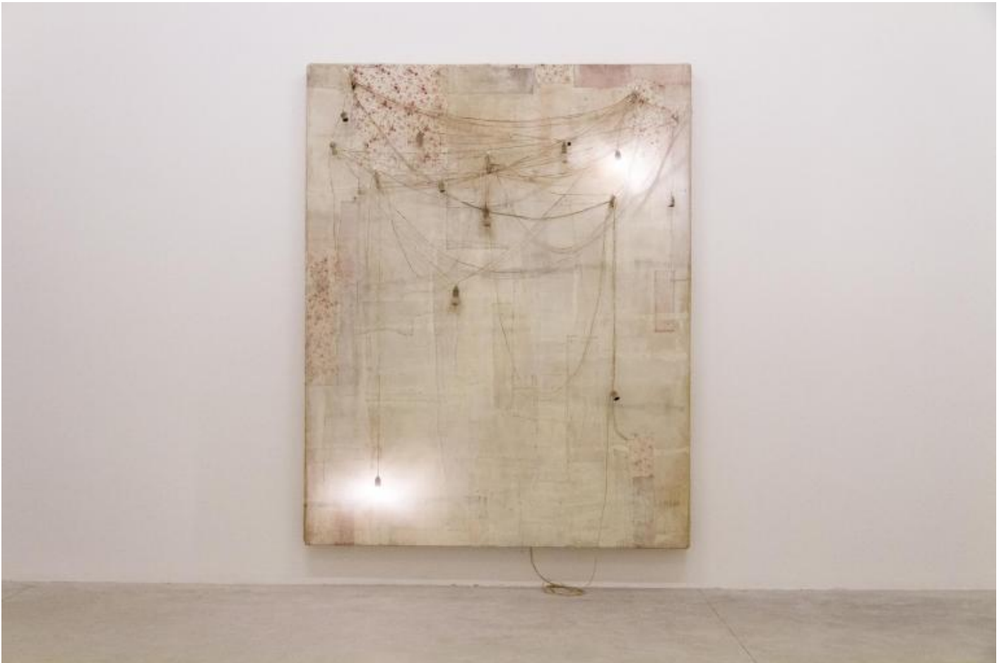
Lawrence Carroll, Untitled, 2013.

“Credo che l’arte (almeno per me) stia nel mezzo delle cose. Nel mezzo” – una grande parte del mio modo di pensare e procedere, sia psicologicamente che fisicamente.