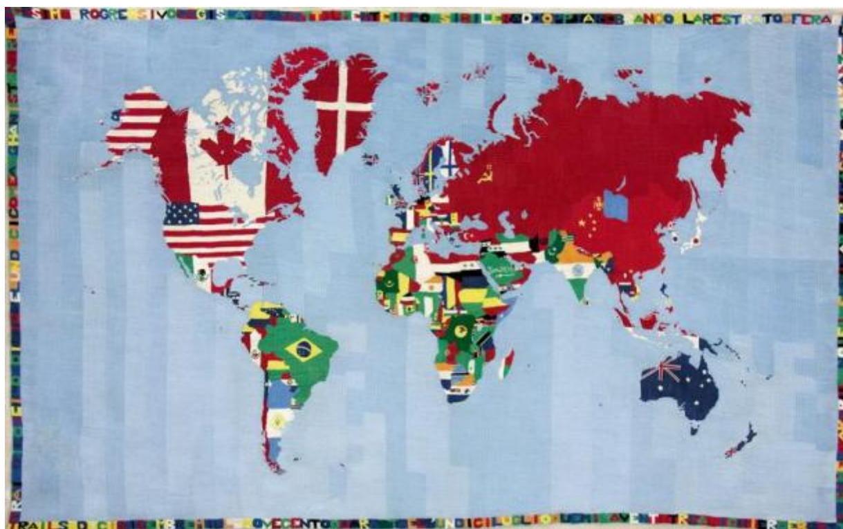
Alighiero Boetti, Mappa , 1971

Entriamo ora più nello specifico e osserviamo il capitolo “Definizione e controllo del territorio”. Qui il tema trattato è la carta geografica intesa come uno spazio astratto sul quale sono incisi i segni del potere politico, con tanto di confini ben indicati. Distaccandoci in parte dal testo di Tedeschi, proviamo a concentrarci sull’intricata situazione territoriale tra Israele e i Territori palestinesi. Una scelta, la nostra, dovuta non a una presa di posizione politica, ma proprio per verificare – attraverso una situazione concreta, e molto dibattuta – come e con quali strumenti diversi artisti siano riusciti, in modo emblematico, a uscire da una logica puramente informativa. Per prima cosa prendiamo in mano una carta dettagliata di Israele, come quella che proprio ora sto guardando. Già di primo acchito si capisce che c’è qualcosa di non pacificato e stabile: la striscia di Gaza pare l’angolo della punizione tanto è schiacciata verso il mare, e il confine con la Siria, là dove s’innalzano le alture del Golan, è segnato con una doppia linea di demarcazione che delimita una vasta terra di nessuno. In compenso le strade si snodano sciolte e libere, come se si potesse allegramente andare da Hebron a Be’Er Sheba e da lì fare un salto a Gaza per incontrare gli amici.