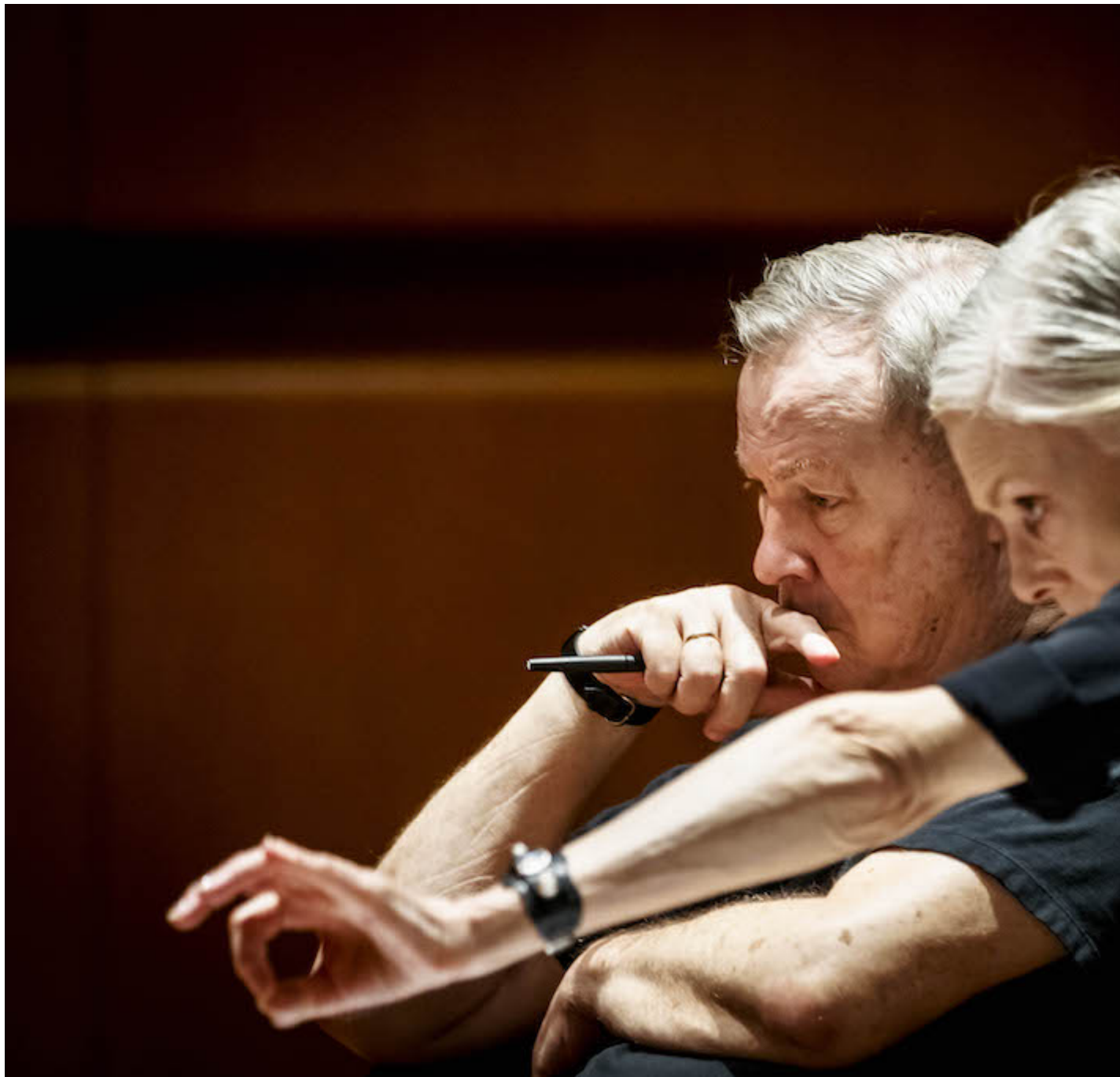
Wilson e Childs durante le prove, foto Musacchio/Ianniello/Pasqualini.

I nomi dei maestri americani â?? tornati a lavorare insieme dopo la loro storica collaborazione per lo spettacolo-monumento Einstein on the Beach creato nel 1976 da Wilson sulla musica di Philip Glass â?? rappresentano chiaramente lâ??elemento di maggior richiamo e lâ??assoluto punto di forza della proposta. Relative calm Ã? frutto della volontÃ di riprendere insieme un lavoro iniziato nel 1981, quando Lucinda Childs, che al tempo preparava uno spettacolo con Jon Gibson a New York, chiese a Robert Wilson di realizzare le luci e lo spazio. A questo, si Ã? aggiunta la proposta di lavorare su Pulcinella di Igor Stravinskij, per questa occasione eseguito e registrato dalla PMCE Parco della Musica Contemporanea Ensemble diretto da Tonino Battista, che Wilson ha deciso di far incorniciare da due pezzi contemporanei, Rise di Jon Gibson del 1981 e Light over water di John Adams del 1985, e da due monologhi portati in scena da Lucinda Childs stessa.