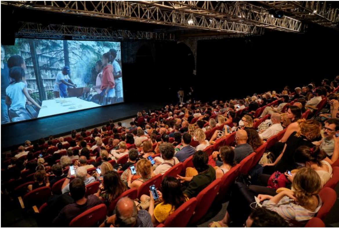
The Lingering Now, ph. Andrea Avezzù, Courtesy La Biennale di Venezia.

Il cinema domina in The Lingering Now / O Agora que Demora (L'eterno ora) della brasiliana Christiane Jatahy, Leone d'oro di questa edizione della Biennale Teatro. Laureata in teatro e giornalismo, con un master in arte e filosofia, la regista fonde tutti questi interessi nei suoi spettacoli, che spesso partono da un riferimento classico per affrontare nodi brucianti del presente. La scenografia è costituita solo da un grande schermo e lo spettacolo si avvia come un film. Il riferimento classico in questo caso è l'Odissea , in una fin troppo facile sovrapposizione con le vicende dei migranti. Jatahy non sceglie di concentrarsi su una storia o su una situazione: lavorando con una compagnia multinazionale e usando la mobilità che il mezzo cinematografico permette ci porta in diversi mondi, la Siria squassata dalla guerra civile, la Palestina, il Sudafrica delle township, ma anche il Belgio degli emigrati italiani, il suo Brasile, dove il nonno arrivò fuggendo dalla dittatura portoghese di Salazar, e l'Amazzonia, dove i nativi sono costretti a farsi fuggitivi dalla propria terra.