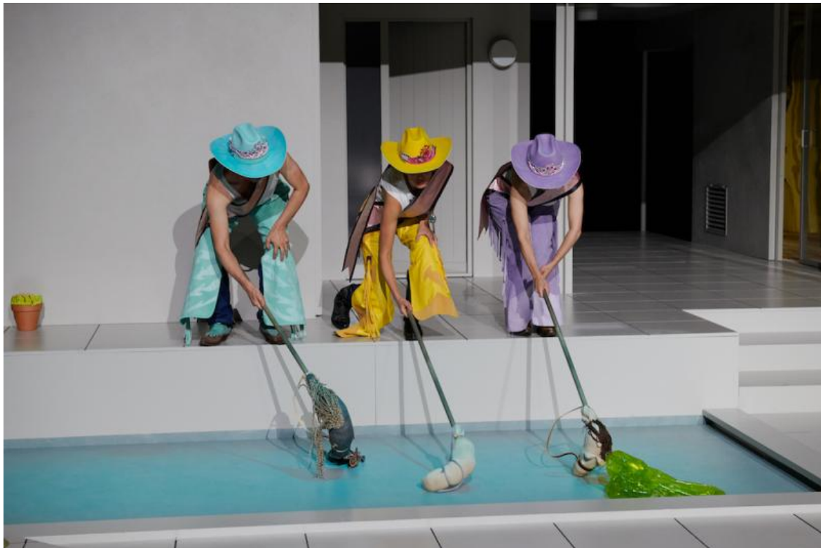
Brief interviews with hideous men - 22 types of loneliness di Yana Ross.

Broke House è un reiterarsi di situazioni, di interventi dei personaggi, rappresentazioni di sé stessi che alla lunga stanca e dà l'impressione di trovarsi di fronte a un raffinato "Casa Surace" traslocato dal Sud piccoloborghese alla Grande Mela, in atmosfere post Andy Warhol, senza troppo respiro.