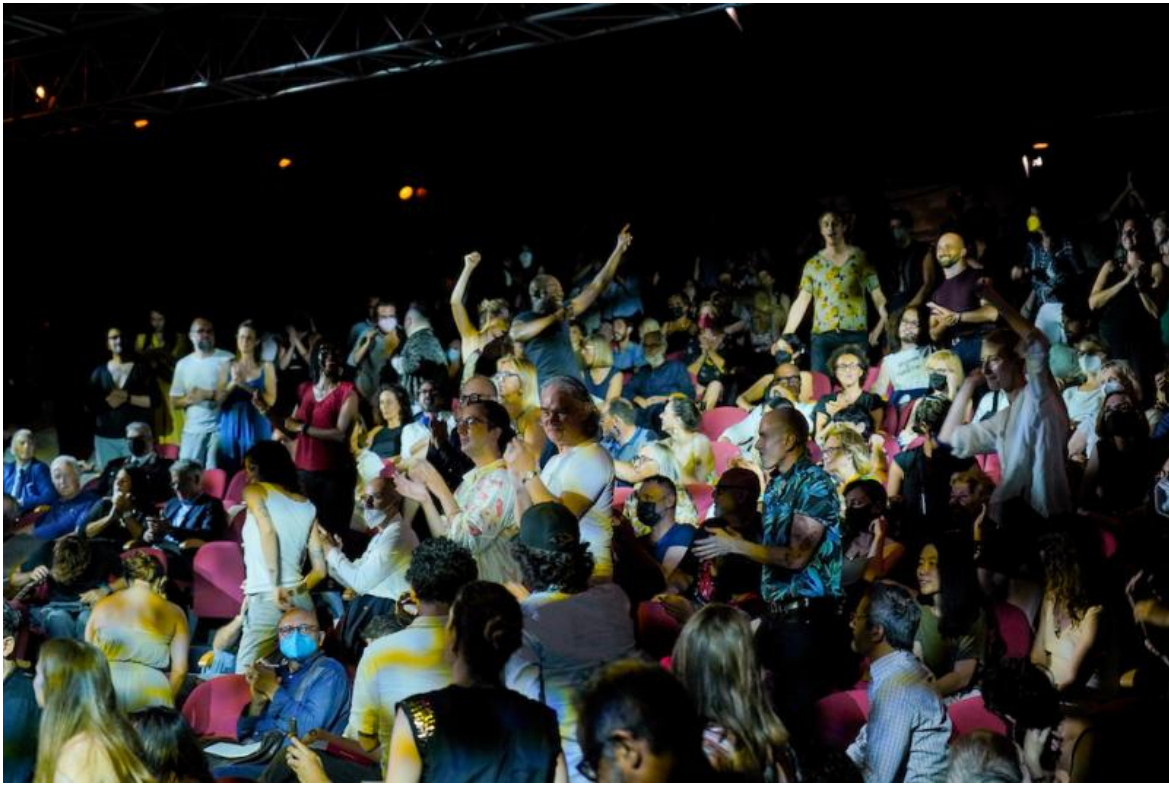
The Lingering Now, ph. Andrea Avezzù, courtesy La Biennale di Venezia.

Lo scatto avviene quando gli attori iniziano ad apparire in mezzo al pubblico, quando una telecamera li inquadra, e allora la memoria del film diventa testimonianza presente, più incisiva. Suonano chitarre, accendono qualche momento festoso tra gli spettatori, costituiti in gran parte dai giovani apprendisti attori o critici o registi dei laboratori della Biennale College. Gli attori ballano in mezzo al pubblico e coinvolgono a danzare, tra le sedie, senza assolutamente scardinare la forma e la gerarchia della sala all'italiana. Solo fanno alzare e muovere, sul posto, gli spettatori, dando un'illusione di libertà, di festa, di comunicazione.