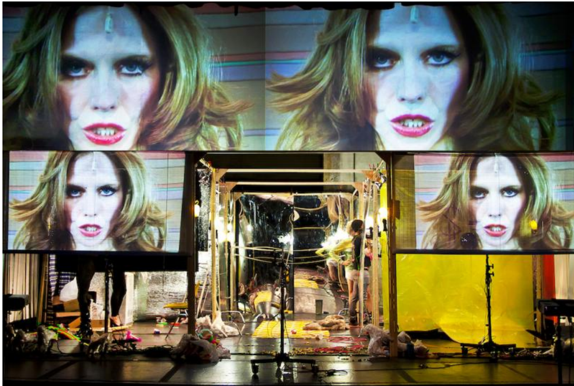
Broke House, ph. Ves Pitts.

che ci guardano intensi dallo schermo, il racconto di Yara che dal video diventa confessione in sala, sommessa, vicina a te, danno l'impressione di una vicinanza, un'empatia. C'è molta voglia, mi sembra, di appassionarsi, di provare sentimenti, anche se solo in superficie. E ci si accontenta, con entusiasmo e urletti di consenso, di un teatro documento, di un performance-reportage non particolarmente originale né approfondito, che fa leva sul bisogno di provare sentimenti politici.