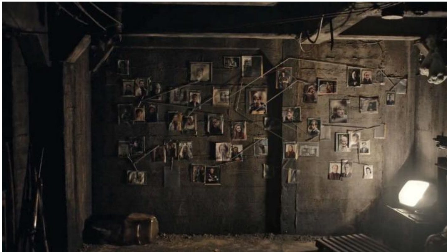
Baran bo Odar e Jantje Friese, Dark. I segreti di Winden (2017-2020).