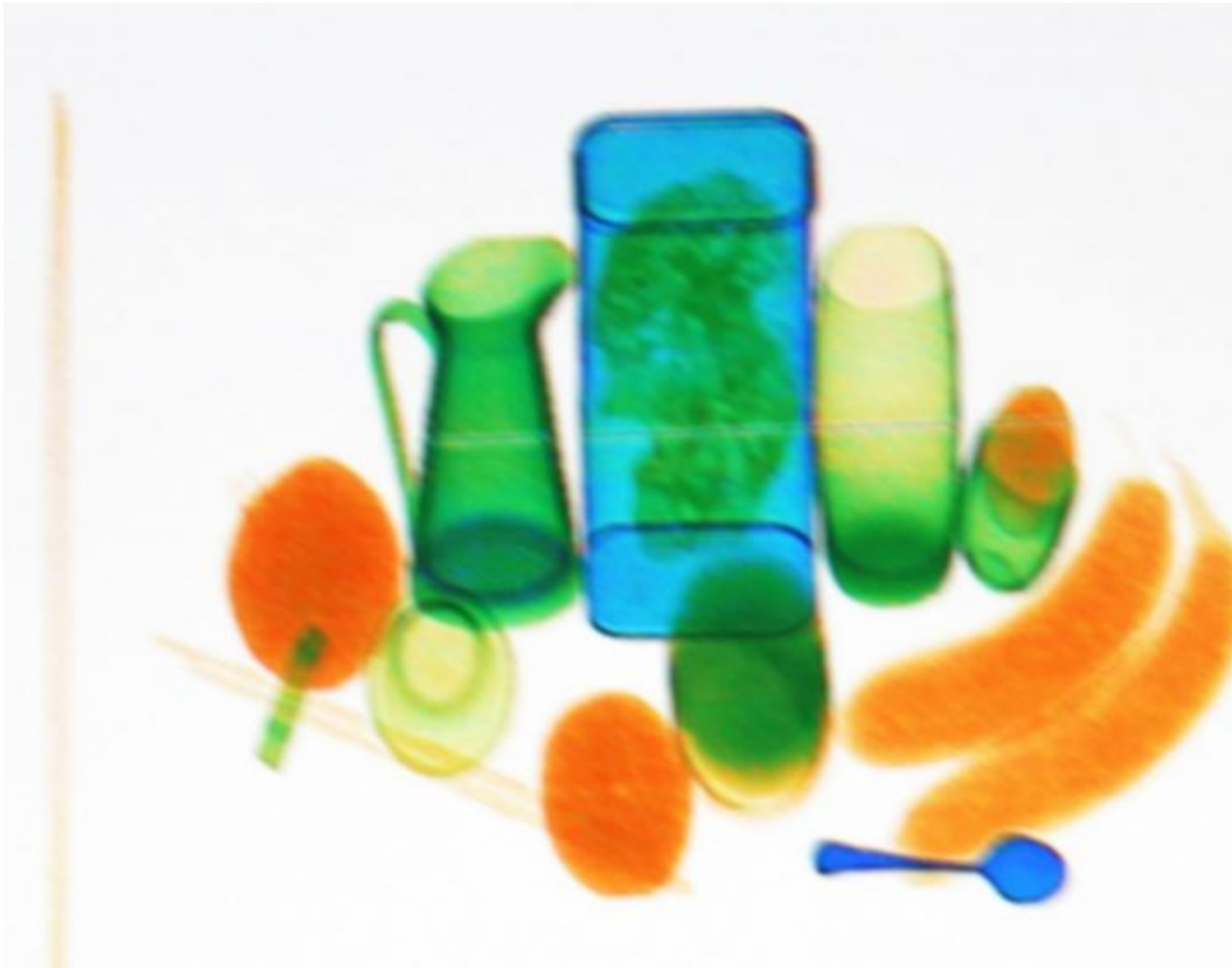
Claudio Beorchia, Natura morta per scanner, 2013, Bergamo, Collezione BACO.

Come scrive Zanchi, parafrasando la famosa frase pubblicitaria della Kodak «Voi premete il pulsante e la fotografia farà il resto» in «Voi non premete il pulsante e la metafotografia farà il resto», ci è che conta realmente il resto?*, ovvero ci è che è ancora ignoto, che è rimasto inesplorato, che ancora può costruire un nuovo rapporto con il fruitore e mettere in discussione le sue certezze trasformandosi in una alterità enigmatica.