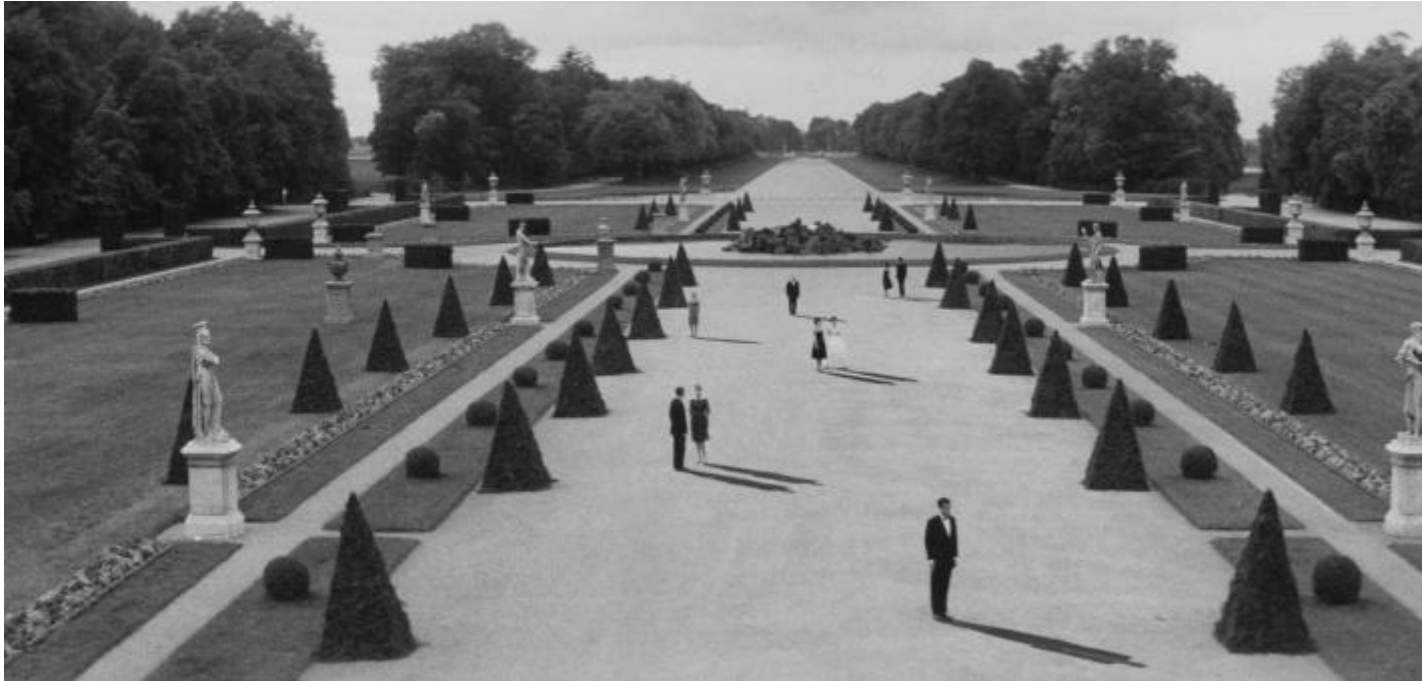
Alain Resnais, L'Année dernière à Marienbad (1961).

Zanchi si interroga in particolare sulle modalità e i percorsi grazie ai quali le immagini contemporanee riescano a ritrovare un'alterità enigmatica e una forza evocativa capaci di coinvolgere e toccare lo spettatore avviandosi in direzioni molteplici (scientifiche, oppure sociali, politiche, psicologiche, antropologiche, etc.). Il suo discorso non è mai passatista: per lui non si tratta di contrastare il proliferare delle immagini tra selfie e social di ogni tipo non scattando più fotografie per contrastare (invano) l'inquinamento visivo che impera, e neppure di andare contro le nuove tecnologie e scoperte scientifiche per ritrovare visioni contemplative e del profondo capaci di opporsi alla superficialità e all'affermatività che dominano i media contemporanei.