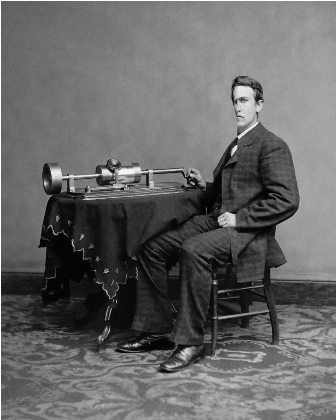
Lamberto Teotino, Sistema di riferimento monodimensionale SDRM19 , 2011, Courtesy dell'artista e mc2gallery, Milano.

Grazie all'uso di una innovativa machine à fumée , della sua invenzione della chronofotografia e all'uso di un flash sincronizzato, le immagini di Marey ci mostrano infatti l'invisibile, ciò che l'occhio umano non potrebbe mai vedere, e tutto questo attraverso immagini semplici e dirette, capaci di sfruttare le innovazioni tecniche dell'epoca, ma al contempo cariche di un lirismo straordinario dove l'aria appare come un fluido danzante. Nate cioè con l'intento scientifico di studiare i movimenti dell'aria quando incontrano degli ostacoli, si