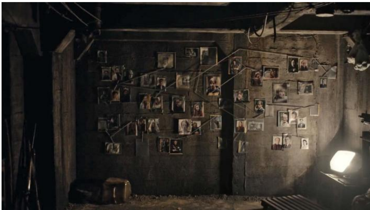
Baran bo Odar e Jantje Friese, Dark. I segreti di Winden (2017-2020).