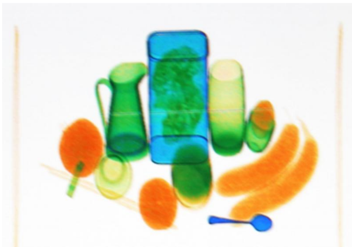
Claudio Beorchia, Natura morta per scanner, 2013, Bergamo, Collezione BACO.

Come scrive Zanchi, parafrasando la famosa frase pubblicitaria della Kodak «Voi premete il pulsante e la fotografia farà il resto» in «Voi non premete il pulsante e la metafotografia farà il resto», ciò che conta realmente è questo “resto”, ovvero ciò che è ancora ignoto, che è rimasto inesplorato, che ancora può costruire un nuovo rapporto con il fruitore e mettere in discussione le sue certezze trasformandosi in una alterità enigmatica.