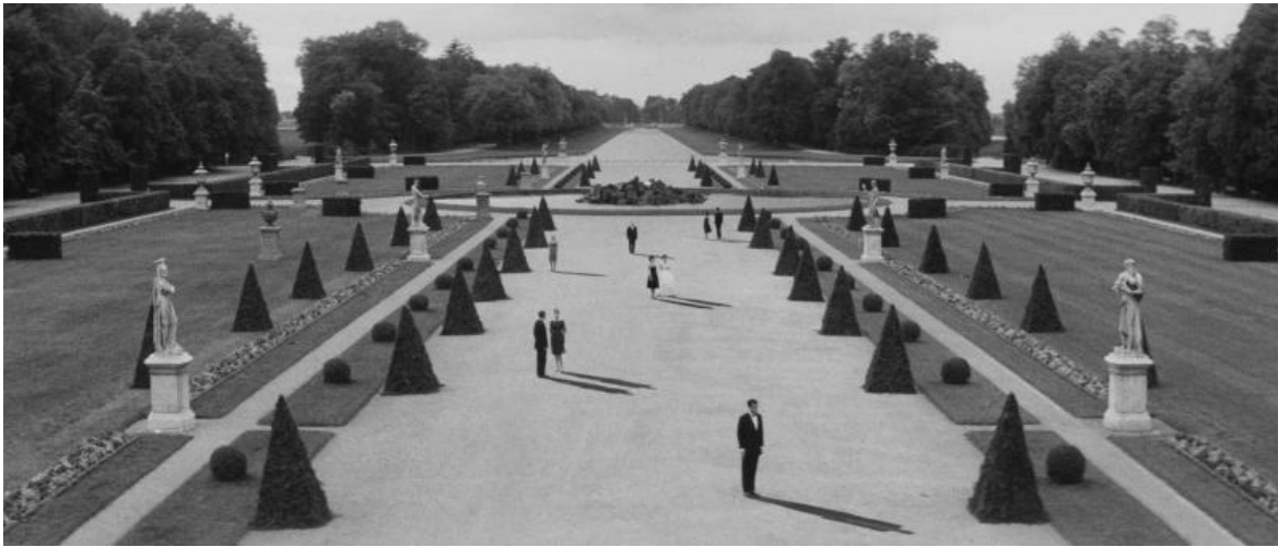
Alain Resnais, L'Année dernière à Marienbad (1961).

A suo avviso, senza dimenticare il passato né rinnegare il valore della memoria, ci si può anche immergere nell'intermedialità, entrare e usare diversamente le nuove tecnologie digitali, da Google Street View agli universi sintetici della Second Life, dalla Rete internet ai dispositivi di sorveglianza, dagli algoritmi all'intelligenza artificiale. Solo o anche grazie a tali nuove possibilità la fotografia e l'arte potranno estendere le loro potenzialità, far emergere ciò che è invisibile o le possibilità latenti del vedere.