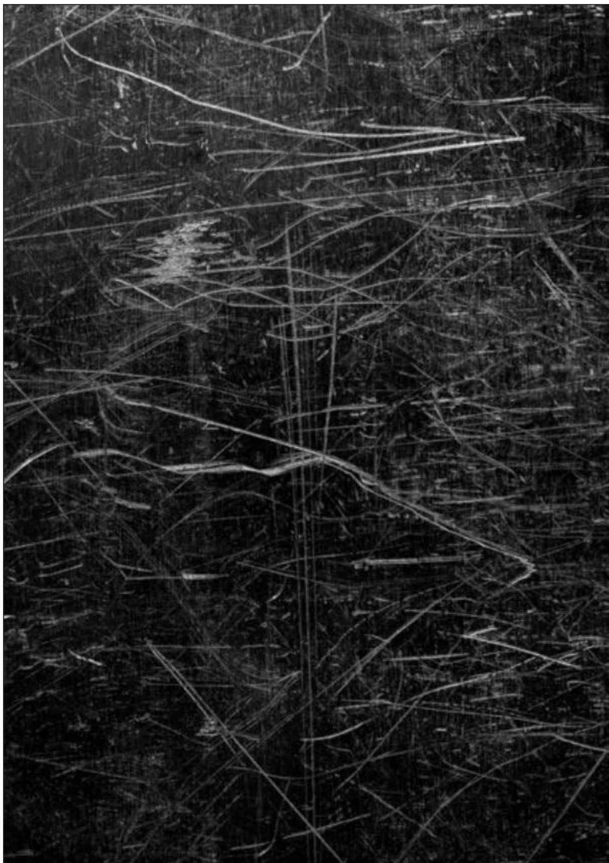
Paolo Ciregia, ShieldaII , dalla serie125, 2018.

Il suo intento – come racconta in un'intervista proprio a Mauro Zanchi, è quello «di rigenerare il passato, fornire uno spostamento di senso al preesistente, per azionare un ribaltamento compositivo e trasformativo con lo scopo di alterare il pensiero di chi guarda» ( Metafotografia. Dentro e oltre il medium nell'arte contemporanea , Skinnerboox, 2019). Nuovamente ci si trova di fronte ad opere più costruite in seconda battuta che scattate direttamente dall'autore.