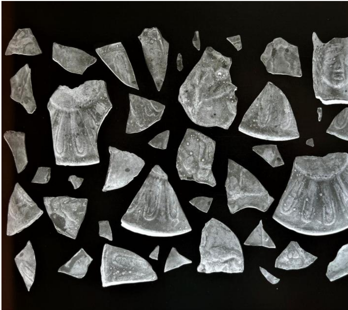
Giulia Parlato, Evidence n.7, 2021, Acetato su Lightbox, © Giulia Parlato.

Il confronto con la mole di immagini riesumate dagli Archivi Alinari non può lasciare indifferenti, la mostra non vuole permetterlo: lo strappo che si sente può essere letto come la caduta precipitosa in terra di Icaro o una tela di Fontana, in ogni caso ci è che gli occhi assorbono girando tra le sale e forse deve lasciare spazio al quesito, dopo la marcata esclamazione del titolo.