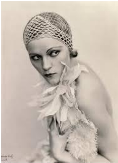
Wanda Wulz, Newa , 1930 ca., stampa alla gelatina ai sali d'argento con viraggio, Archivi Alinari, archivio Studio Wulz, Firenze.

Altrettanto affascinante è poter cogliere come la poetica di alcune autrici venisse sviluppata e su quali espedienti si focalizzasse, scoprendo intuizioni di una raffinatezza che tanto ha da insegnare ancora oggi, come nell'immagine Solarized Calla Lilies di Carlotta Corpron (1948), in cui emerge dalla carta bianca una forma bianca ancora come i petali delle calle, sporcata con un accento d'ombre dato dalla solarizzazione per farne cogliere i contorni e le pieghe. Forse il fine di una mostra cosí strutturata, che tanto offre ma poco dà ogni opera vuole e può narrare, vuol proprio portare il visitatore a diventare per un momento ricercatore, farlo partire da un dato circoscritto e vedere dove può condurlo. Un esempio per tutti, approfondendo quel poco, della Corpron si scopre essere stata pupilla di Alfred Stieglitz, nonché foriera dello stile astratto in fotografia che condizionò a seguire molti altri autori statunitensi.