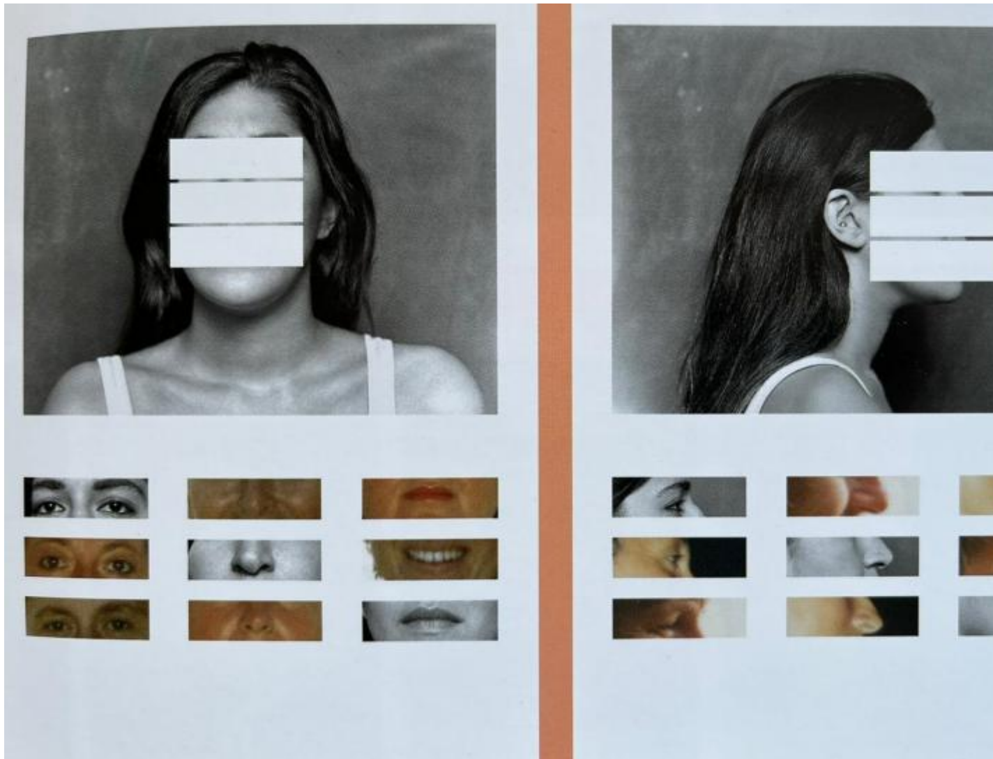
Alba Zari, Physiognomy, process of exclusion, 2016 | 2017, stampa digitale su carta Hahnemühle Photo gloss Baryta, © Alba Zari

L'esigenza comunicativa è spostata alla scoperta di scatti di realtà insoliti, come nelle opere di Roselena Ramistella, che porta in mostra "Le guaritrici", le donne che in alcuni angoli della Sicilia ancora si avvalgono di conoscenze e superstizioni antiche per curare gli infermi e cambiare le decisioni della fortuna. La vita e i volti narrati assumono l'incisività dello sguardo rivelatore che non lascia scampo: le mani, le rughe, gli sguardi sono segni scolpiti, inequivocabili.