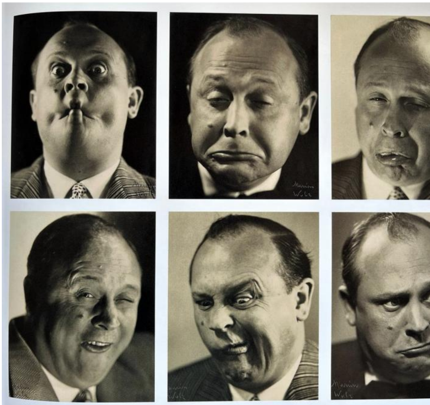
Marion Wulz, "Mimo", 1954, stampe alla gelatina ai sali d'argento, Archivi Alinari - archivio studio Wulz, Firenze.

Il vero campo ignoto \tilde{\infty} individuabile, allora, negli esempi proposti del panorama contemporaneo: quasi in assenza di trazione, vista come una forza che agisce su un corpo tendendo ad allungarlo nella sua stessa direzione, il suolo di partenza ha come lasciato totale libero arbitrio nelle conseguenze formali da trarre, generando isole ancora da associare a un continente o addirittura tra di loro. Questa la sfida, allora: come nel "Rendering" (1990) dell'opera incompiuta di Schubert realizzato da Luciano Berio, il visitatore e lo storico di oggi sono tenuti a formulare un sentiero non ancora ben tracciato, a costruire quella base di sicurezza che possa spingere al dialogo e unire i punti anche distanti tra di loro.