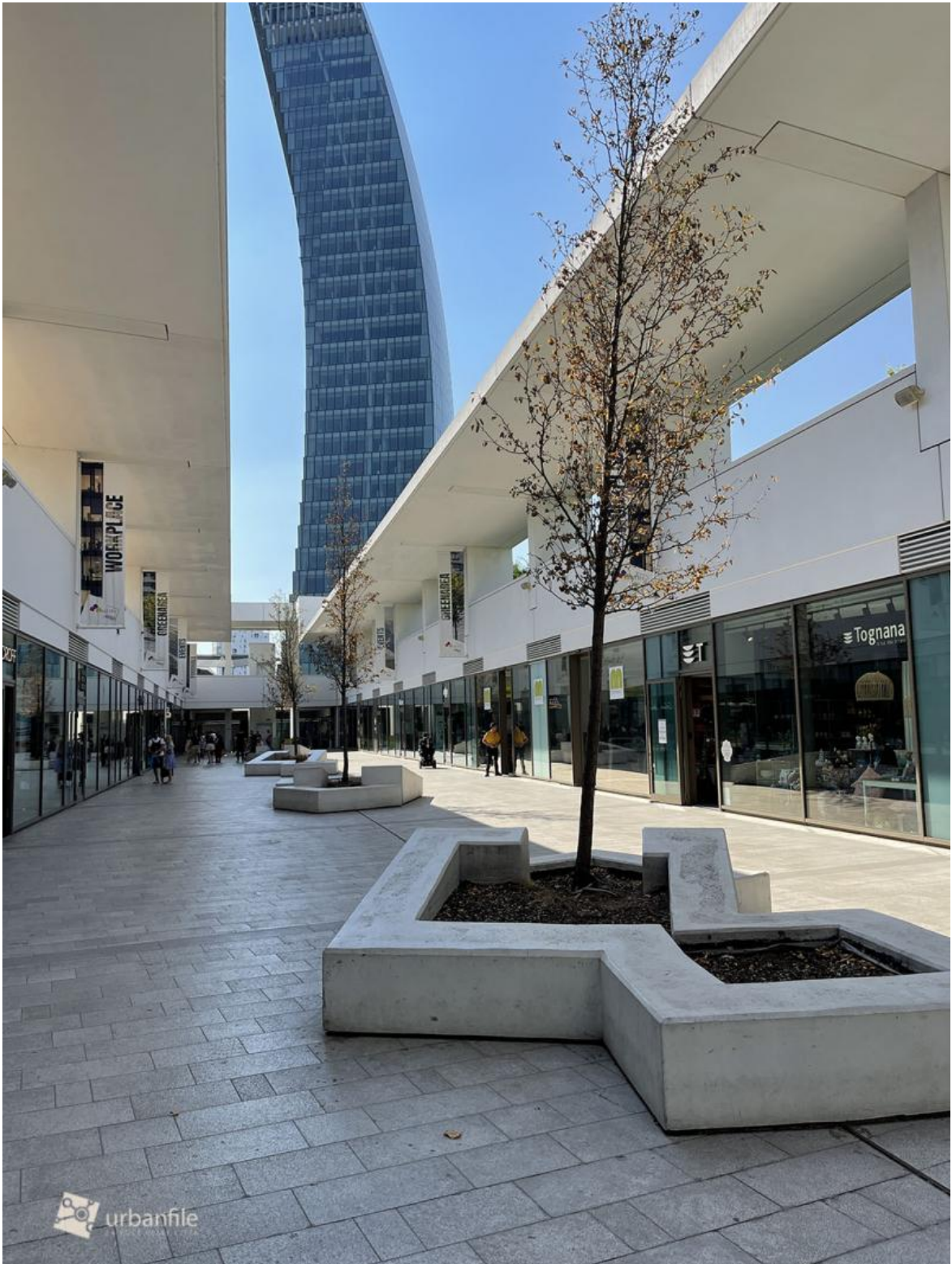
Alberelli a City Life.