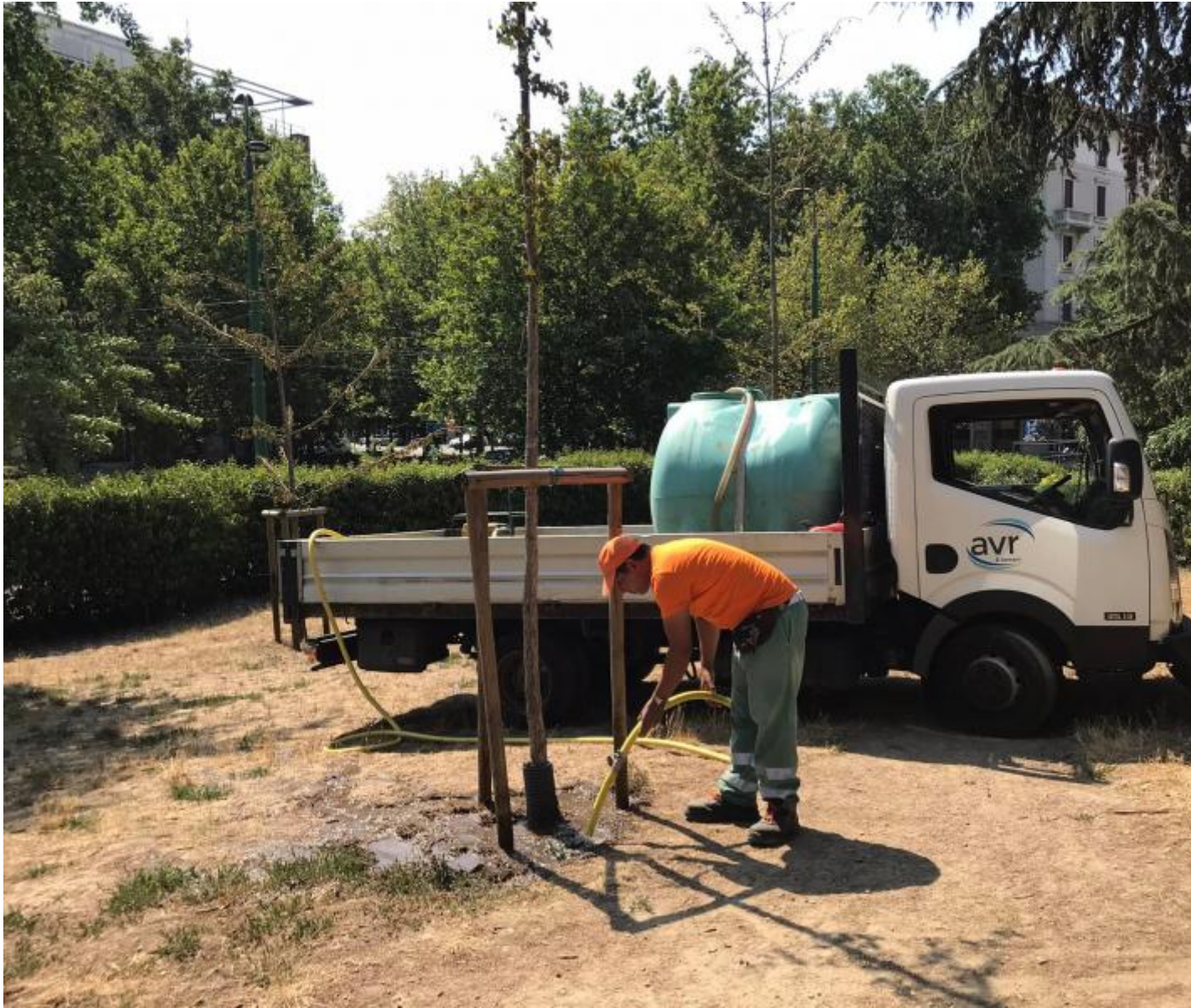
Autobotte del Comune.