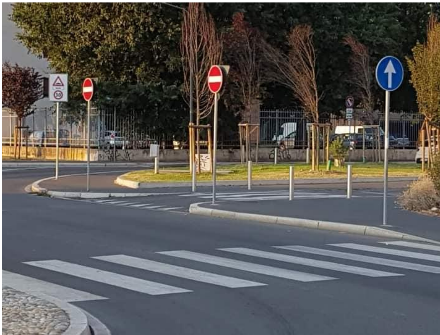
Alberelli a piazzale Abbiategrasso.