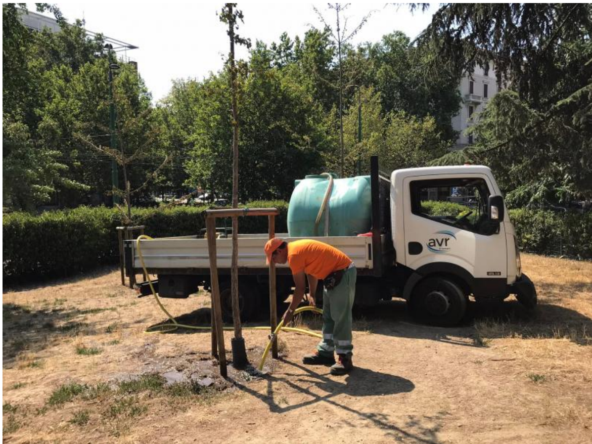
Autobotte del Comune.