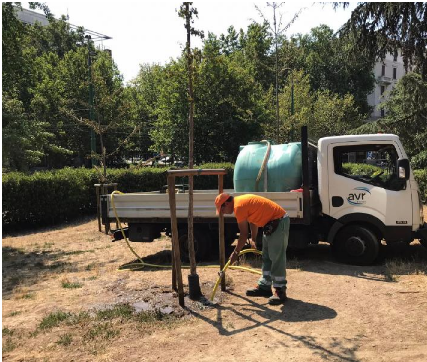
Autobotte del Comune.