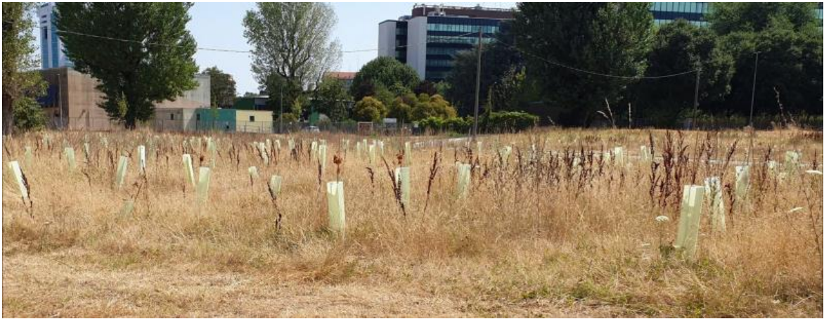
Impianto Parco Travaglia, Corsico