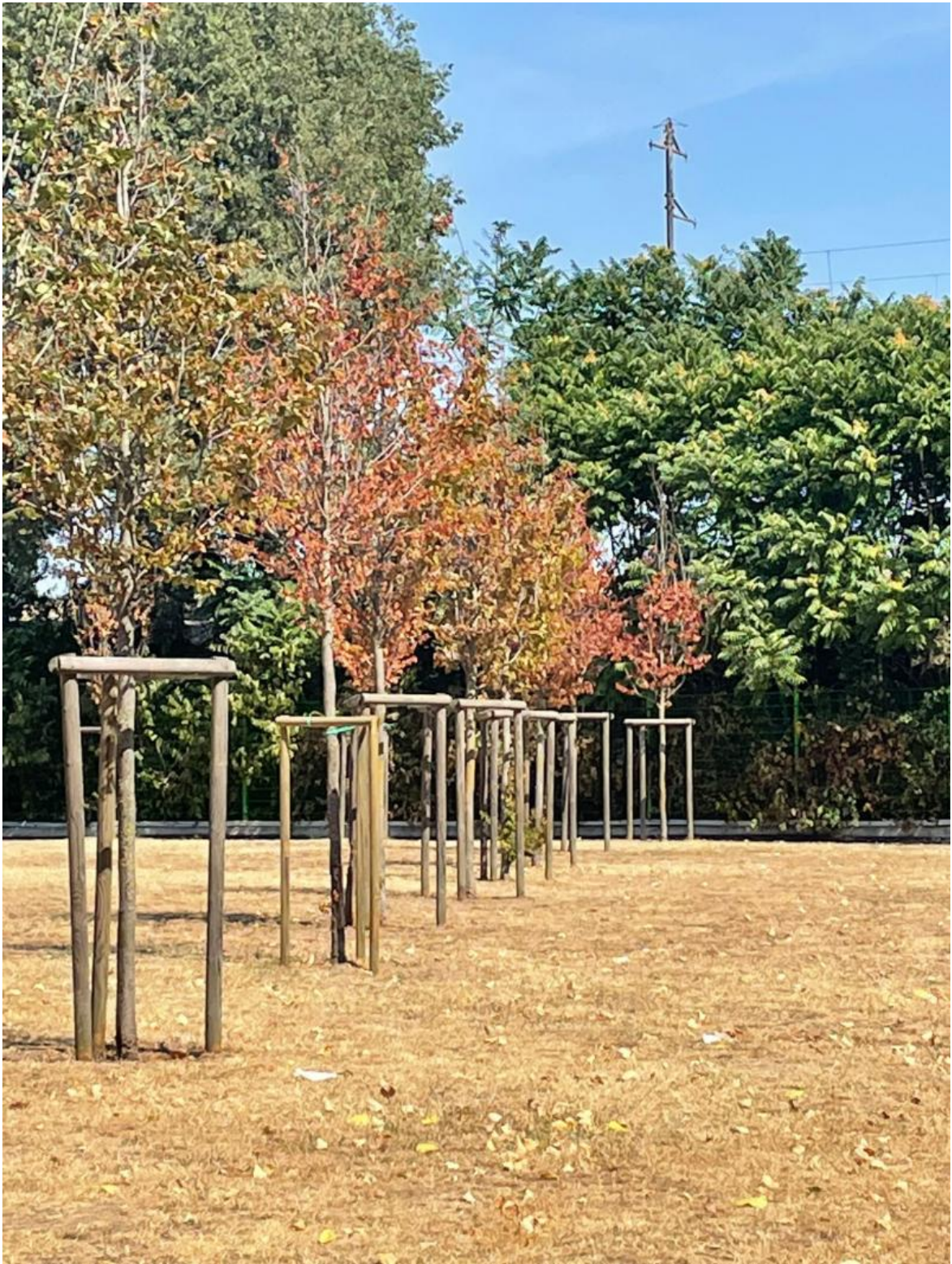
Alberelli, via Cosenza.