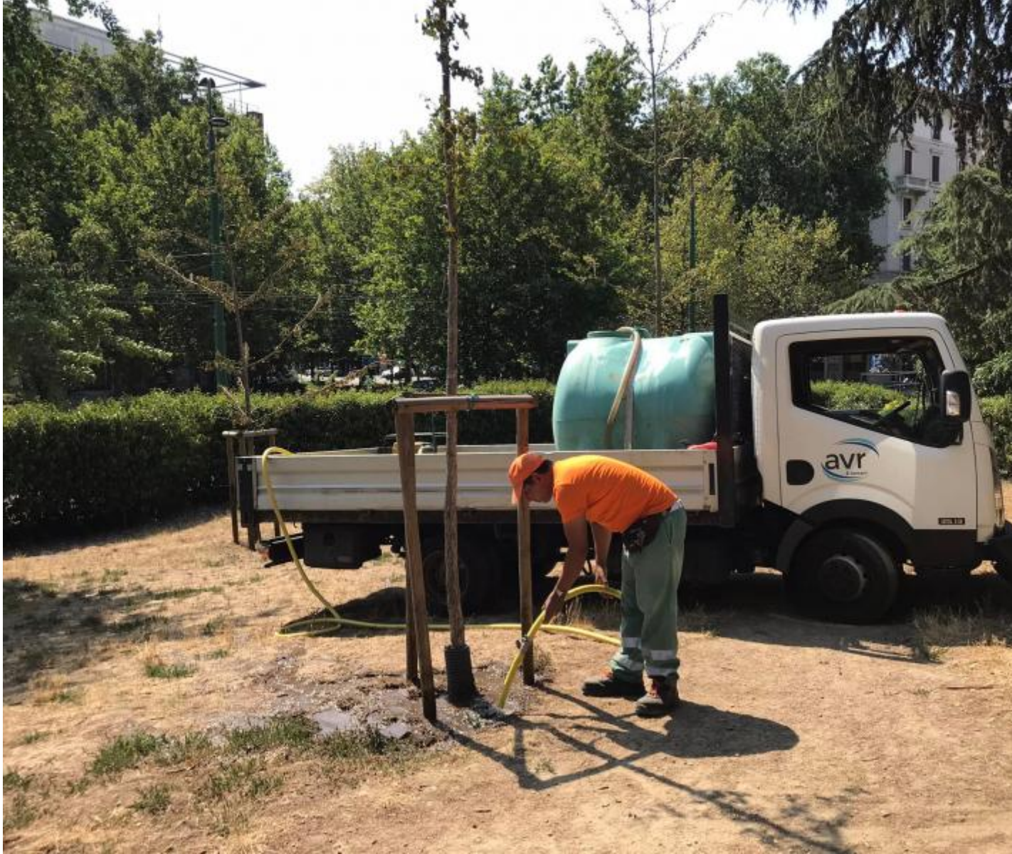
Autobotte del Comune.