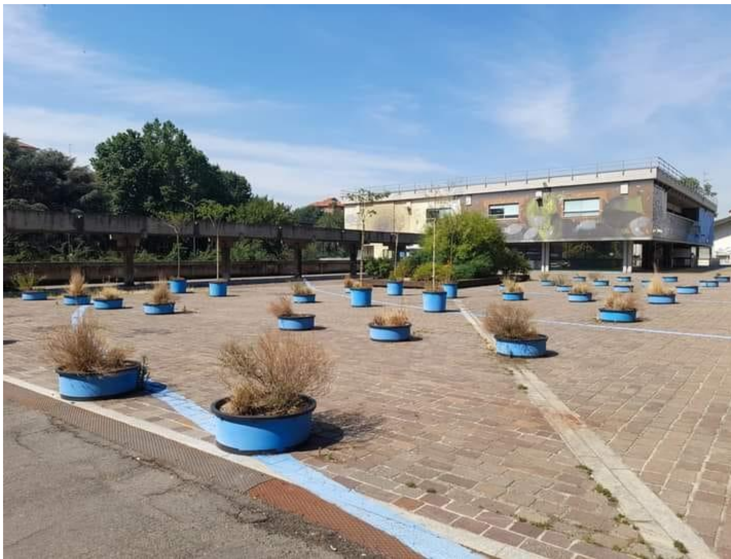
Vasi, via Boifava.

Il 7 luglio, il sindaco di Buccinasco, Rino Pruiti, ha dichiarato sul sito del proprio Comune: «L'ordinanza proposta da Regione Lombardia è utile e giusta per quei territori regionali che purtroppo in questo momento sono in grande sofferenza idrica. Non è il nostro caso, non è il caso dei Comuni della Città metropolitana dove il sottosuolo è molto ricco di acqua e la falda addirittura sovrabbondante. Possiamo inoltre contare su una gestione virtuosa dell'intera filiera idropotabile da parte del Gruppo CAP, la società partecipata a capitale interamente pubblico che gestisce il servizio idrico integrato del nostro territorio, quindi acquedotti, pozzi e altre infrastrutture. Con queste temperature e la mancanza di pioggia dobbiamo tutelare il nostro verde, non abbiamo quindi emesso alcuna ordinanza. Non ci sono divieti».