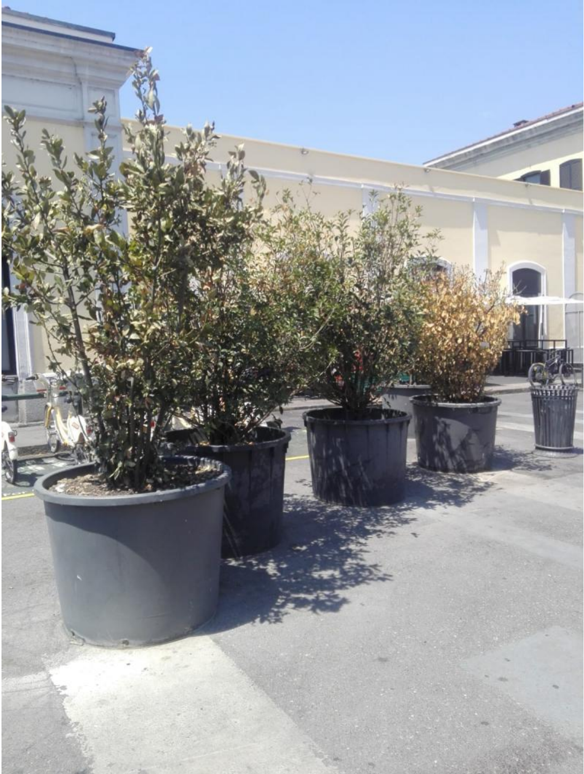
Alberelli in vaso, Porta Genova

patrimonio arboreo, ha equiparato l'innaffiatura di alberi, piante e parchi al lavaggio di moto e automobili?