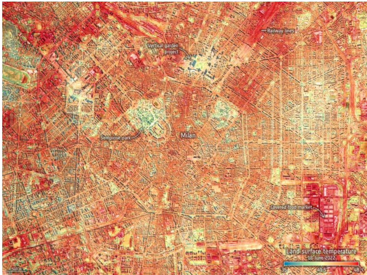
Rilevazione satellitare NASA della temperatura al suolo della città di Milano il 18 giugno.