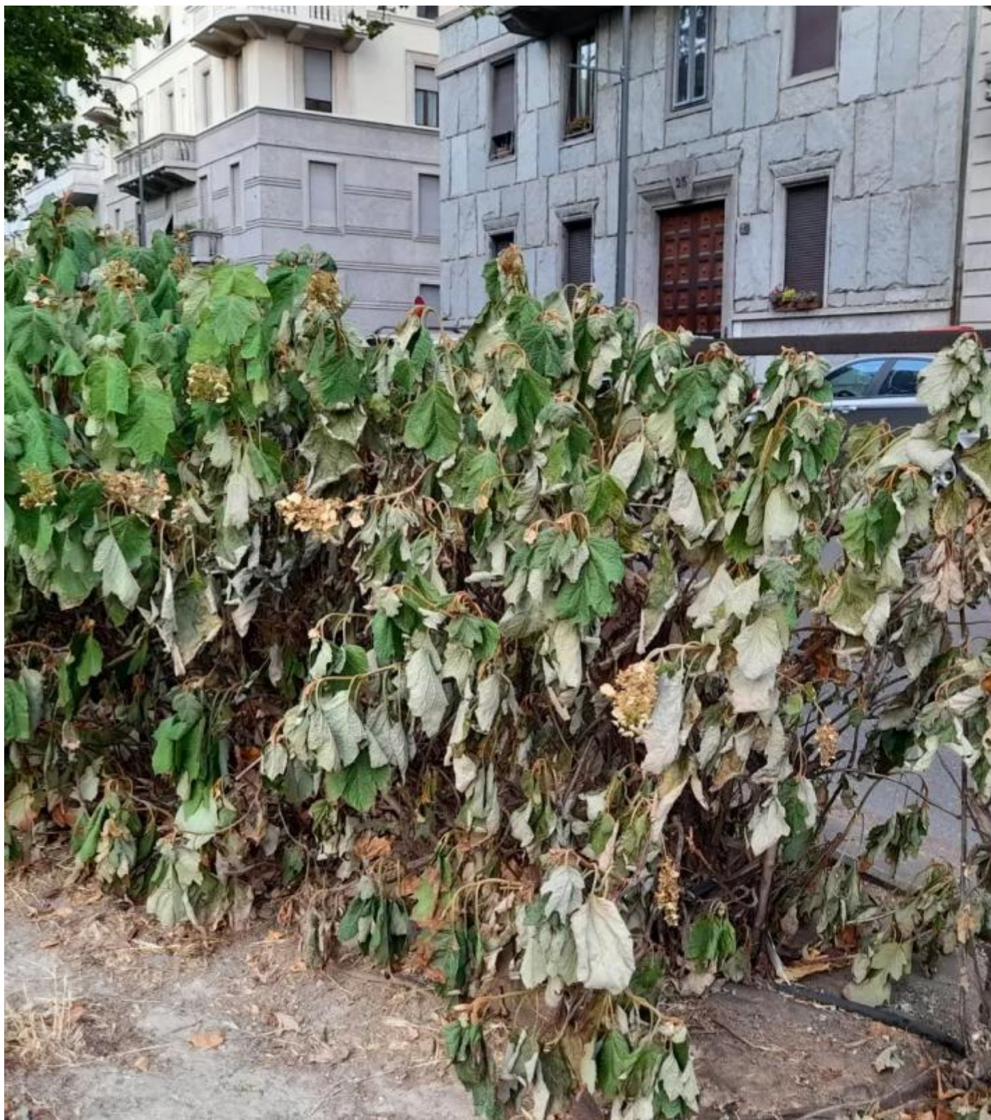
Arbusti in aula spartitaffico, viale dei Mille.