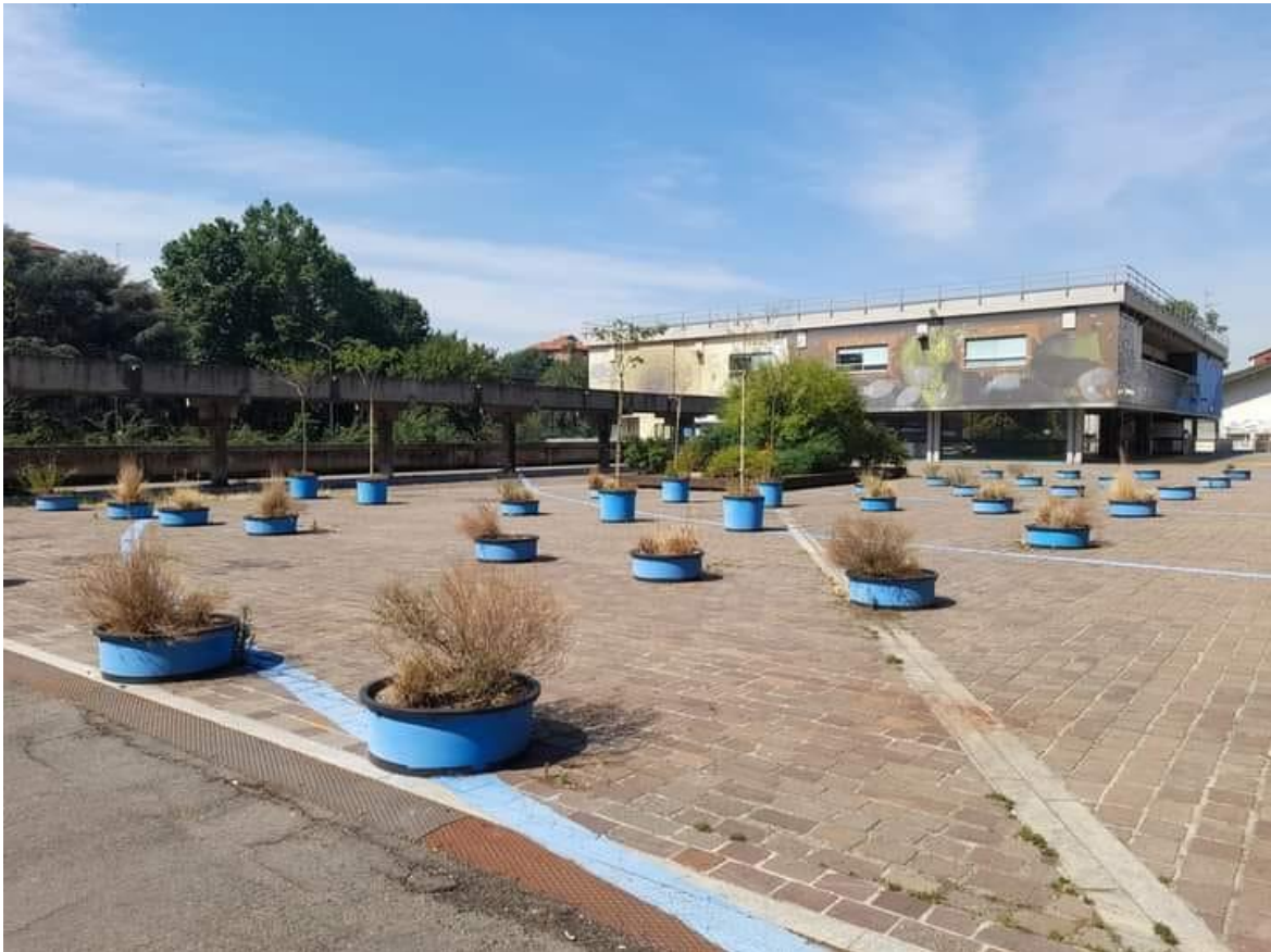
Vasi, via Boifava.

Il 7 luglio, il sindaco di Buccinasco, Rino Pruiti, ha dichiarato sul sito del proprio Comune: “L’ordinanza proposta da Regione Lombardia è utile e giusta per quei territori regionali che purtroppo in questo momento sono in grande sofferenza idrica. Non è il nostro caso, non è il caso dei Comuni della Città metropolitana dove il sottosuolo è molto ricco di acqua e la falda addirittura sovrabbondante. Possiamo inoltre contare su una gestione virtuosa dell’intera filiera idropotabile da parte del Gruppo CAP, la società partecipata a capitale interamente pubblico che gestisce il servizio idrico integrato del nostro territorio, quindi acquedotti, pozzi e altre infrastrutture. Con queste temperature e la mancanza di pioggia dobbiamo tutelare il nostro verde, non abbiamo quindi emesso alcuna ordinanza. Non ci sono divieti”.