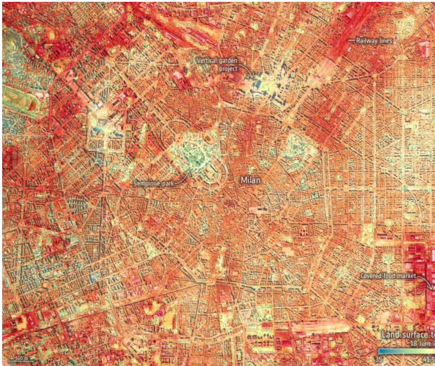
Rilevazione satellitare NASA della temperatura al suolo della città di Milano il 18 giugno.

Stefano Mancuso, botanico e neurobiologo, celebre divulgatore e sostenitore della causa degli alberi, da diversi anni in ogni occasione sostiene che “contro il riscaldamento globale non esiste una tecnologia più efficiente ed economica degli alberi, ne servono 1000 miliardi entro il 2030”. Mancuso ha anche sottolineato che i luoghi in cui tali progetti di forestazione sarebbero più necessari sono le città. È qui che la loro presenza si dimostra fondamentale per contrastare le emissioni di CO2 responsabili del riscaldamento globale che come, abbiamo constatato quest'estate, non sembra voler attendere le previsioni dei climatologi per stabilire la velocità a cui correre.