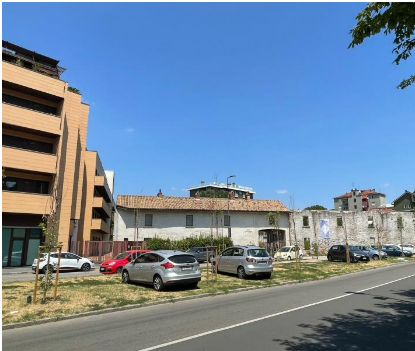
Alberelli, via Paravia.

Nelle settimane più nere e terribili per il verde milanese, con migliaia di piante perse (del 30 luglio l'appello dei cittadini di Melzo per salvare 800 neo alberi di ForestaMi che stanno morendo), tuttavia qualcosa di straordinario è accaduto. Sulla pagina di Forestami e poi Dimenticami, e sui profili Facebook di moltissimi milanesi sono apparse le fotografie di persone che, armate di innaffiatori, taniche, bottiglie si sono preoccupate di salvare le piante del proprio quartiere (per contagio, foto di innaffiatori e innaffiatori a poco a poco sono apparsi sui social in tutta Italia). Perfino i media hanno cominciato a occuparsi di questa non troppo silenziosa protesta, e giornali e telegiornali hanno mostrato immagini della rivolta degli innaffiatori: donne e uomini, ragazze e ragazzi, bambini e bambini, anziani e anziane preoccupati di salvare le piante sotto casa, abbandonate a se stesse: quegli alberi e quegli arbusti che fanno parte della loro vita quotidiana e dei quali, forse, fino a quel momento non si erano mai del tutto accorti.