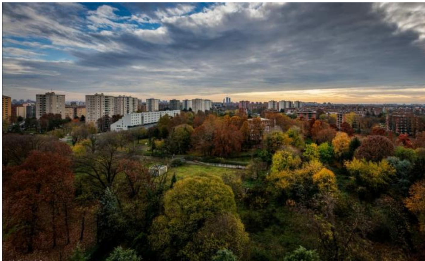
Bosco di via Falk, Milano.

Ci si chiede, pertanto, in base a che principio piantare alberi e consumare suolo possano far parte dello stesso programma politico e amministrativo. In altre parole, se abbia davvero senso piantare alberi per poi tagliare boschi, asfaltare prati e cementificare aree dismesse, come accadrà fra breve, a Milano, in via Falk, dove un terreno di proprietà delle Curia, abbandonato a se stesso e diventato un bosco urbano lussureggiante , è stato ceduto a una società immobiliare per l'immane progetto residenziale di lusso. Insomma, per quale ragione tutta questa enfasi nei confronti di neo alberi e così poca attenzione a quelli che abbiamo qui e ora: e non solo alberi, ma anche arbusti, erbe e prati, ovvero quel corpus di vita vegetale che insieme dà luogo a importantissimi ecosistemi?