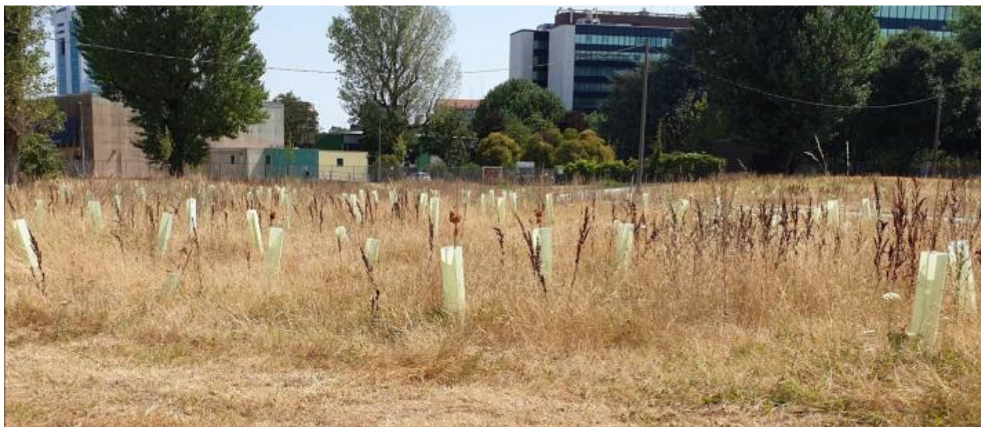
Impianto Parco Travaglia, Corsico