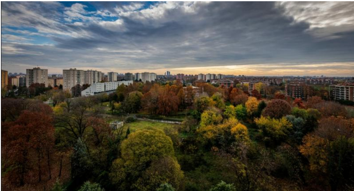
Bosco di via Falk, Milano.

Ci si chiede, pertanto, in base a che principio piantare alberi e consumare suolo possano far parte dello stesso programma politico e amministrativo. In altre parole, se abbia davvero senso piantare alberi per poi tagliare boschi, asfaltare prati e cementificare aree dismesse, come accadrà fra breve, a Milano, in via Falk, dove un terreno di proprietà delle Curia, abbandonato a se stesso e diventato un bosco urbano lussureggiante, è stato ceduto a una società immobiliare per l'immane progetto residenziale di lusso. Insomma, per quale ragione tutta questa enfasi nei confronti di neo alberi e così poca attenzione a quelli che abbiamo qui e ora: e non solo alberi, ma anche arbusti, erbe e prati, ovvero quel corpus di vita vegetale che insieme dà luogo a importantissimi ecosistemi?