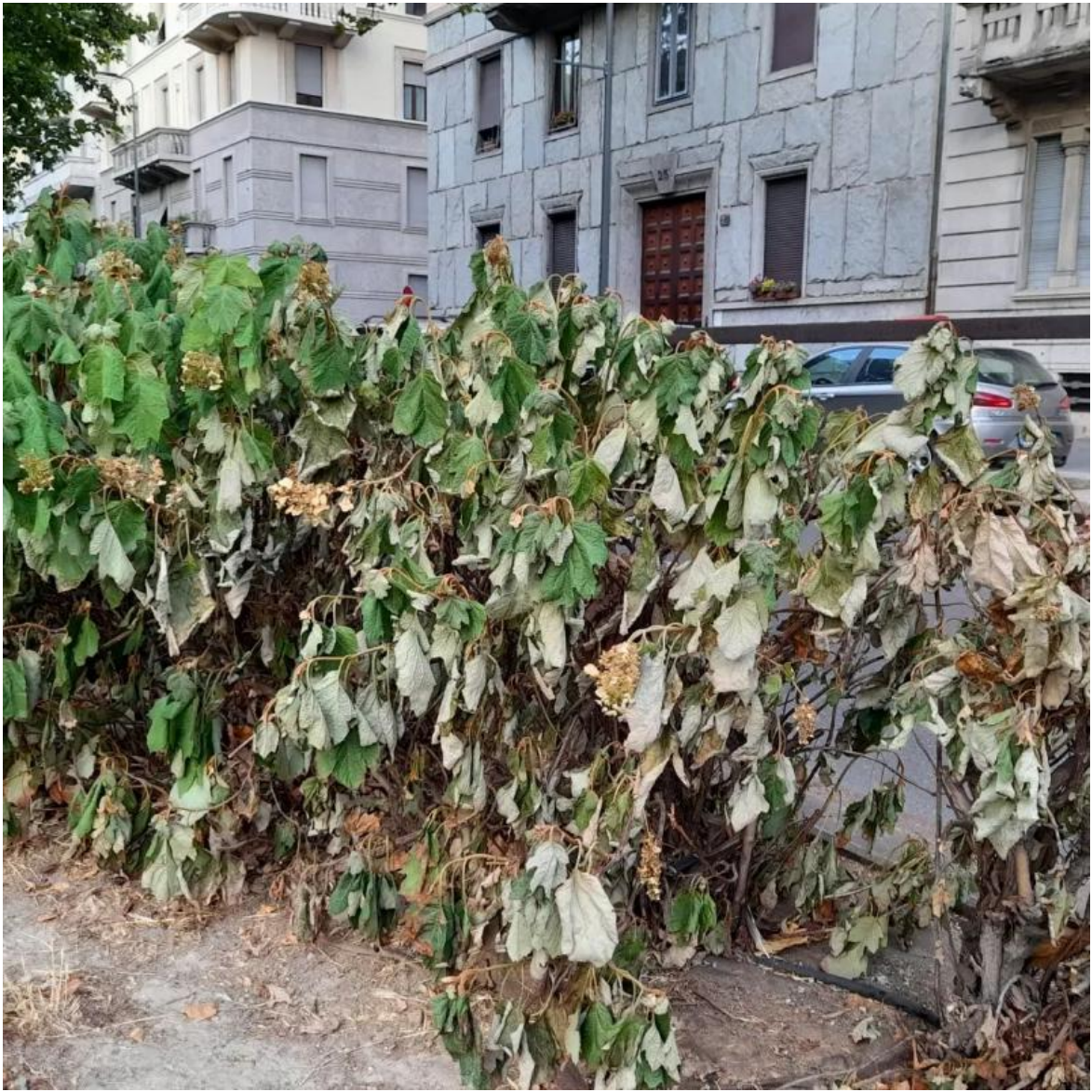
Arbusti in aula spartitaffico, viale dei Mille.