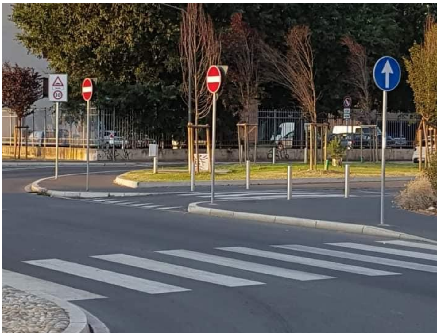
Alberelli a piazzale Abbiategrasso.