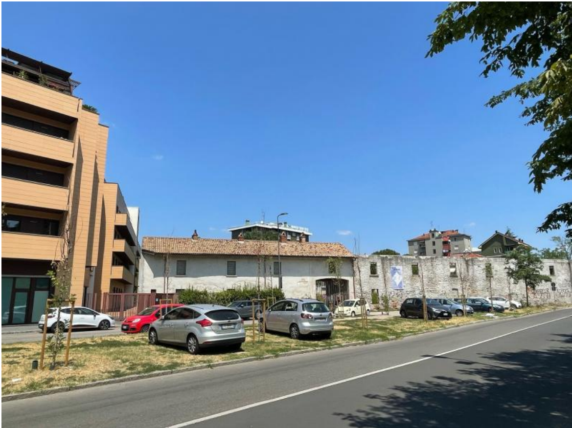
Alberelli, via Paravia.

Nelle settimane più nere e terribili per il verde milanese, con migliaia di piante perse (è del 30 luglio l'appello dei cittadini di Melzo per salvare 800 neo alberi di ForestaMi che stanno morendo), tuttavia qualcosa di straordinario è accaduto. Sulla pagina di Forestami e poi Dimenticami, e sui profili Facebook di moltissimi milanesi sono apparse le fotografie di persone che, armate di innaffiatori, taniche, bottiglie si sono preoccupate di salvare le piante del proprio quartiere (per contagio, foto di innaffiatori e innaffiatori a poco a poco sono apparsi sui social in tutta Italia). Perfino i media hanno cominciato a occuparsi di questa non troppo silenziosa protesta, e giornali e telegiornali hanno mostrato immagini della rivolta degli innaffiatori: donne e uomini, ragazze e ragazzi, bambini e bambini, anziani e anziane preoccupati di salvare le piante sotto casa, abbandonate a se stesse: quegli alberi e quegli arbusti che fanno parte della loro vita quotidiana e dei quali, forse, fino a quel momento non si erano mai del tutto accorti.