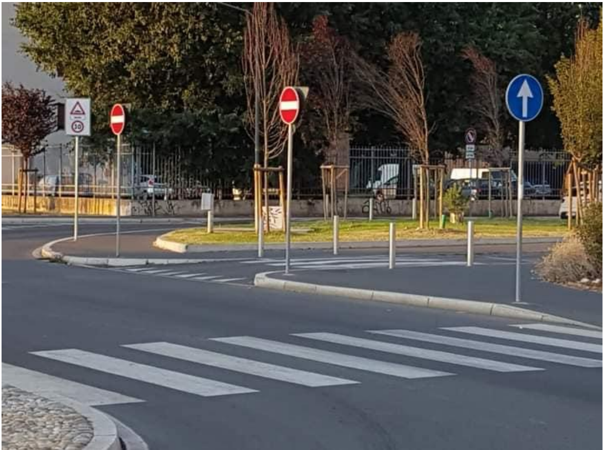
Alberelli a piazzale Abbiategrasso.