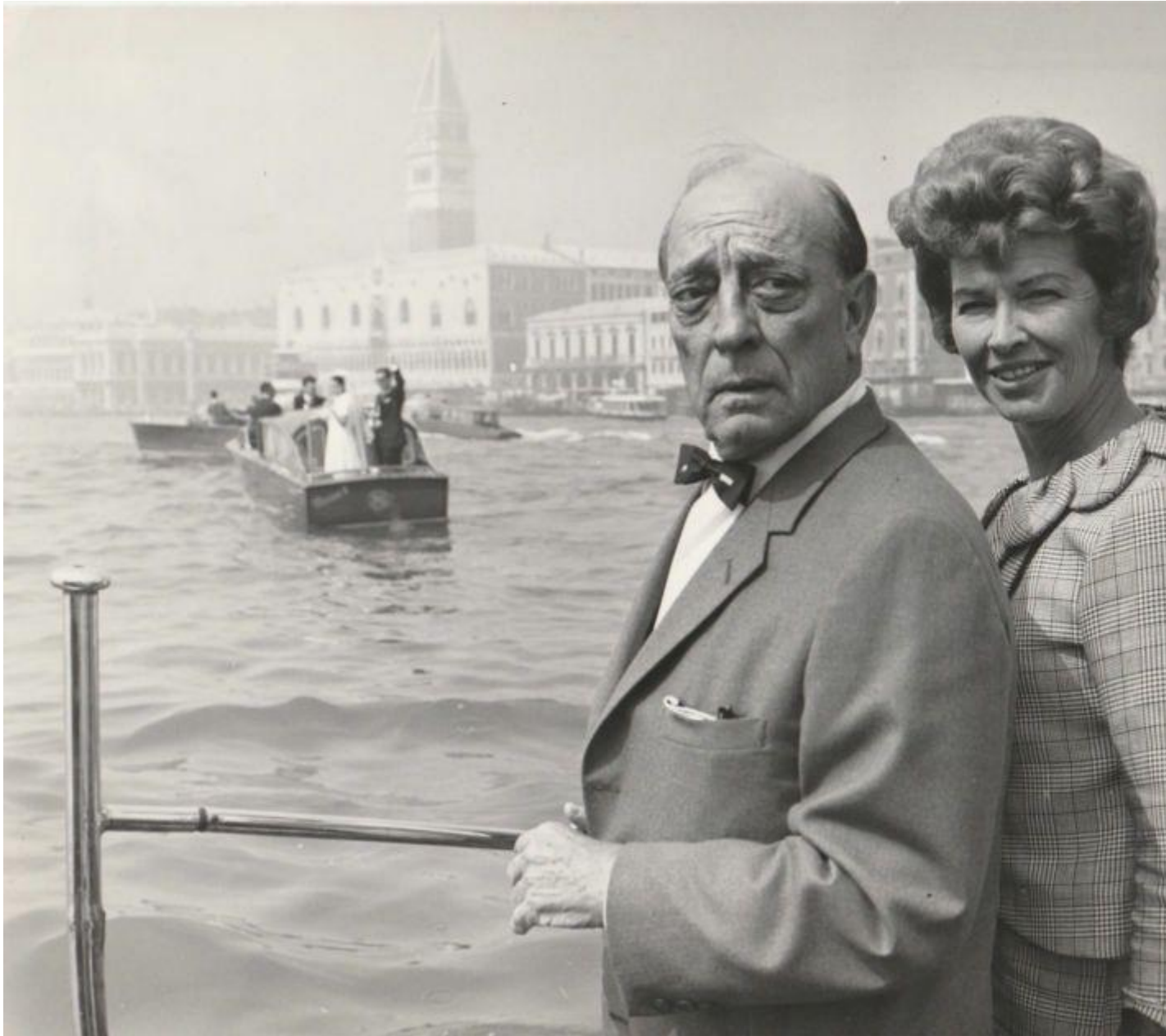
Buster Keaton con la moglie Eleanor alla Mostra del 1965.

Sul ruolo della critica cinematografica e i suoi rapporti con la Mostra, Brunetta offre la parola ad autori di ogni epoca per sottolinearne l'intelligenza, la qualità del giudizio e della scrittura; al tempo stesso, tuttavia, ne rileva anche l'ottusità dello sguardo, dovuta a pregiudizi ideologici, o a limiti culturali che nel tempo mietono vittime, per così dire, anche tra venerati maestri come Hitchcock e Fellini.