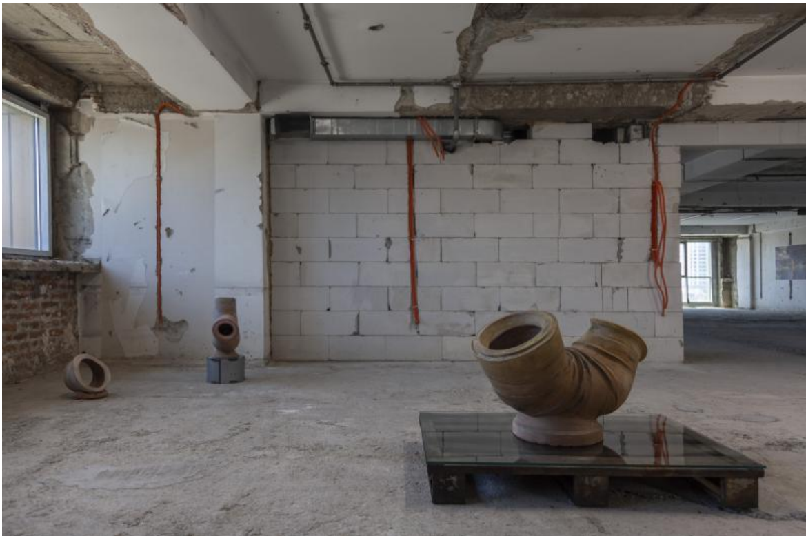
Thirty Plumbers in the Belly, 2021, © Jumana Manna.

Se, dunque, Manifesta è incentrata sulla possibilità della cultura di contribuire a una rigenerazione territoriale, diversi progetti vertono proprio su questo: per esempio una ex fabbrica di mattoni collocata in piena città, ormai fatiscente, è stata trasformata dal collettivo raumlaborberlin in un punto di riferimento per la creatività interdisciplinare e riportata così all'interno delle dinamiche cittadine dopo esserne stata per decenni esclusa. Il percorso ferroviario ormai inutilizzato che collegava l'ex fornace con tutta la Jugoslavia e oltre consentendo di trasferire ovunque i mattoni è stato in parte trasformato in Green Line, ossia un corridoio pedonale piacevolmente inverdito da alberi attualmente in fase di piantumazione, e infrastrutturato in modo che ci si possa anche sostare.