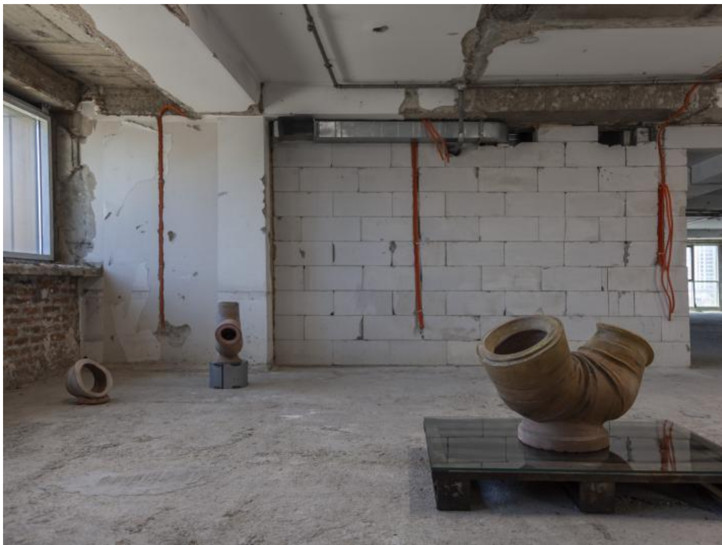
Thirty Plumbers in the Belly, 2021, © Jumana Manna.

Un altro spazio sul quale si è intervenuti è l'ex Biblioteca Hivzi Sulejmani, per la quale la città stava cercando una destinazione. Trasformato in Center for Narrative Practice , ossia sede in cui testare nuove possibili modalità di storytelling all'interno di un ambiente sociale, urbano ed ecologico, l'edificio è arredato, dotato di una piccola ma selezionata scelta di libri e di un bar nel piacevole giardino alberato. Dopo i cento giorni di durata di Manifesta dovrebbe poter proseguire la propria attività, dapprima con il sostegno economico dei fondi predisposti da Manifesta stessa, poi autonomamente.