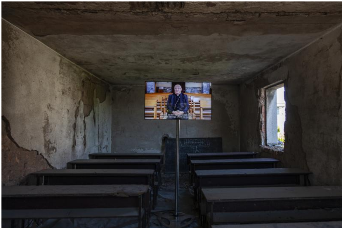
Hertica School House_School without School , 2022, © ETEA Photo © Manifesta 14 Prishtina, Majlinda Hoxha.

La crescente attenzione al tessuto territoriale da parte di Manifesta e il suo progressivo avvicinamento a questioni di urbanismo strategico fa della manifestazione un interessante spazio pubblico di discussione e di riflessione.