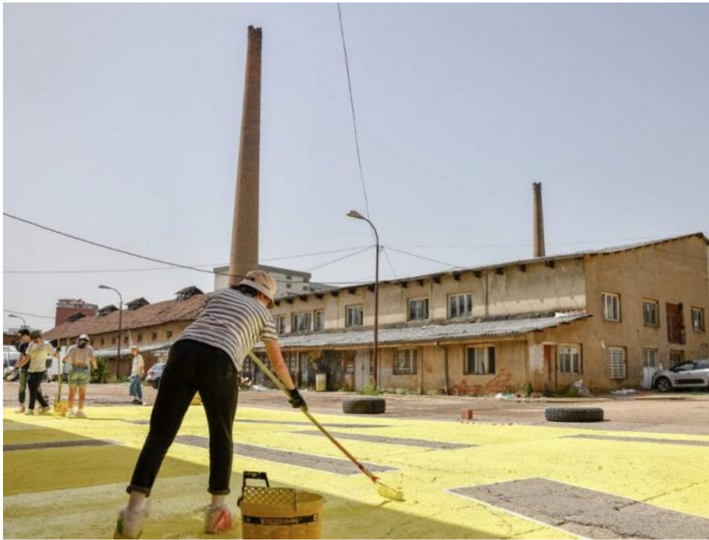
Urban intervention at Hivzi Sulejmani Library.

Pristina Ã una cittÃ ibrida, variegata, proliferante. Modi di abitare tradizionali e moderni vi convivono. Il tessuto urbano Ã costituito da un insieme di vestigia ottomane, zone commerciali che ricordano i bazar, edifici e impianti viari del periodo comunista e segni della guerra recente. Comprende moschee da cui si espande il richiamo dei Muezzin e unâenorme chiesa mai inaugurata, costruita in pieno centro cittadino, senza pianificazione e senza negoziare lo spazio, rimasta a testimoniare le tensioni irrisolte con i Serbi.