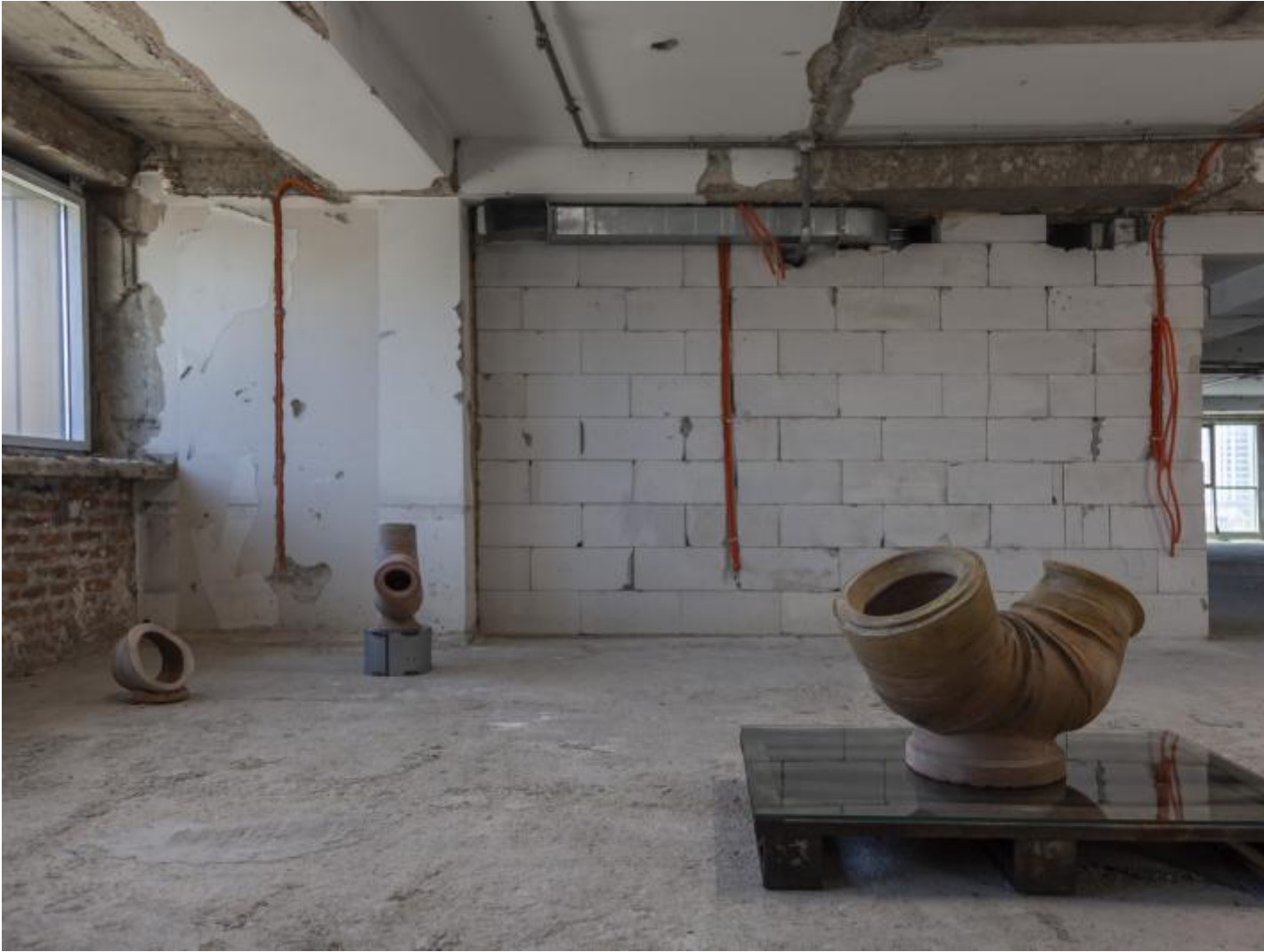
Thirty Plumbers in the Belly, 2021, © Jumana Manna.

infrastrutturato in modo che ci si possa anche sostare.