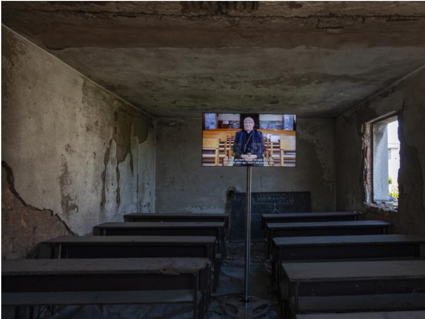
Hertica School House_School without School , 2022, © ETEA Photo © Manifesta 14 Prishtina, Majlinda Hoxha.

La crescente attenzione al tessuto territoriale da parte di Manifesta e il suo progressivo avvicinamento a questioni di urbanismo strategico fa della manifestazione un interessante spazio pubblico di discussione e di riflessione.