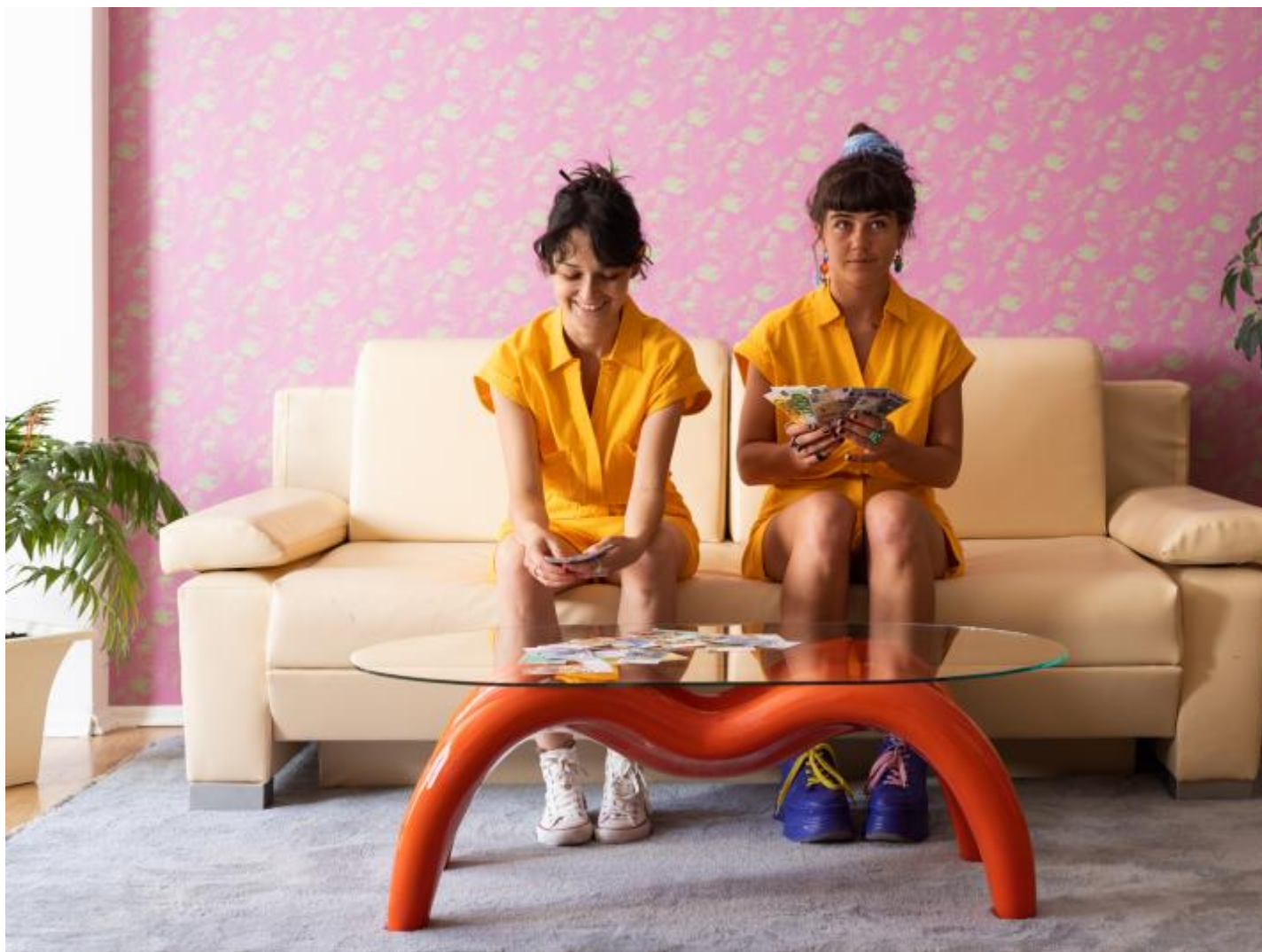
Sister Flats, 2022 © Alicja Rogalska.

A due passi dalla biblioteca, su un muro esterno dell'università, ma in posizione riservata, c'è il murales LOVE is LOVE is LOVE con due figure strette in un abbraccio, su un fondo arancione. Realizzato dalla ONG Sekhmet Institute con Emira Murati opera d'arte visibile alla storia di due persone di identità non binarie; scelta dirompente per un paese in cui gli individui LGBTQI sono ancora discriminati. Il giorno dell'inaugurazione di Manifesta il murales era già stato vandalizzato.