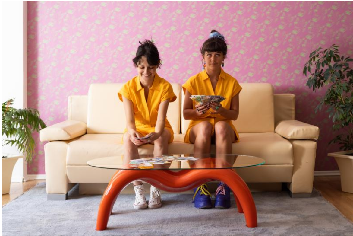
Sister Flats, 2022 © Alicja Rogalska.

Anche la questione femminile è ancora aperta nel paese. A questo fa riferimento Alicja Rogalska, che all'interno di un appartamento, crea una situazione domestica in cui tutto, dalle figure della tappezzeria alle tende realizzate con biancheria dismessa, parla di emancipazione come orizzonte a cui tendere, a partire da azioni di solidarietà fra donne. Di lunedì, quando è chiuso al pubblico, lo spazio diventa rifugio discreto per donne bisognose di consulenze legali su condizioni da sanare.