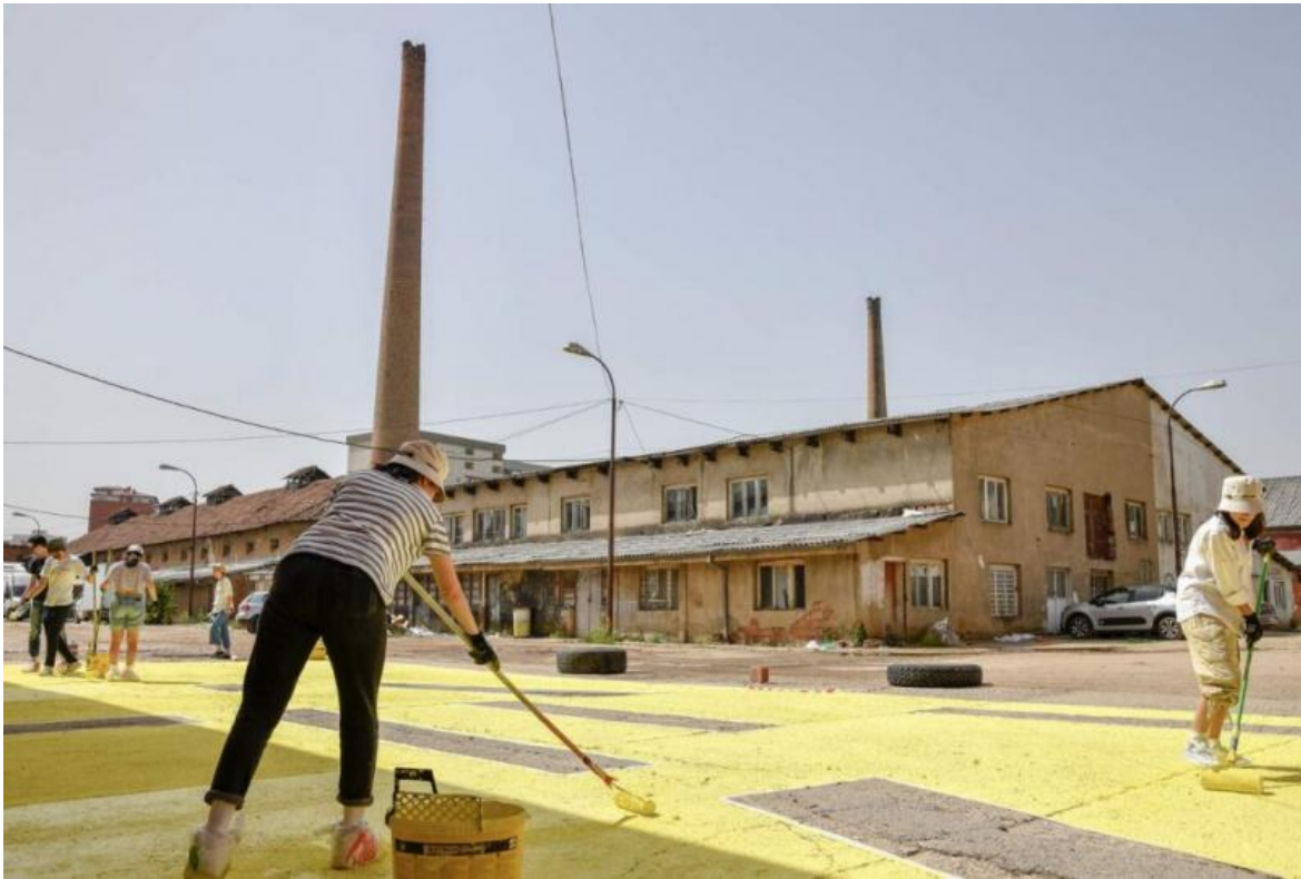
Urban intervention at Hivzi Sulejmani Library.

Il titolo dell'iniziativa, in traducibile, è It Matters What Worlds World Worlds: How to Tell Stories Otherwise . Le sedi sono venticinque, distribuite in tutta la città: per lo più luoghi pubblici e semi-pubblici, in alcuni casi storici. Reclamare spazi pubblici è il leitmotiv della manifestazione.