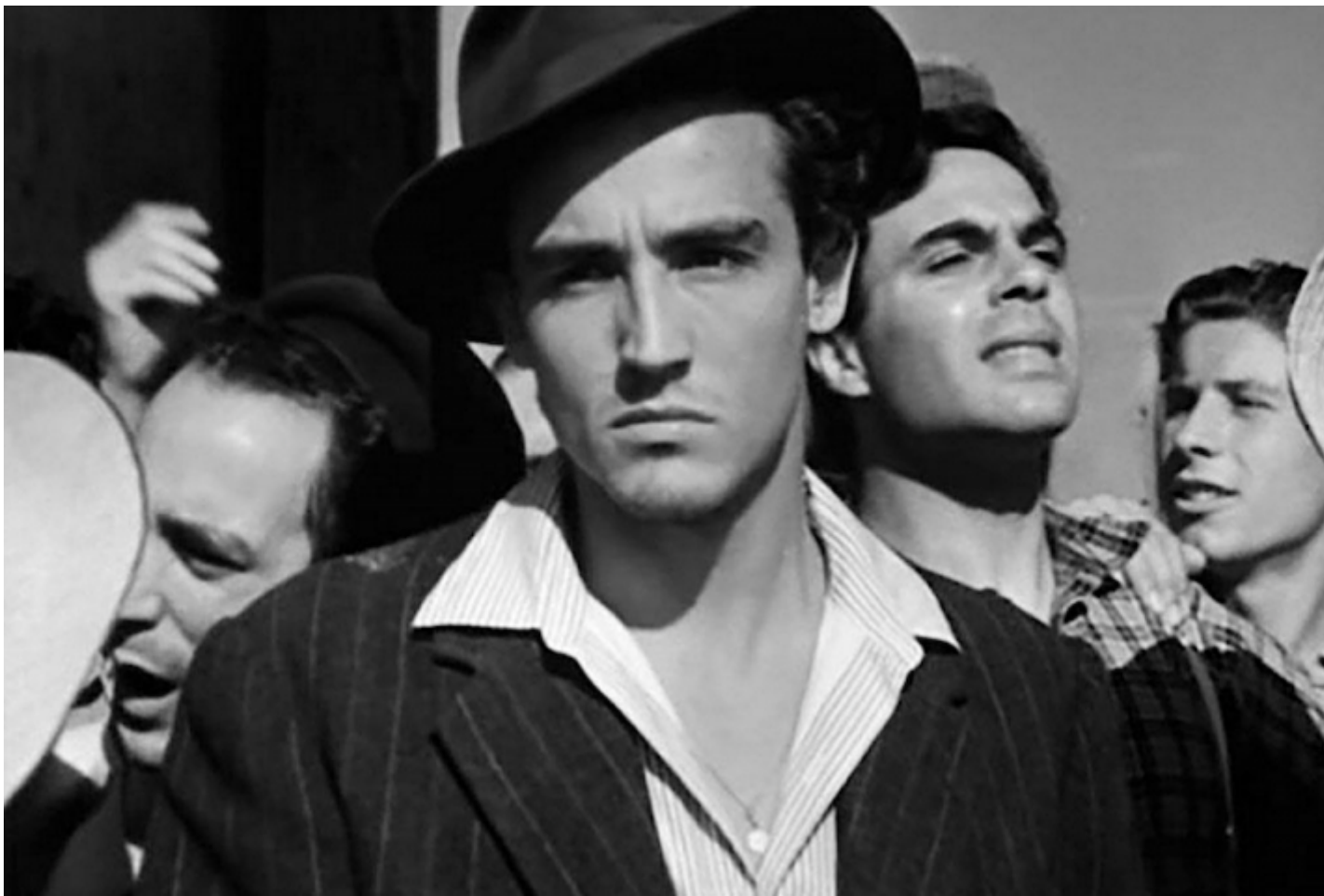
Gassman in “Riso amaro”, 1949.

Forse è per questo che, fra i tanti linguaggi che ha attraversato in una carriera lunga mezzo secolo, il medium che più gli ha permesso di inventarsi e di inventare è stata la televisione. O, più correttamente, quello strano ibrido di arcaismo e modernità che era la televisione italiana degli anni Cinquanta. A cominciare dal titolo divenuto proverbiale, Il Mattatore (1959) è stato al tempo stesso un unicum televisivo e un apripista, tanto che lo stesso Gassman ne riprodurrà la formula, su scala decisamente minore, in altre due importanti esperienze sul piccolo schermo: Il gioco degli eroi (1963) e Canzonissima 1972. Aldo Grasso ha definito Il Mattatore “l’invenzione del contenitore quando ancora non si sapeva cosa fosse il contenitore”. Una trasmissione-contenitore per un interprete-contenitore, che mescolava volentieri, con gusto eclettico e senza falsi pudori, Shakespeare e l'avanspettacolo, fiction e non-fiction , grande letteratura e rotocalco, slapstick e satira politica. E che si chiudeva nell'unico spazio realmente capace, forse, di contenere Gassman per intero: il tendone del circo.