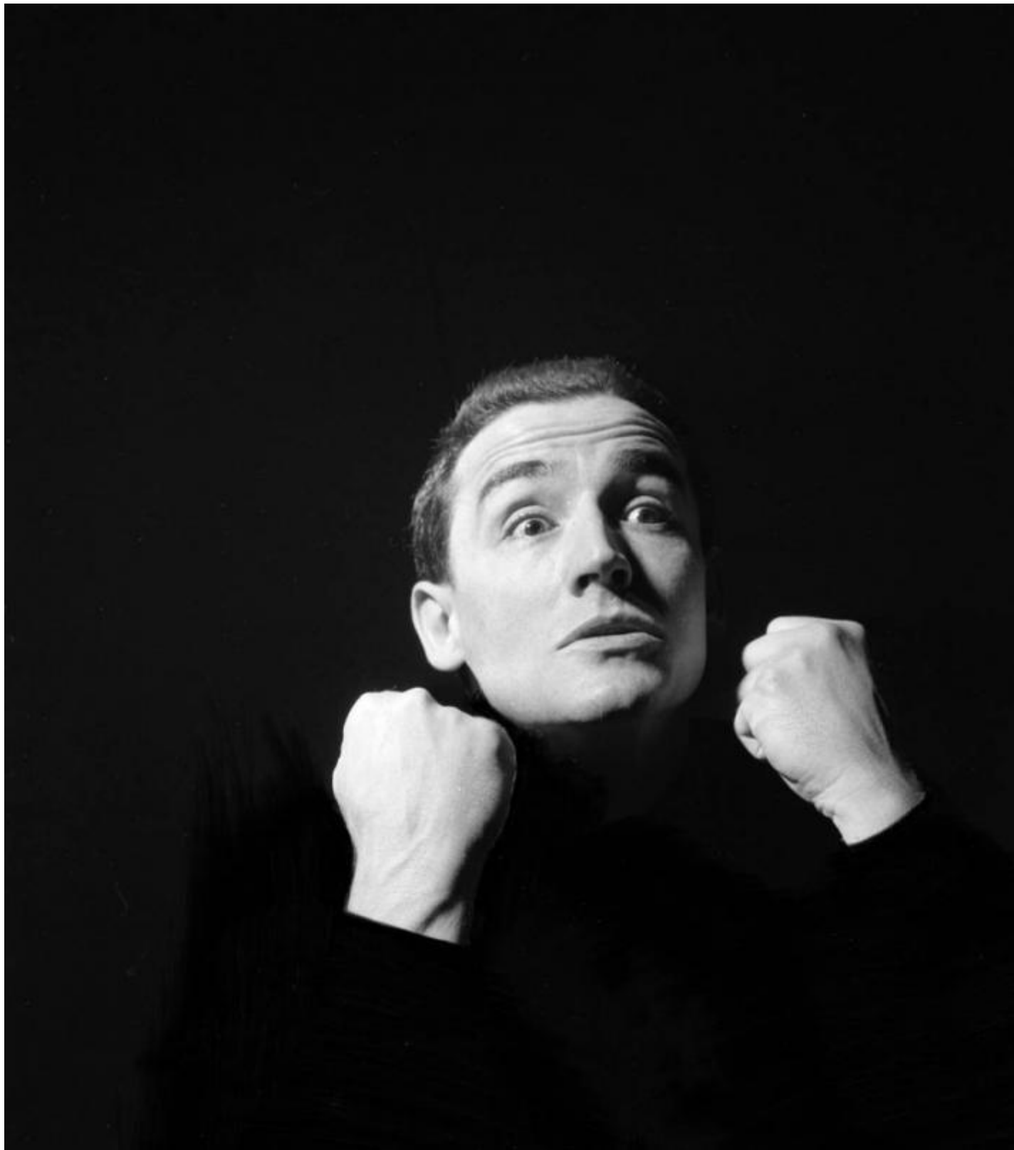
Gassman nei panni di Amleto, 1957.

A porre la questione nei suoi giusti termini 1 stato un critico non certo generoso con il Nostro, Tullio Kezich, che già nel 1962 scriveva: «Si può dire che Gassman stia con la testa nel nostro secolo e i piedi ben piantati in una remota tradizione mattatoriale». Volendo proseguire nella metafora zoologica da cui siamo partiti, lo si potrebbe definire una «forma transizionale», termine che nell'ambito della tassonomia evuzionistica indica appunto quelle specie animali che presentano caratteristiche tali da porsi a un livello intermedio nella linea evolutiva.