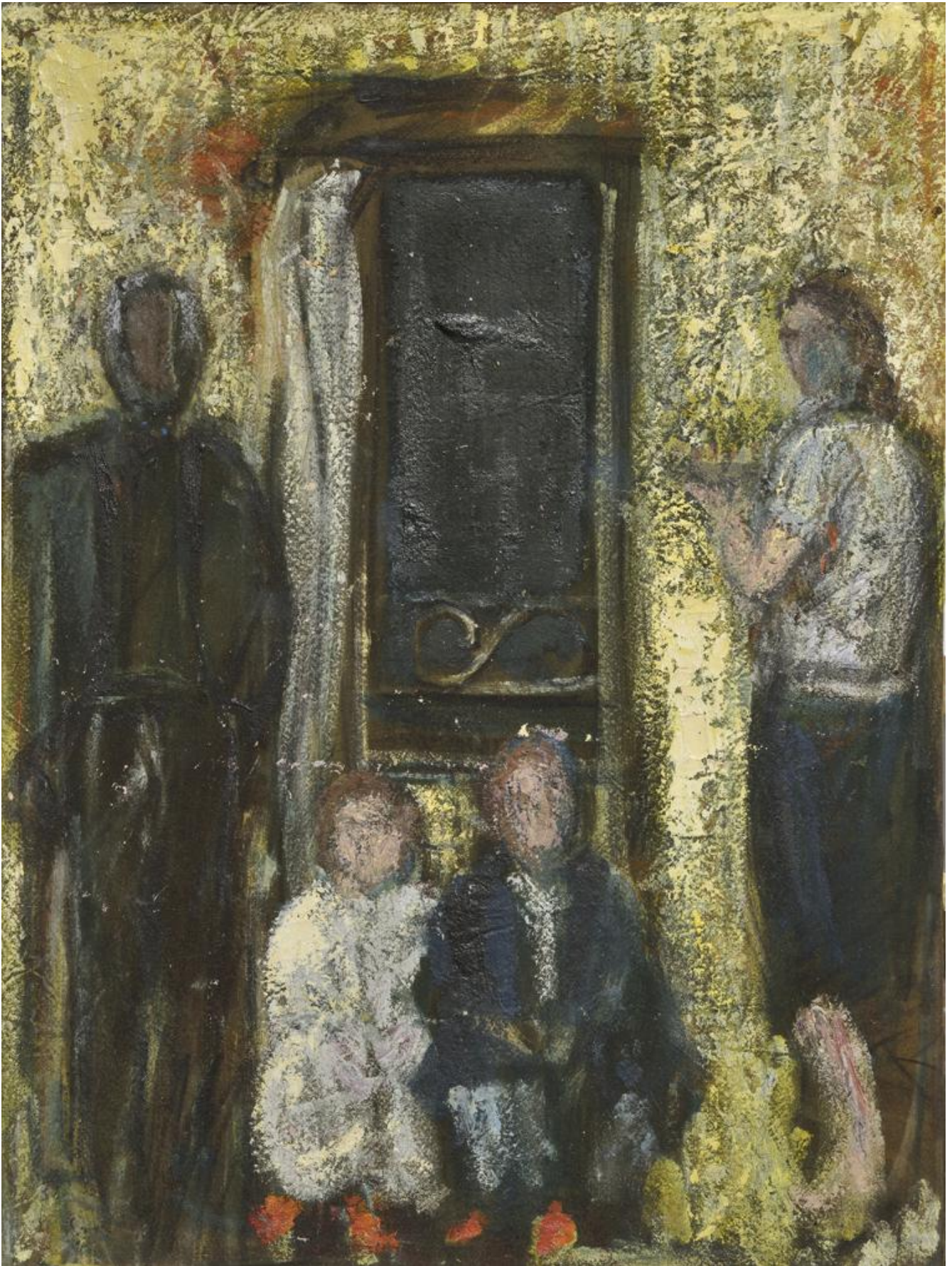
Clio Pizzigrilli - Evidentemente, l'ho detto all'inizio di questa conversazione.