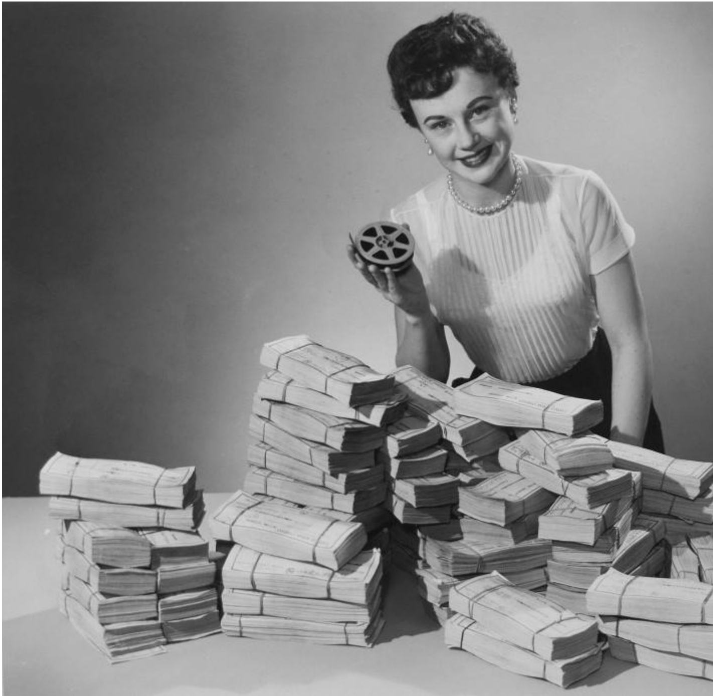
Fotografia sconosciuta, pubblicitaÌ? della Recordak con etichetta "Tutti

Tanto per dare unâ??idea, gli olandesi vantano una esportazione intra ed extra UE del 70%, con un giro di affari di piÃ¹ 7 miliardi di euro (contro i circa 630 milioni di euro dellâ??Italia che pure si classifica al secondo posto per quanto riguarda lâ??esportazione). La concorrenza oggi, a parte le nicchie basate sulla qualitÃ e lâ??originalitÃ dei prodotti, si gioca quindi sempre di piÃ¹ sulla ricerca, sulla capacitÃ di investire nelle tecnologie piÃ¹ avanzate.