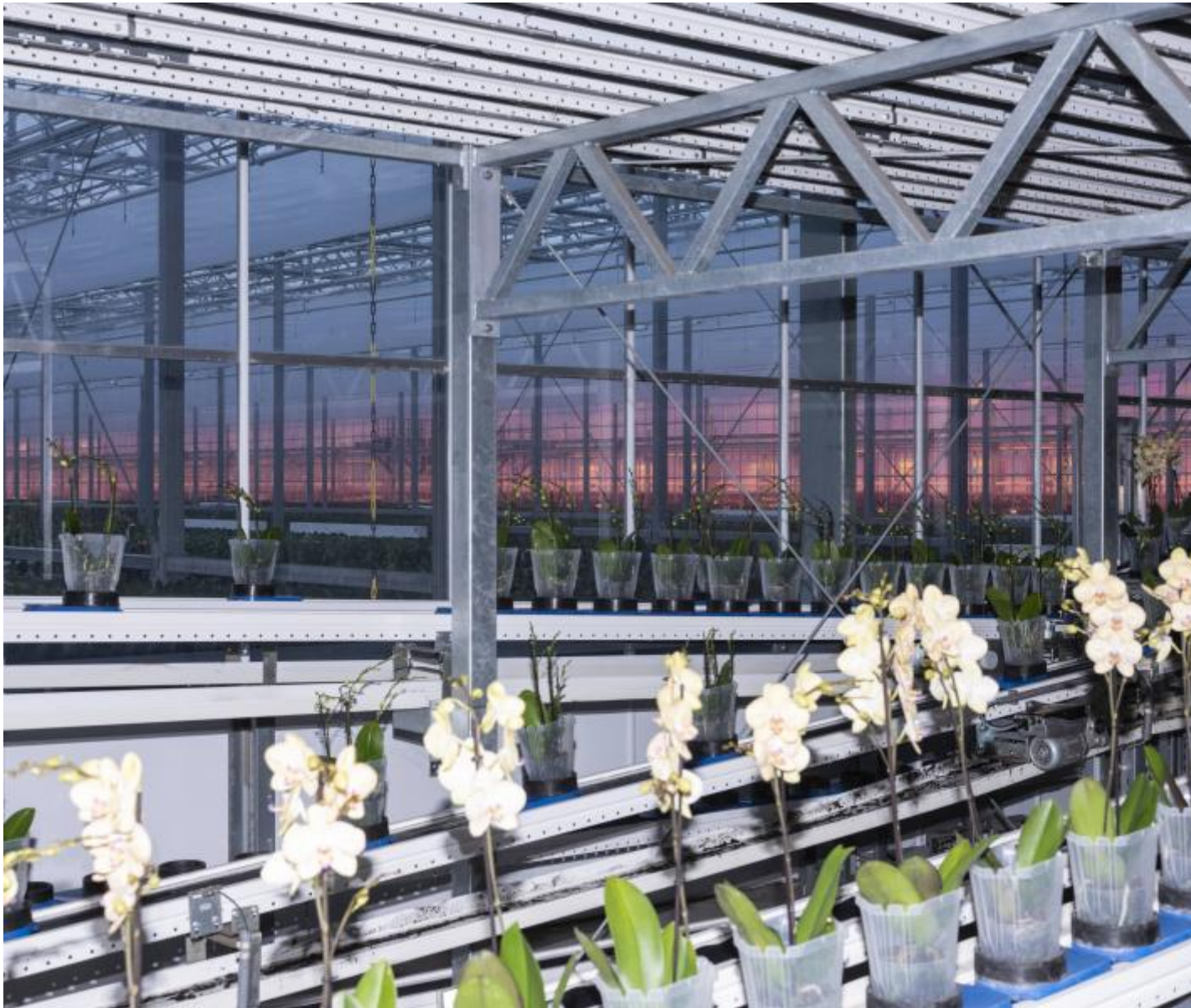
Armin Linke, Ter Laak Orchids, linea di produzione delle orchidee, Wateringen, Paesi Bassi, 2021.

Con la sezione Mining si entra nel mondo delle fotografie usate per controllare e migliorare la produzione e la distribuzione delle merci. Qui, grazie alle immagini di Armin Linke, ci si puÃ² fare un'idea precisa e non astratta di come venga usata la computer vision : ovvero masse di immagini indicizzate che consentono lo sviluppo di software per il riconoscimento e che operano come un â??occhio intelligenteâ?, capace non solo di vedere ma anche di capire e agire in modo â??autonomoâ?. Sempre piÃ¹ diffusa e utilizzata nei campi dell'ingegneria e dell'industria manifatturiera, la computer vision â?? come dimostrano una volta di piÃ¹ le fotografie e i video di questo autore â?? viene ampiamente usata anche nell'industria agraria.