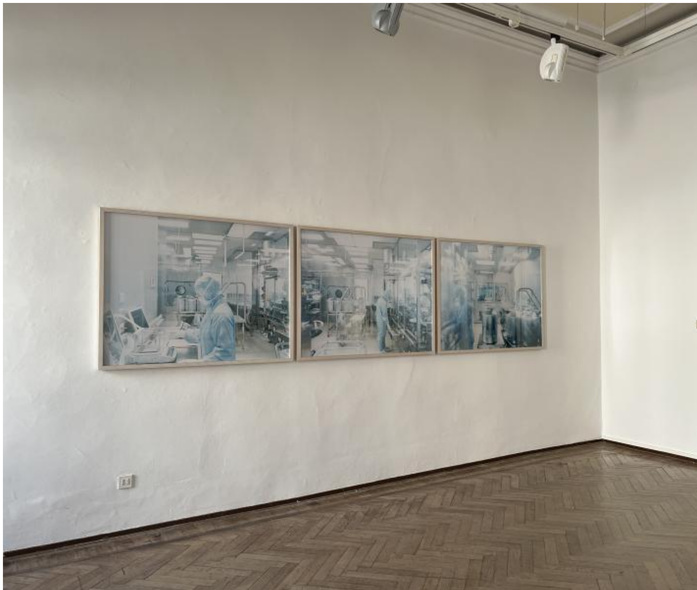
Walter Niedermayr, Raumfolgen 238 , 2007

SC: Walter, nel tuo percorso hai fotografato spazi naturali alterati dall'intervento umano e molti luoghi chiusi, laboratori, caveaux di banche, ospedali, prigioni. Marina, tu hai invece lavorato sulla città, sugli interni quotidiani e sulle relazioni interpersonali, sempre osservati con uno sguardo attento ai dettagli rimossi, non visti. Per entrambi è evidente una forte carica critica nei confronti delle istituzioni e dell'ordine apparente del mondo. In qualche modo l'orto del carcere a Venezia è un luogo emblematico per voi. Mi chiedo, nel suo insieme questo progetto contiene un intento politico, liberatorio, utopico, o piuttosto è concentrato sul tempo e lo spazio interiore, quello delle detenute e il vostro?