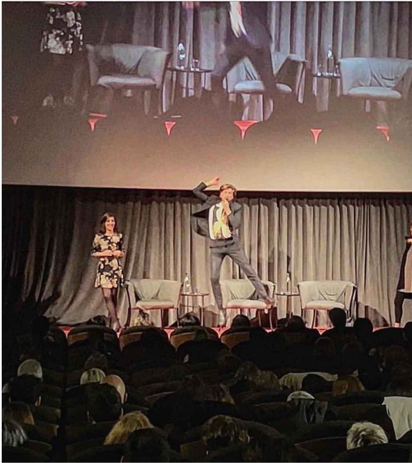
Ruben Östlund durante la presentazione di "Triangle of Sadness" a Milano. Cinema Anteo, 22 ottobre 2022

Andrebbero forse analizzati qui, al livello della loro forma carnevalesca e non per il loro contenuto apparentemente di critica sociale, alcuni film degli ultimi tempi che hanno goduto di un enorme credito nel dibattito culturale di sinistra anche per il loro spirito anticapitalista. Il primo, Parasite , il cui successo non ha precedenti nel mercato cinematografico americano (è il primo film a non essere distribuito negli Stati Uniti in lingua inglese a vincere l'Oscar come miglior film) racconta la storia di una famiglia lumpen che va a vivere nello scantinato di una famiglia alto-borghese di Seoul e che mostra in modo anche "geografico" il