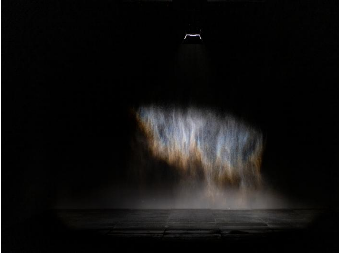
Beauty , 1993

Motivi che l' esposizione indaga a ritroso con lavori celebri; la forza irradiante della luce calda e dorata di Solar compression (2016) e Room for one colour (1997), a cui il pubblico deve abituarsi, giocoforza, ricalibrando i propri punti di riferimento percettivi; l' atmosfera di straniante di Red window semicircle (2008), versione rimpicciolita del famoso sole di The weather project , realizzato quasi vent'anni fa alla Tate di Londra e caso esemplare di contemplazione partecipata. Quanto a Beauty (1993), la meno recente tra le opere esposte, si pu' dire che racchiuda il senso della mostra.