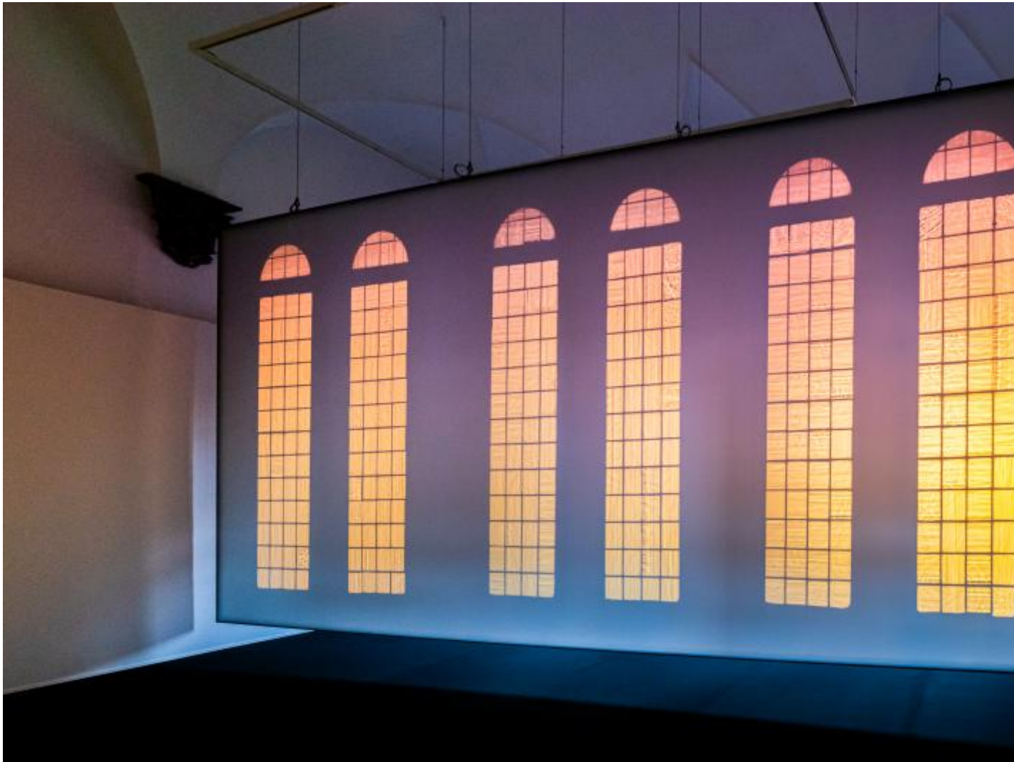
Tomorrow , 2022

Ciò che accomuna i tre lavori è la loro capacità di mostrarci dettagli delle vetrate quali polvere, rotture e sporcizia con un grado di nitidezza e materialità altrimenti irraggiungibile, di concretezza quasi tangibile anche nel momento in cui la nostra ombra di spettatori vi si avvicina. Sono opere che, a mio parere, non si esauriscono in una pur evidente rielaborazione visiva e concettuale di un complesso architettonico e operazione consueta di Eliasson, ne è esempio recente l'intervento alla Fondazione Beyeler del 2021 ma che uniscono al valore della messa in scena e della suggestione estetica una riflessione di respiro più ampio. Si tratta, per l'artista, di stimolare nello spettatore una presa di coscienza su un aspetto fondamentale: quello di essere sempre situato o, in altre parole, necessariamente calato in un contesto di relazioni interdipendenti e aperte, dalla cui accettazione dipendono la qualità, la ricchezza e la completezza percettiva e cognitiva del rapporto con le cose che ci circondano.