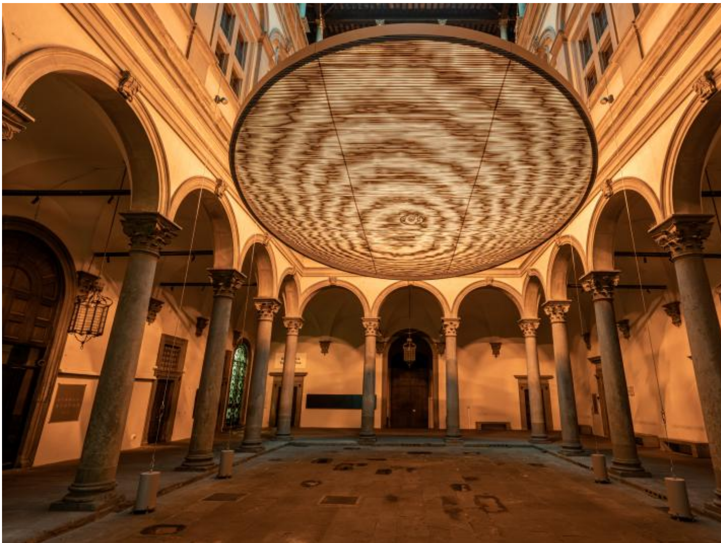
Under the weather , 2022

Non poteva che essere questo il fulcro di Nel tuo tempo , l'imponente personale in corso fino al 22 gennaio a Firenze nella cornice di Palazzo Strozzi. Più che mai opportuno parlare di cornice: tra le diverse mostre curate negli anni da Arturo Galansino nella sede fiorentina, quest'ultima riesce davvero a farsi carico del portato storico e visivo dell'edificio cinquecentesco, apice di un triangolo ideale dato dall'interazione di opera, spazio e spettatore.