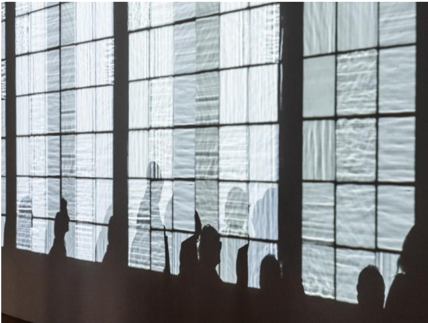
Triple seeing survey , 2022

Il termine "immersivit" che spesso sembra portare con s una connotata vaghezza - ormai parte imprescindibile del vocabolario della cultura visuale e dell'arte contemporanea. Affermare che la ricerca di Eliasson rientri a pieno titolo nella categoria, dai confini assai nebulosi, di arte immersiva - di per s una sorta di tautologia e lo stesso vale per l'esposizione fiorentina. Pi, piuttosto, importante soffermarsi sulla variet di soluzioni con cui l'artista articola a pi livelli il coinvolgimento dello spettatore.