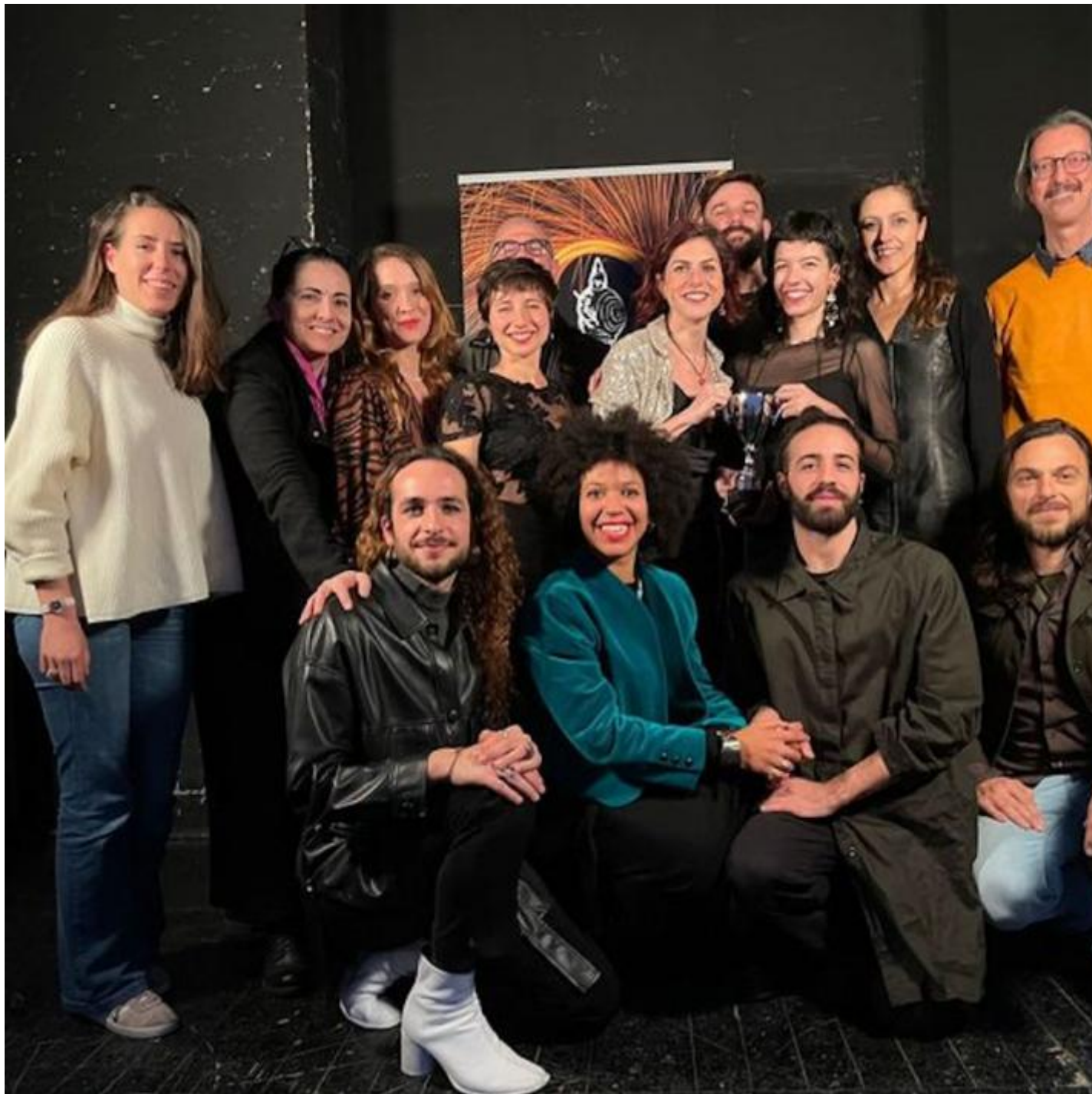
La compagnia di Inferno, di Roberto Castello - Aldes, miglior spettacolo di danza.