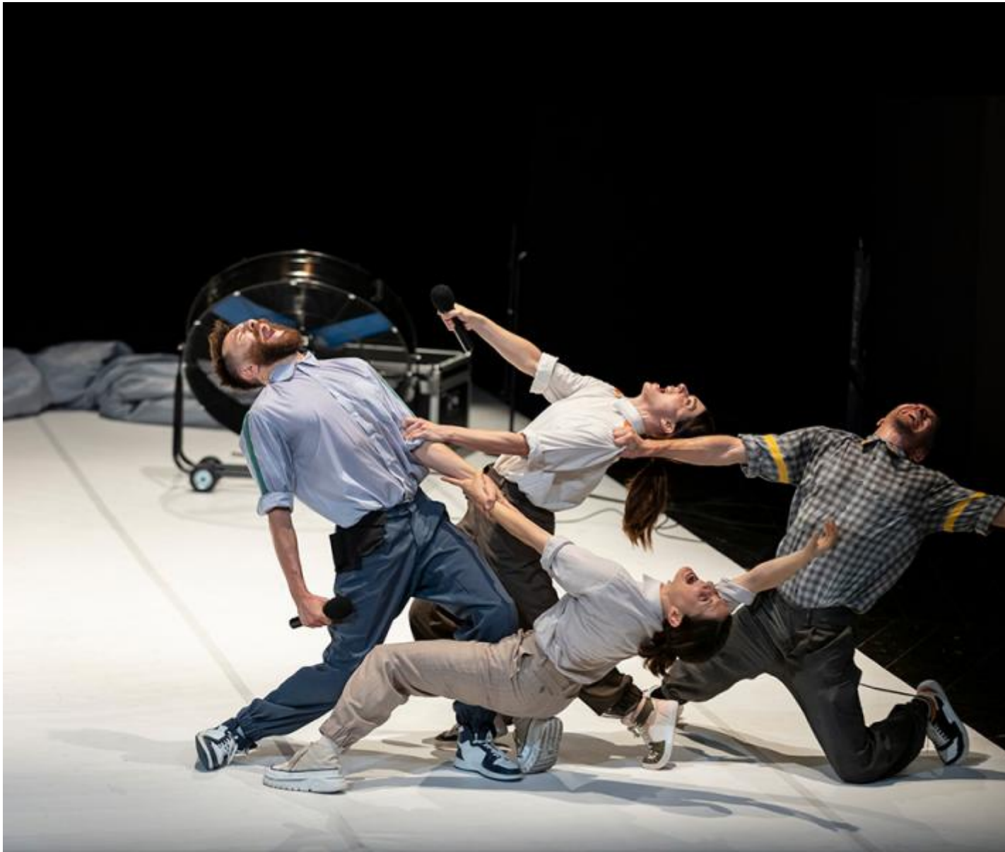
Il miglior spettacolo: L'angelo della storia, di Sotterraneo.

Per non serve scomodare la filosofia francese del secondo Novecento per ragionare su quanto una rappresentazione di qualcosa, per quanto possa aderire all'oggetto di partenza, non sarà mai una copia fedele della realtà ritratta. Perché parla non soltanto del mondo che prova a restituire in questo caso, un ambiente teatrale quanto mai sfaccettato e molteplice, ma anche, per forza di cose, di chi ha costruito quell'immagine: dei fotografi, il cui incrocio di prospettive dà vita ogni anno ai Premi Ubu. La selezione di vincitori e finalisti, insomma, dà conto inoltre dello stato dell'arte nel campo della critica: degli interessi di ciascuno, dei giudizi, delle preferenze che si fanno collettive, certo; ma inoltre, più sottilmente, dell'idea di cultura, arte, teatro diffusa, appunto dell'immagine della scena su cui si basano i votanti; forse anche dell'indirizzo che con le loro azioni dentro e fuori Ubu desidererebbero imprimere al nostro teatro.