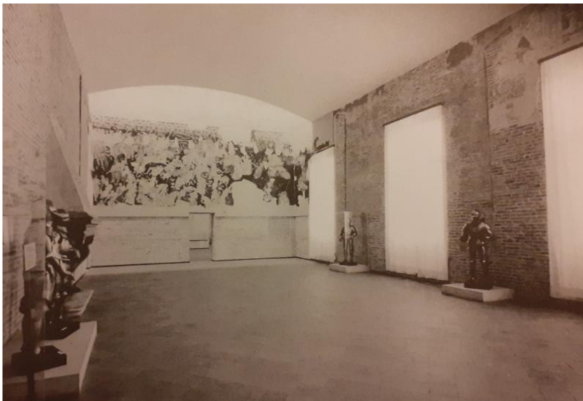
La sala di Pisanello nella mostra del 1972.

Dietro alla clamorosa scoperta resa pubblica nel 1969 c'erano le ricerche condotte per anni da una grande figura di soprintendente, Giovanni Paccagnini (1910-1977). Sono gli anni successivi alla mostra mantovana su Andrea Mantegna (1961), esposizione di grande valore scientifico, come di notevole successo di pubblico. Anche la scoperta del ciclo di Pisanello divenne visibile a tutti nella mostra di tre anni dopo, nel 1972.