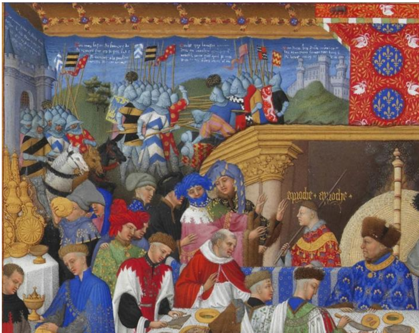
Tr s riches heures.