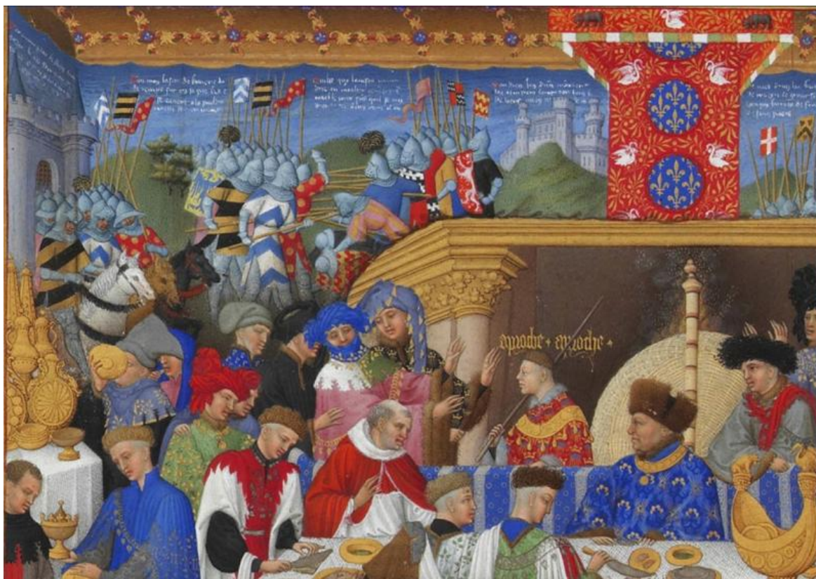
Très riches heures.