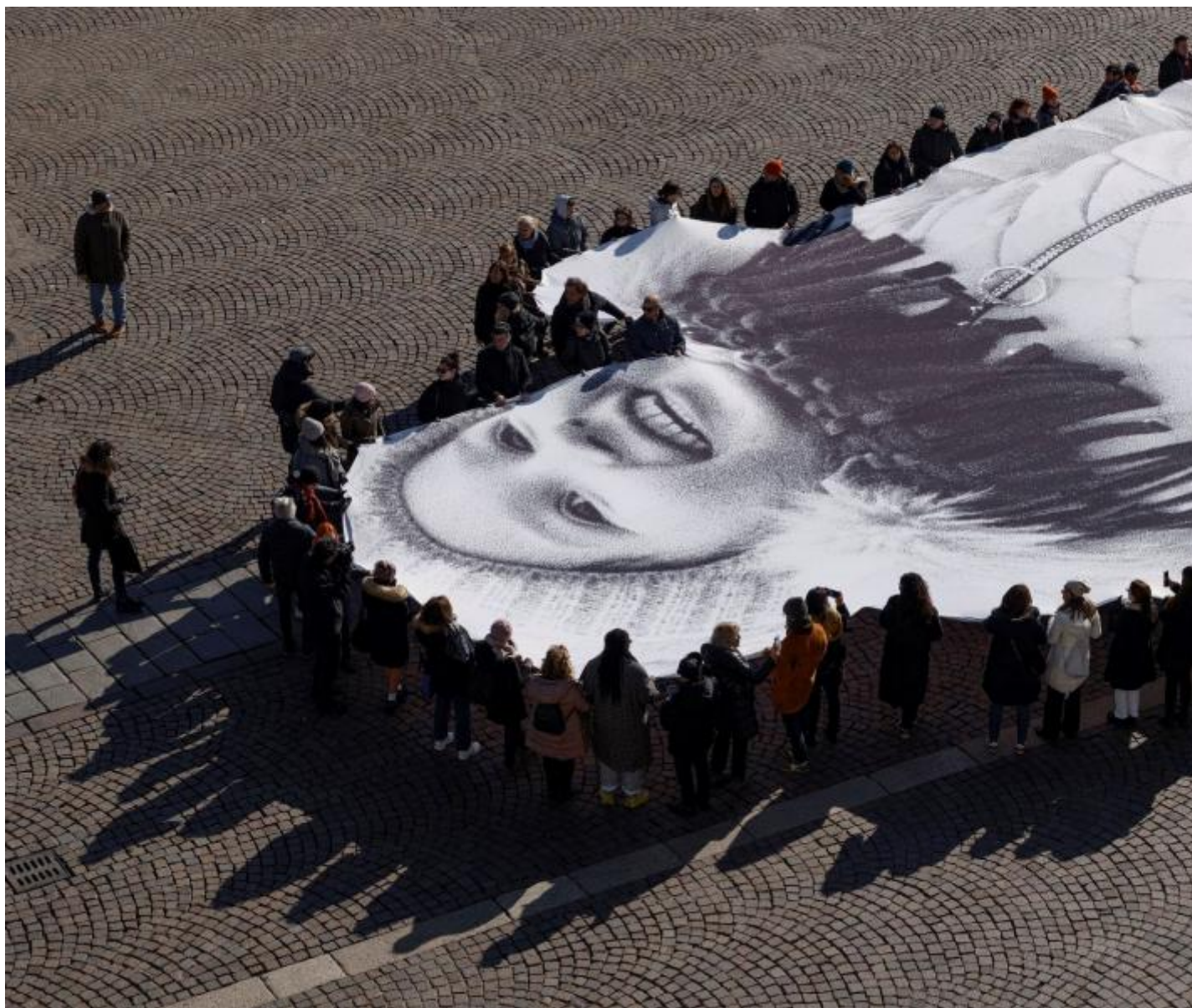
JR press - performance.

Un ultimo tributo ai bambini è sottolineato nell'ultima stanza della mostra, in cui altre sagome, questa volta cartonate e rette da un supporto in legno che le rende simili a marionette cinesi, delineano i contorni di altri bambini del campo del Ruanda che corrono sovraesposti in mezzo a sabbia nera: alcune luci muovendosi proiettano teatralmente le loro ombre sulle pareti che li circondano, creando ancora una volta un effetto di sproporzione delle misure e di spiazzamento prospettico. La mostra è allestita secondo una struttura molto semplice, in appena tre stanze, con ampio spazio lasciato alla documentazione videografica.