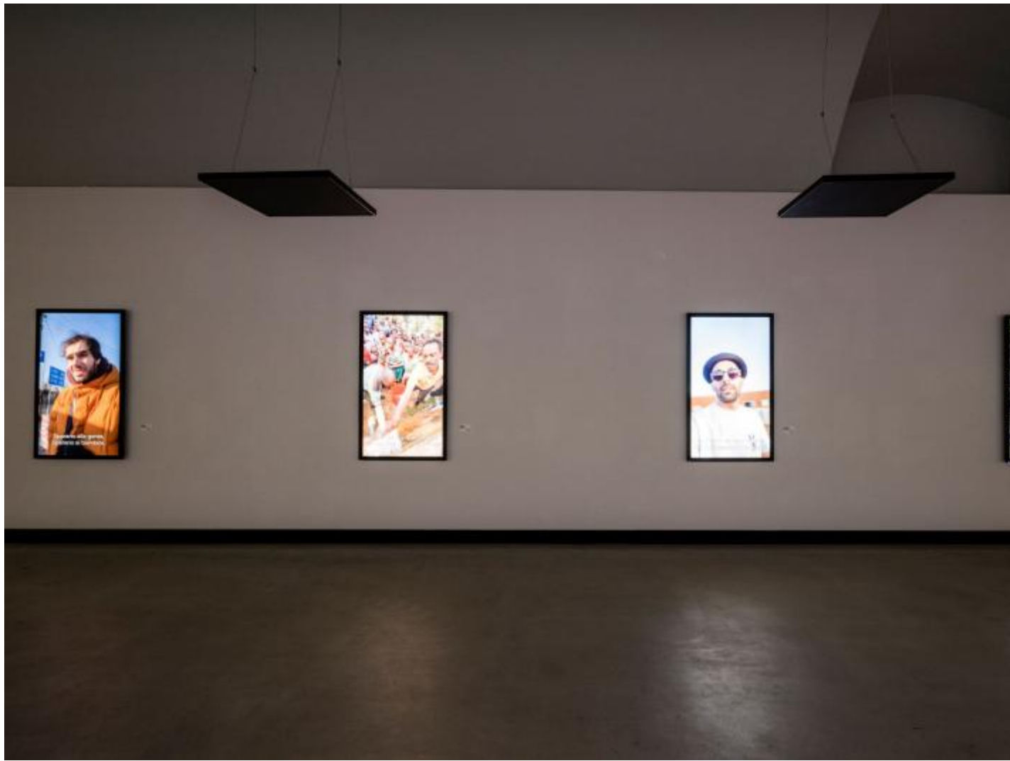
JR press - allestimento.

L'immagine viene quindi trasportata anch'essa in una dimensione totalmente distante dai correnti metodi di fruizione, dando alla prospettiva aerea l'onnipotenza per poter essere accolta e compresa. Ciò che in altre performance è accaduto, infatti, è che le persone, quando le gigantografie venivano per esempio incollate per terra nelle piazze, non si accorgessero di star calpestando un'immagine: si trovavano a camminare su un dettaglio talmente infinitesimo – un dettaglio di un dettaglio – da non poter concepire l'insieme a cui questo conduceva, come avviene in Conan Doyle fino a che l'enigma non viene risolto.