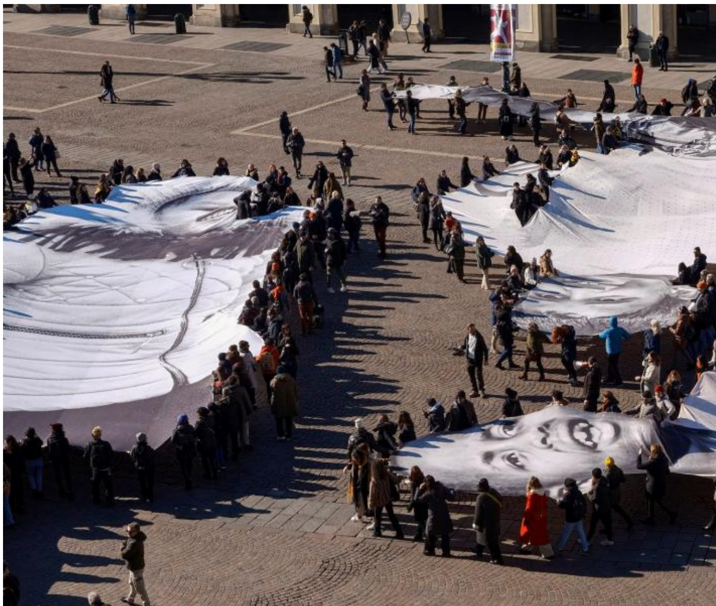
JR press - performance.

Ecco allora che in qualche modo si torna alla radice dell'atto fotografico, al guardare per creare un contatto, per familiarizzare, per interfacciarsi su una realtà che non ci è apparentemente propria; a ribadire quel senso di straniamento cui si trova sempre l'uomo di fronte a ciò che non conosce, nell'assenza di un confine sicuro a cui affidare il proprio stare al mondo. Viene ribadito, infine, il fatto che ogni destinazione ambisca a un margine, un limite oltre al quale poter andare e in cui poter tornare.