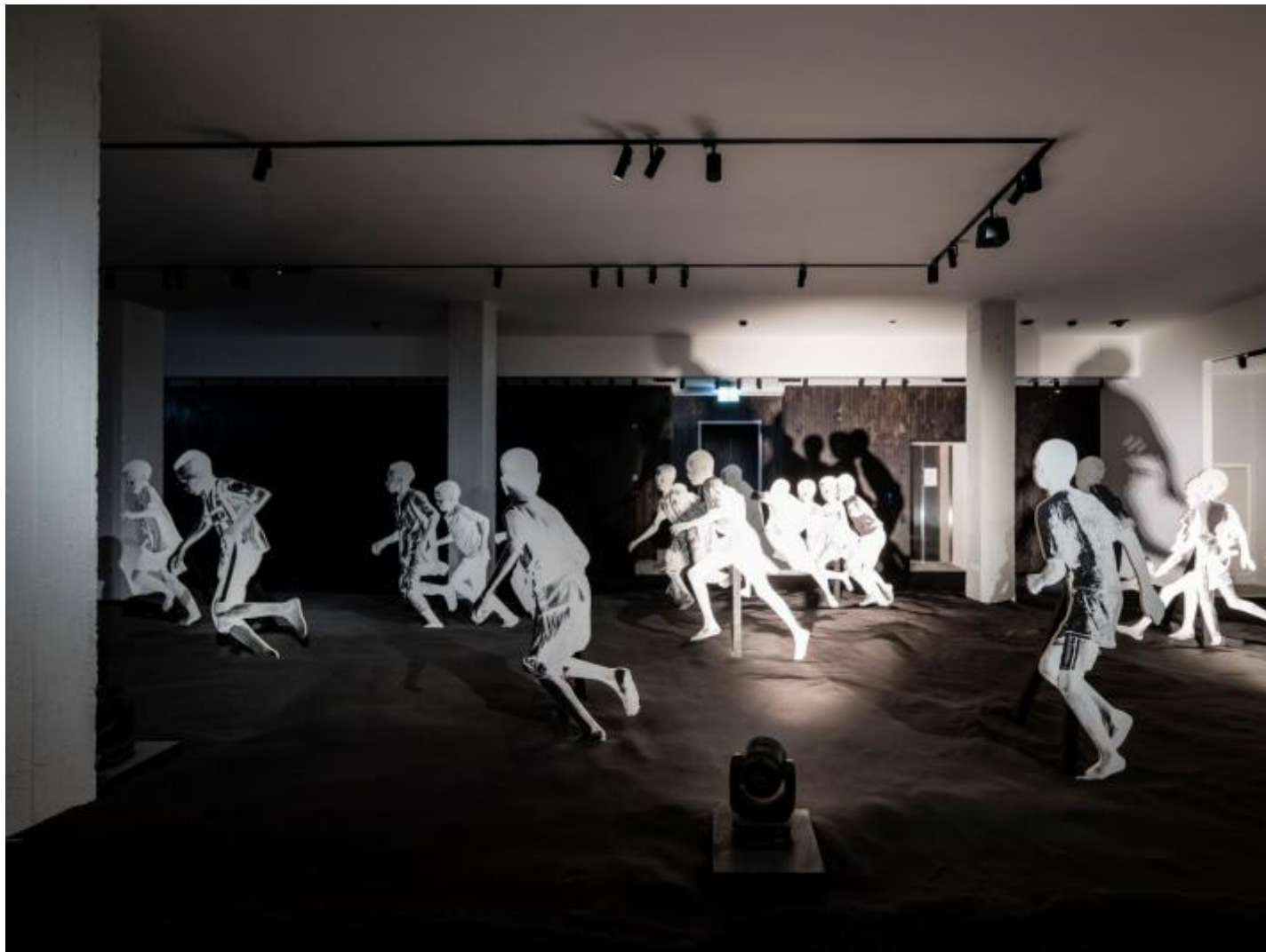
JR press - allestimento

Questi cinque bambini, trasportati, fatti incontrare per la prima volta in un ideale girotondo e impossibile incontro, data la distanza geografica in cui attualmente vivono, diventano l'ideale simbolo del fenomeno delle migrazioni forzate, e aprono la strada per considerazioni di carattere più strettamente fotografico. Essi vengono proiettati in una dimensione di "accoglienza collettiva" – in netto contrasto con l'"espulsione collettiva" di cui sono vittime – attraverso la loro rappresentazione iconografica, presa direttamente nel luogo del loro temporaneo rifugio che però, nell'immagine finale e usata per la grande performance, non si vede.