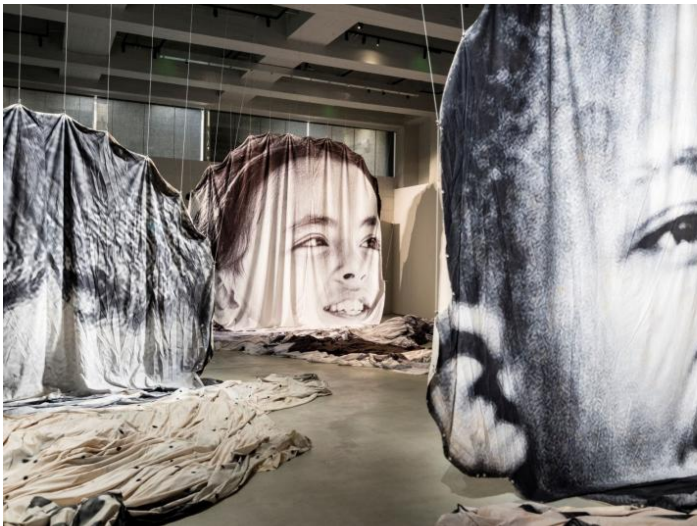
JR press - allestimento.

Stampando su teli di enormi dimensioni, fino ai 50 metri, e chiedendo di volta in volta a centinaia di volontari di aprirli in favore di un drone che li filma dall'alto, si vedono le gigantesche sagome di uomini, donne e bambini dominare uno spazio immenso, quello che spetterebbe, metaforicamente, nelle coscienze di chi invece le ignora.