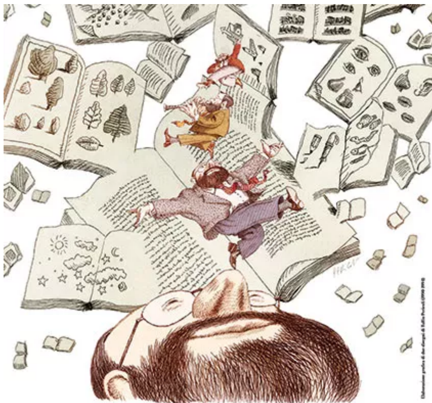
Illustrazione grafica di Gianfranco B. Sella. Progetto grafico 1998/1999

Se continuiamo a tenere vivo questo spazio Ã grazie a te. Anche un solo euro per noi significa molto. Torna presto a leggerci e SOSTIENI DOPPIOZERO