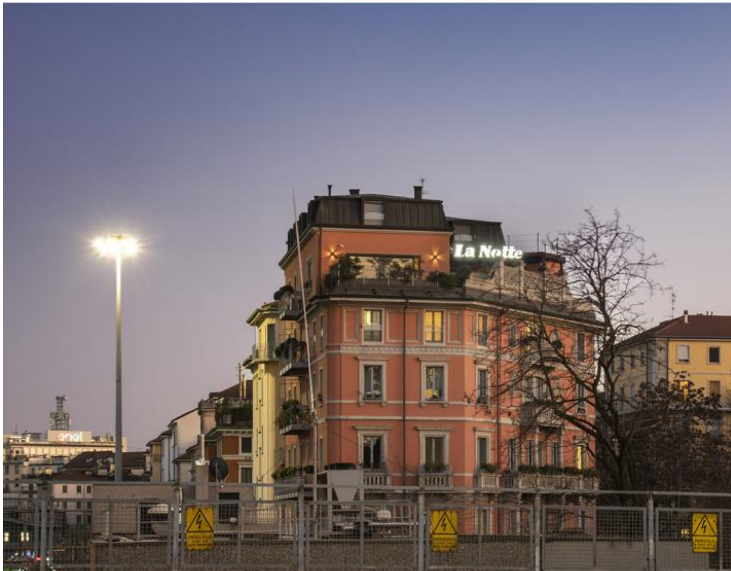
Luca Massaro, La Notte , 2022, lightbox.

L'opera site specific La Notte , composta da un lightbox collocato sul tetto dell'edificio che ospita la galleria, ripropone il contesto urbano nel quale Massaro incontra le scritte che poi fotografa. La Notte era un quotidiano milanese di cronaca pubblicato dal 1952 al 1995, ma è anche quella che rende leggibile a distanza il lightbox evocando un paesaggio urbano ora scomparso. Il testo entra così in un sistema di lettura e interpretazione dominato dall'ambiguità. L'artista sfrutta questa elasticità del testo per rendere instabile il linguaggio pubblicitario, in un certo senso per minare la sua credibilità attraverso una deriva poetica del senso.