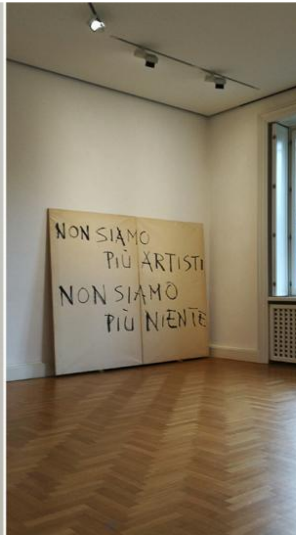
Giuseppe Chiari, Diritto di visione , 1999, pennarello su carta / Giuseppe Chiari, Non siamo piú artisti non siamo piú niente , 1973, tecnica mista.

A questo riguardo può essere utile ricordare Adieu au langage (2014) di Jean-Luc Godard, un film enigmistico dove troviamo immagini indipendenti, solitarie e mute come il cane, uno dei tre protagonisti, ma anche immagini che giocano con le parole e parole che giocano con se stesse: "Ah Dieux", "Oh langage", "pouce - Poucette - pousser", "À vite, et vite, les souvenirs brisés". In questo modo l'immagine cinematografica entra in una relazione enigmatica con la parola e, se vogliamo seguire il suggerimento psicanalitico, anche con l'inconscio (a questo riguardo vale la pena di notare che Massaro lavora sul valore culturale e sociopolitico delle immagini e dei testi che, come egli stesso dichiara, "infestano la nostra psiche").