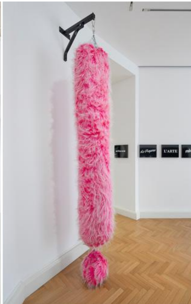
Luca Massaro, ? (L.A.), 2022, tessuto in pelliccia sintetica cucita a mano e poliuretano riciclato. Courtesy Viasaterna. Foto: Carola Merello / Luca Massaro, !, 2022, tessuto in pelliccia sintetica cucita a mano e poliuretano riciclato. Courtesy Viasaterna. Foto: Carola Merello.