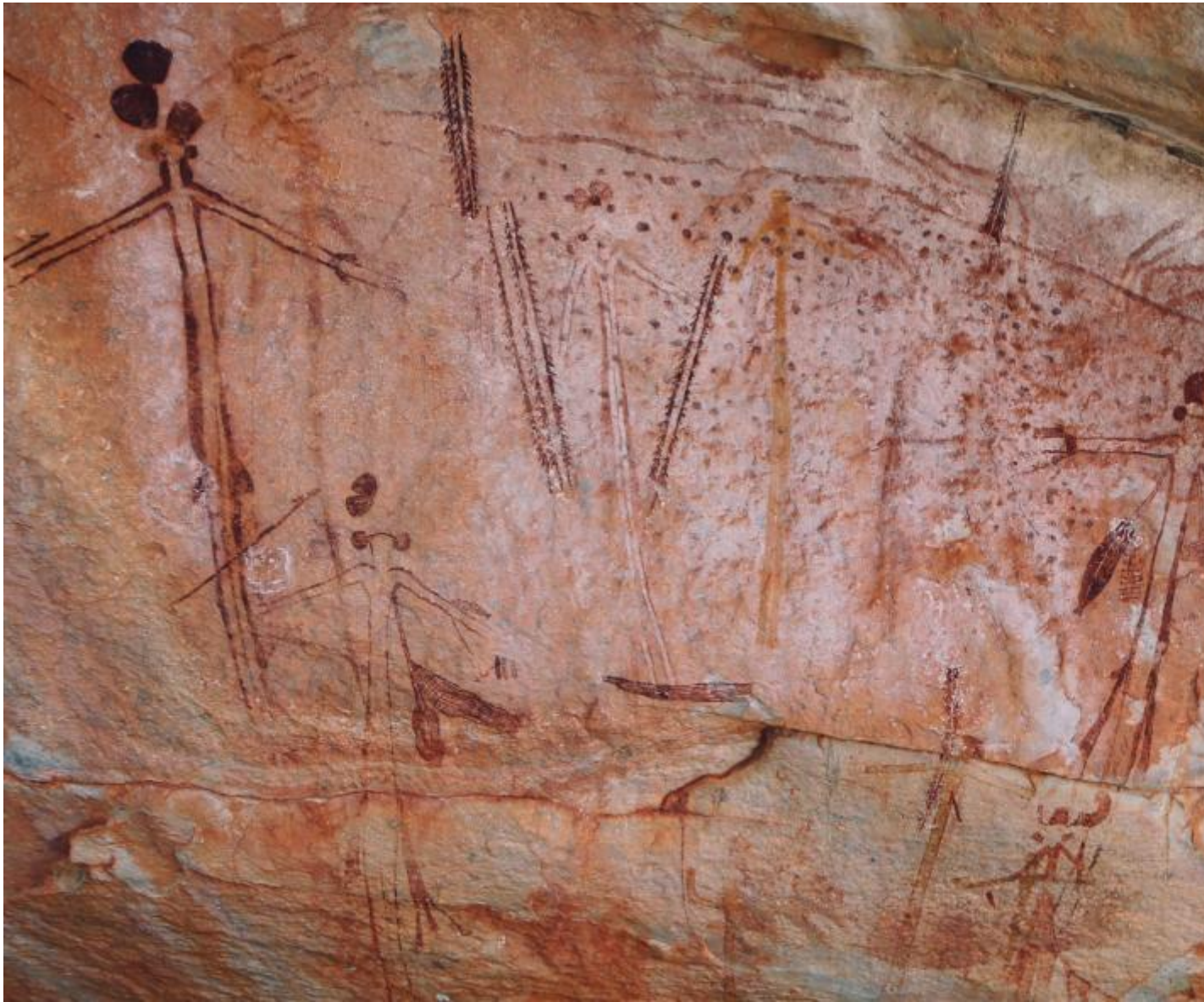
Dipinti Wanjina che raffigurano gli antenati spirituali e la loro rappresentazione in forma antropomorfa.

canone della mimesis che i pittori paleolitici avrebbero dovuto perseguire attraverso una successione di fasi o stili, ritenuto valido in tutte le epoche, teorizzato prima dall'abate Henri Breuil e poi perfezionato da Andr  Leroy-Gourhan, non ha alcun fondamento storico. La tappa che ha fatto crollare questo paradigma   stata indubbiamente la scoperta, nel dicembre 1994, della grotta di Chauvet-Pont d'Arc, sulle cui pareti sono conservate le sorprendenti raffigurazioni di cavalli, leoni, bisonti, orsi e rinoceronti dipinte con straordinaria precisione nelle proporzioni e con sofisticato ed efficacissimo naturalismo nei movimenti, la cui datazione al radiocarbonio-14 le colloca tra il 36/37.000 anni fa, attestandole come i dipinti figurativi pi  antichi dell'umanit  .