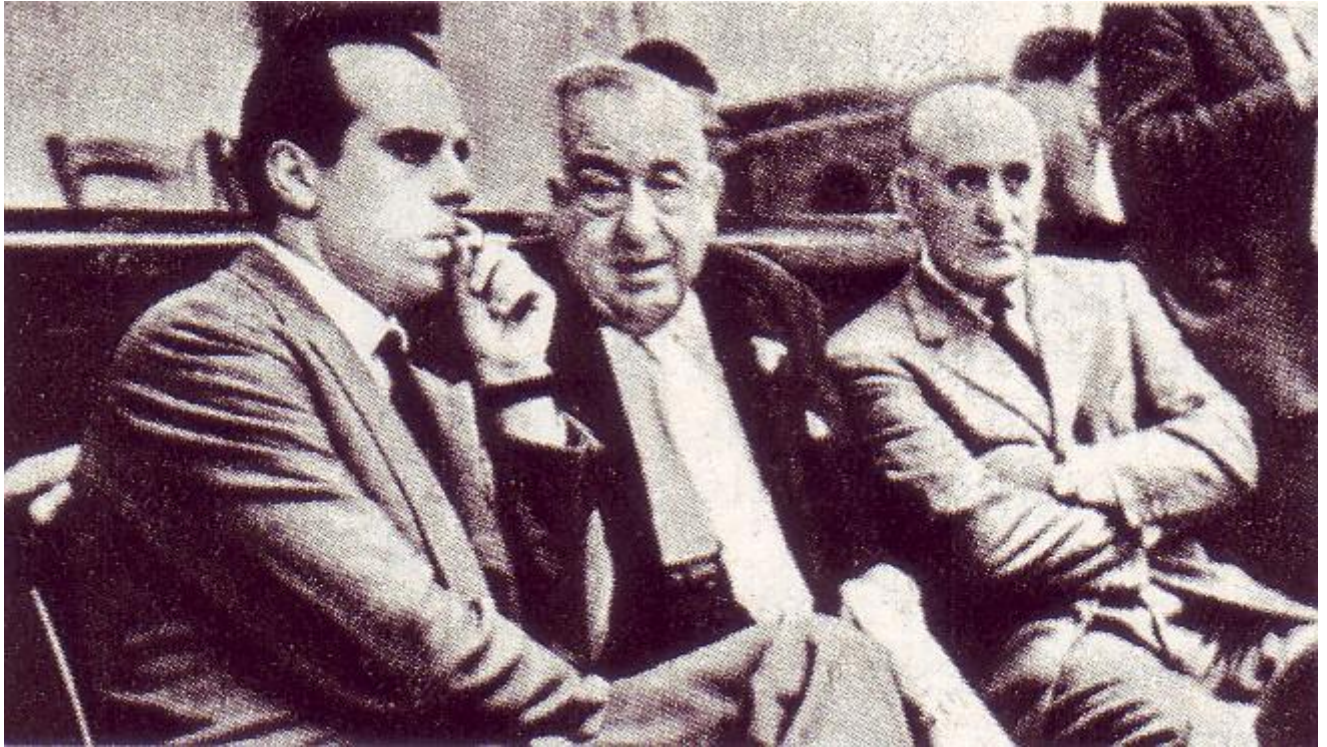
Piero Piccioni, Saverio Polito e Ugo Montagna durante il processo di Venezia.

sessuali, nÃ© di trasferirsi a Potenza. Come molte ragazze dell'epoca, desiderava una maggiore indipendenza ma aveva pochi mezzi per ottenerla. Era cosciente dei pericoli â?? era stata seguita da un veicolo mentre camminava lungo via Tagliamento â?? ma questi non erano sufficienti a scoraggiarla. L'ingenua Wilma era stata convinta da persone a lei note o da sconosciuti a prendere parte in qualche attivitÃ illecita o aveva semplicemente incontrato un uomo che le piaceva piÃ¹ del suo banale fidanzato?