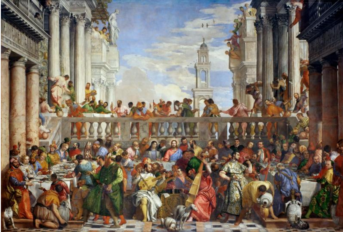
Nozze di Cana (1563) di Paolo Veronese.

dobbiamo tornare attraverso i cani. Per capire infatti quanto ci si sia allontanati da una rotta di navigazione equilibrata non possiamo procedere da soli. Facciamo fatica a comprenderci attraverso il nostro corpo. Abbiamo bisogno di una mediazione, che ci può essere fornita dall'immagine di un altro corpo. La pittura europea ha spesso scelto il cane per fornirci una traccia. Ed è quella che segue Tagliapietra.