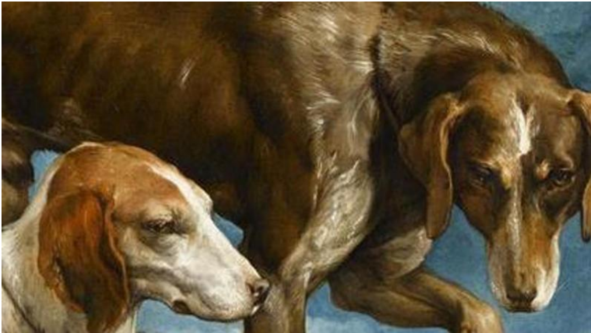
Due cani da caccia legati a un ceppo di Jacopo Bassano.

Secondo Tagliapietra, il cane dà corpo alla dimensione del tempo. Ma non si tratta del tempo cosmico della fisica, né di quello ontologico della filosofia. Il suo è il tempo “che non passa”, ovvero il tempo della vita, quello, “a termine, vissuto da ciascuno”, e che ciascuno percepisce attraverso “l’esperienza dell’anima”. È un tempo differente da quello del mondo – il tempo della natura e della storia che ci scorre attorno. È il “tempo sentito”, quello di cui siamo composti, quello che, come scrive Agostino nelle Confessioni , è impossibile definire perché coincide con il tempo del corpo vivente, che dobbiamo cercare “nella nostra esperienza, nell’emozione del tempo che siamo e che ci apparenta con tutto ciò che vive”. Ritrovare questo tempo significa riannodare i fili del nostro destino individuale a quello collettivo. Ma dove sta “il tempo che non passa”?