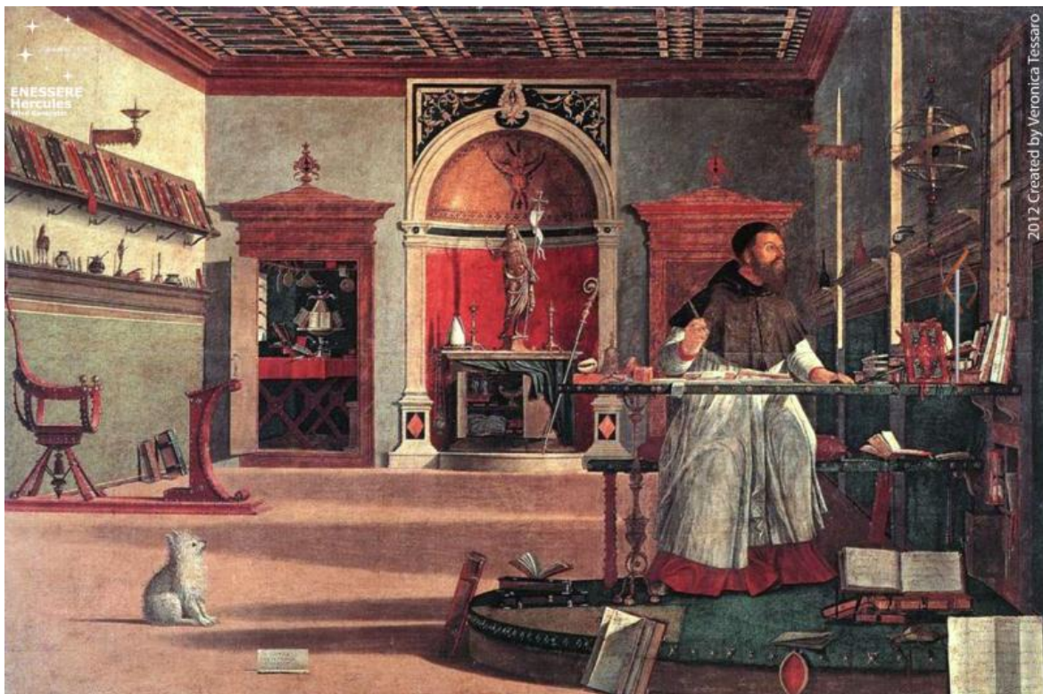
Visione di sant'Agostino di Vittore Carpaccio.

Il levriero e il terrier presenti nelle due incisioni (tra loro strettamente legate) che Albrecht Dürer realizza nel 1514, Melencolia I e San Girolamo nello studio , rappresentano i corni del problema: il quieto sonno del terrier esprime la pazienza misurata del santo che illuminato di luce divina traduce la Vulgata e si oppone alla stanchezza esausta del levriero su cui grava l'accidia del malinconico. Il messaggio è chiaro. L'accidia - in termini moderni la noia - può essere sconfitta solo dalla pazienza. Grazie ad essa capiamo che "non vi è un traguardo da raggiungere, ma solo un percorso da seguire". La pazienza ristabilisce l'equilibrio tra il tempo interiore e quello di fuori, la cui distonia è all'origine dell'inazione sofferente del saturnino. Ma la strada maestra per rientrare nel tempo della vita, nel "tempo a termine del vivente, quello che si dimentica sullo sfondo dell'esistenza" è l'esperienza del dolore.