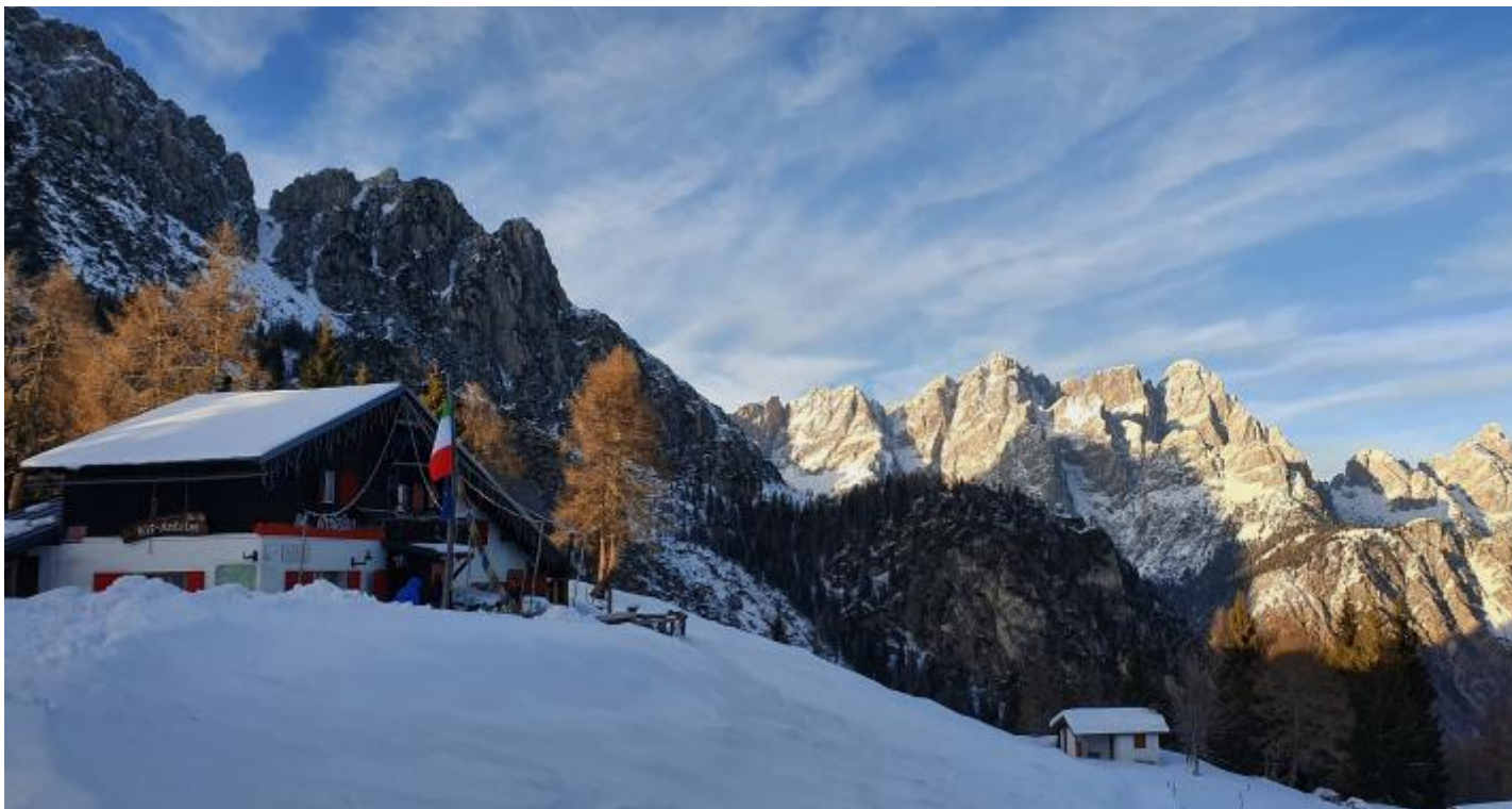
Una recente immagine del Rifugio Antelao, sullo sfondo le Marmarole.