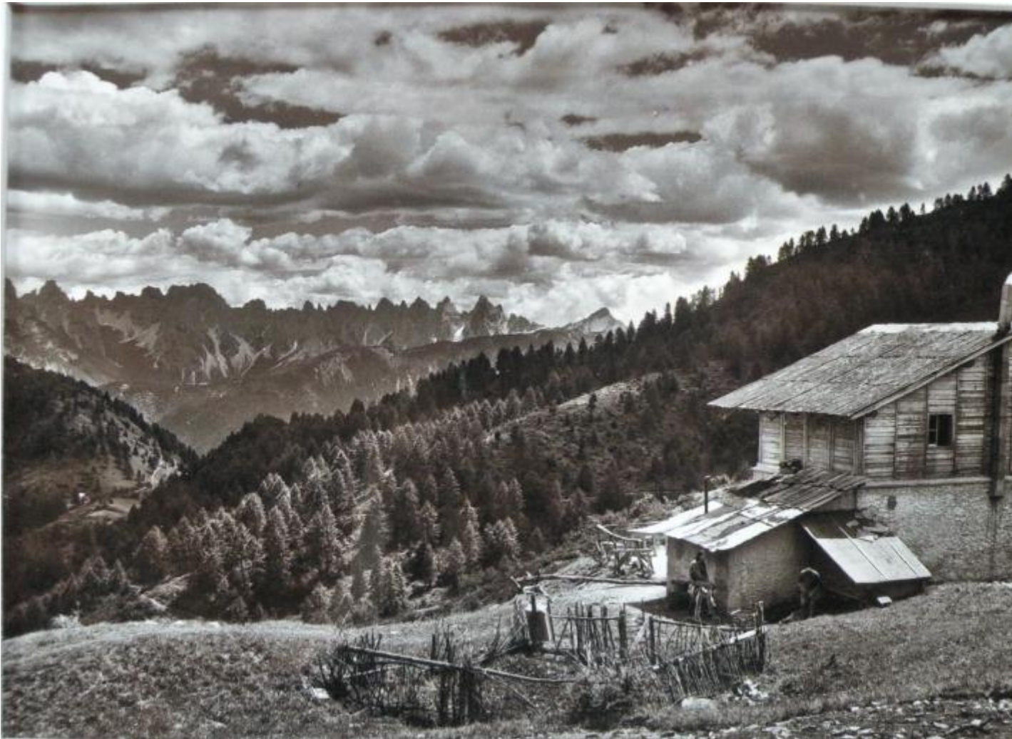
Una delle prime immagini del Rifugio Antelao.