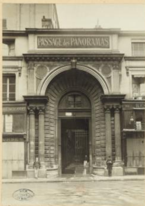
Passage des Panoramas H.24772