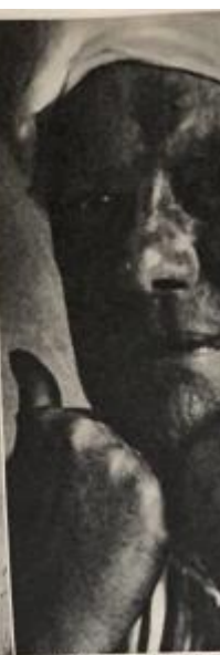
THE BEAST, whose number was 666, was Crowley's favourite 'magical' name. The police ordered the Abbey's destruction.