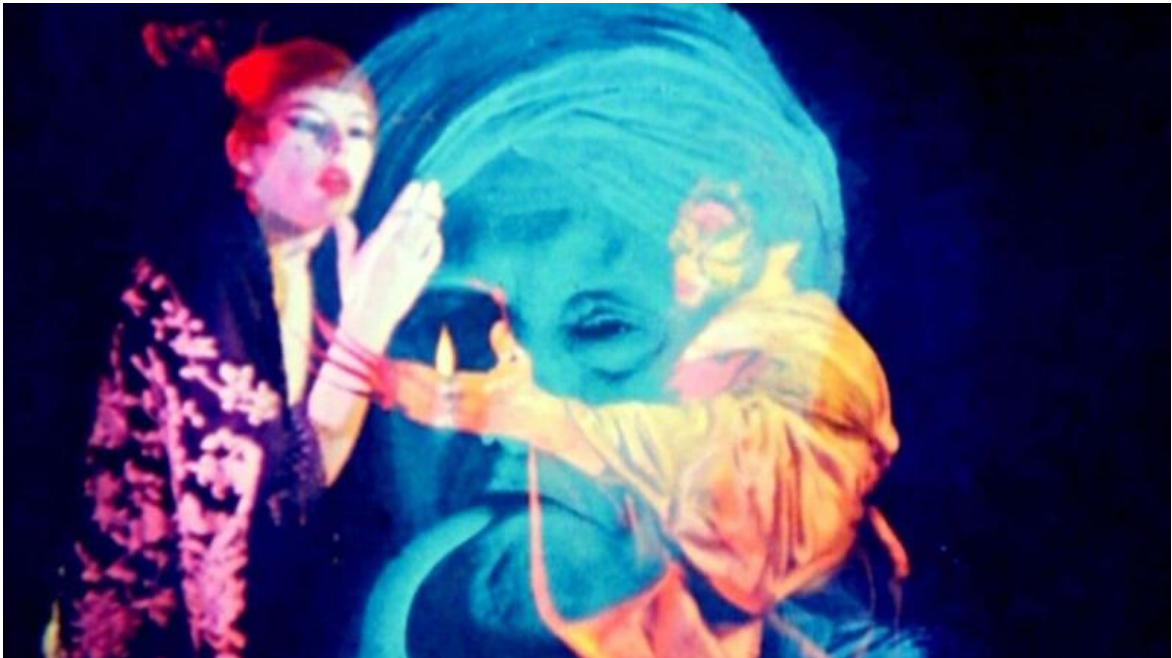
Inauguration of the Pleasure Dome