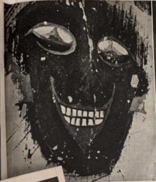
WOMAN? This painting, believed to be a portrait of . . . was Alexander Crowley's favourite 'magical' . . . in the bedroom of the Abbey of Cefalù.