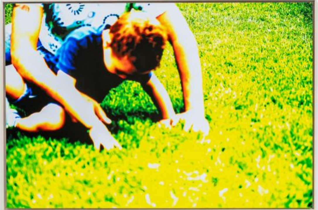
Marina Ballo Charmet Tatay #11, 2022-23, ink jet print su Dibond.

porta dentro il loro scambio amniotico, nel movimento sincrono, fluido, sospeso dei corpi. Il prato: il punto vista Ã" rasoterra, adulto e bambino giocano sull'herba; siamo anche noi dentro le braccia del padre, tese a formare una capanna sopra il figlio. Ã" questo sguardo, che struttura il visibile in funzione della relazione che scopre al suo interno, a conferire alle immagini la loro forza di sorpresa.