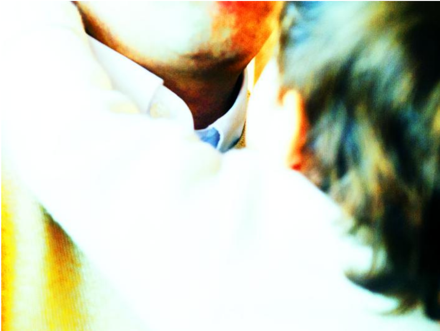
Marina Ballo Charmet Tatay #02, 2022-23, ink jet print su Dibond.

Luce e oggetto-luogo percettivo dunque, elementi fondamentali della poetica dell'artista. Obiettivo: rendere presente ciò che c'è, proprio così com'è. E in Tatay la tangenza è punto di singolarità necessaria al legame, perché determina il canale di ogni possibile scambio tra il padre e il figlio (la zona fenogliana tra i due nervi che abbiamo dietro il collo). Al contempo, il contatto-confine è espressione della funzione paterna di rivelare al figlio l'esperienza dell'impossibile, cioè l'idea del limite. La ritroviamo per esempio nelle braccia adulte che contengono o nel corpo adulto che delimita un orizzonte.