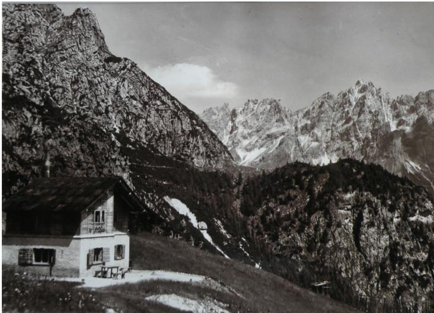
Una delle prime foto del Rifugio Antelao. Sullo sfondo le Marmarole.