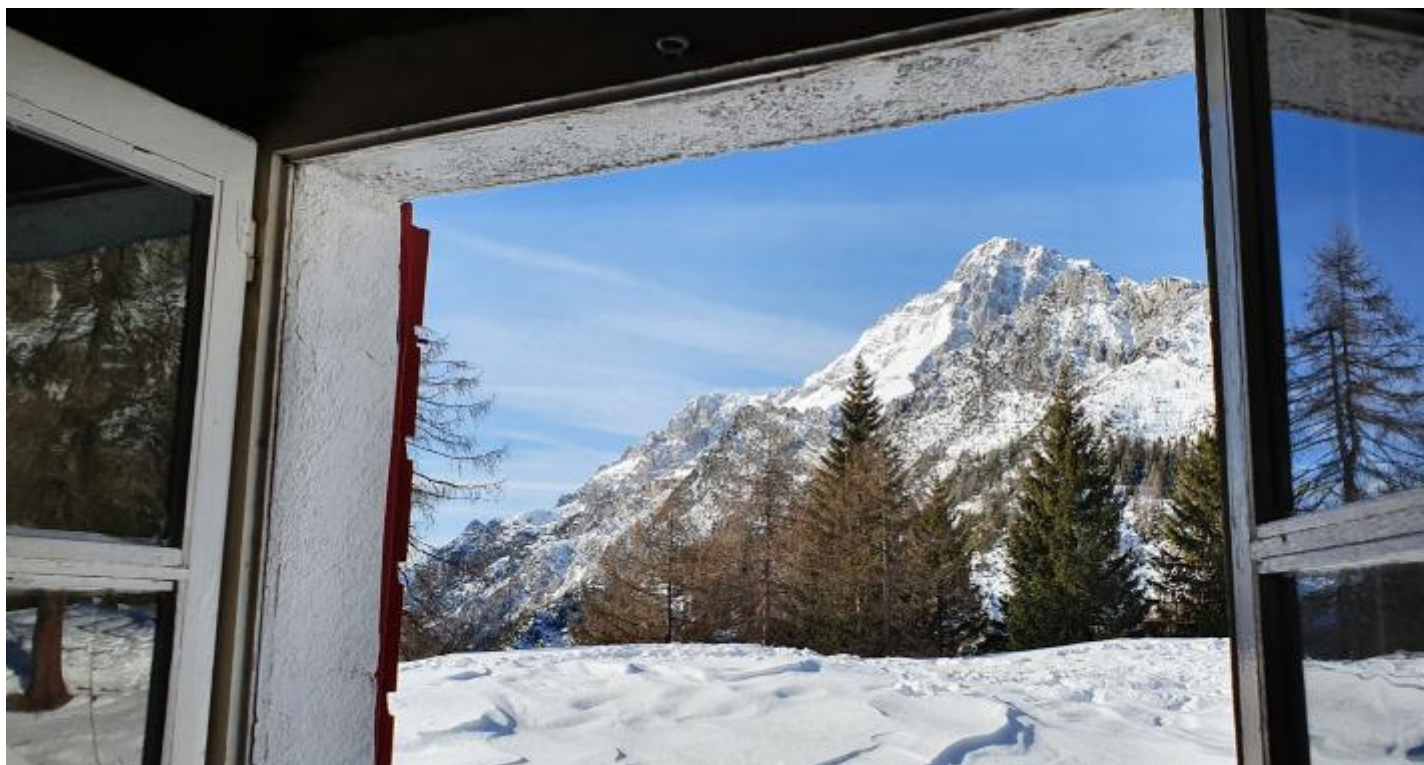
L'Antelao visto da una finestra del rifugio omonimo.