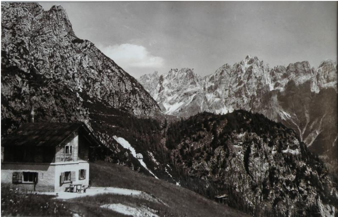
Una delle prime foto del Rifugio Antelao. Sullo sfondo le Marmarole.