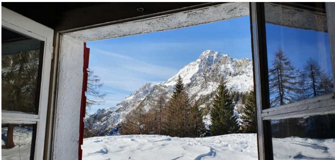
L'Antelao visto da una finestra del rifugio omonimo.

Proprio negli anni in cui si consolida il suo mestiere di scrittrice, viene colpita dai primi sintomi del morbo di Parkinson, un male lento ma inesorabile, che le rende sempre più difficile usare le mani per scrivere, sia a macchina sia con la penna, e le gambe per camminare tra le montagne.