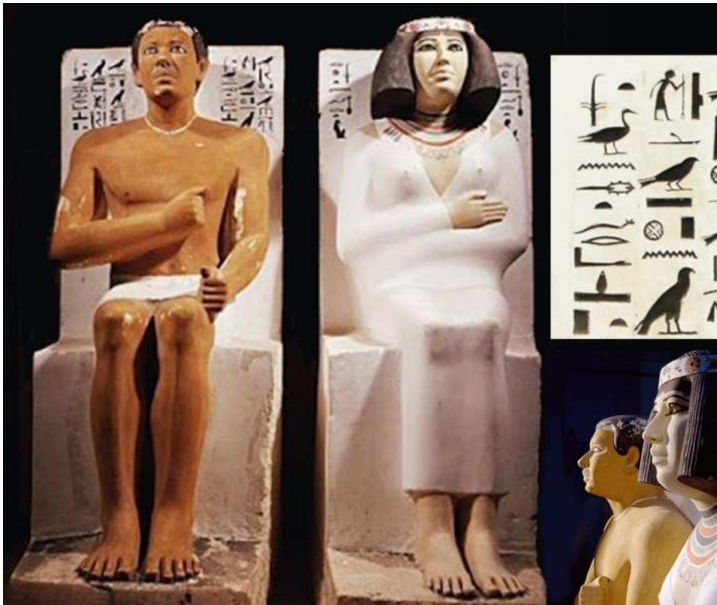
Statue di Rahotep e Nofret (con dettagli), Antico Regno, IV dinastia (2650-2610 a.C.). Museo Egizio del Cairo.