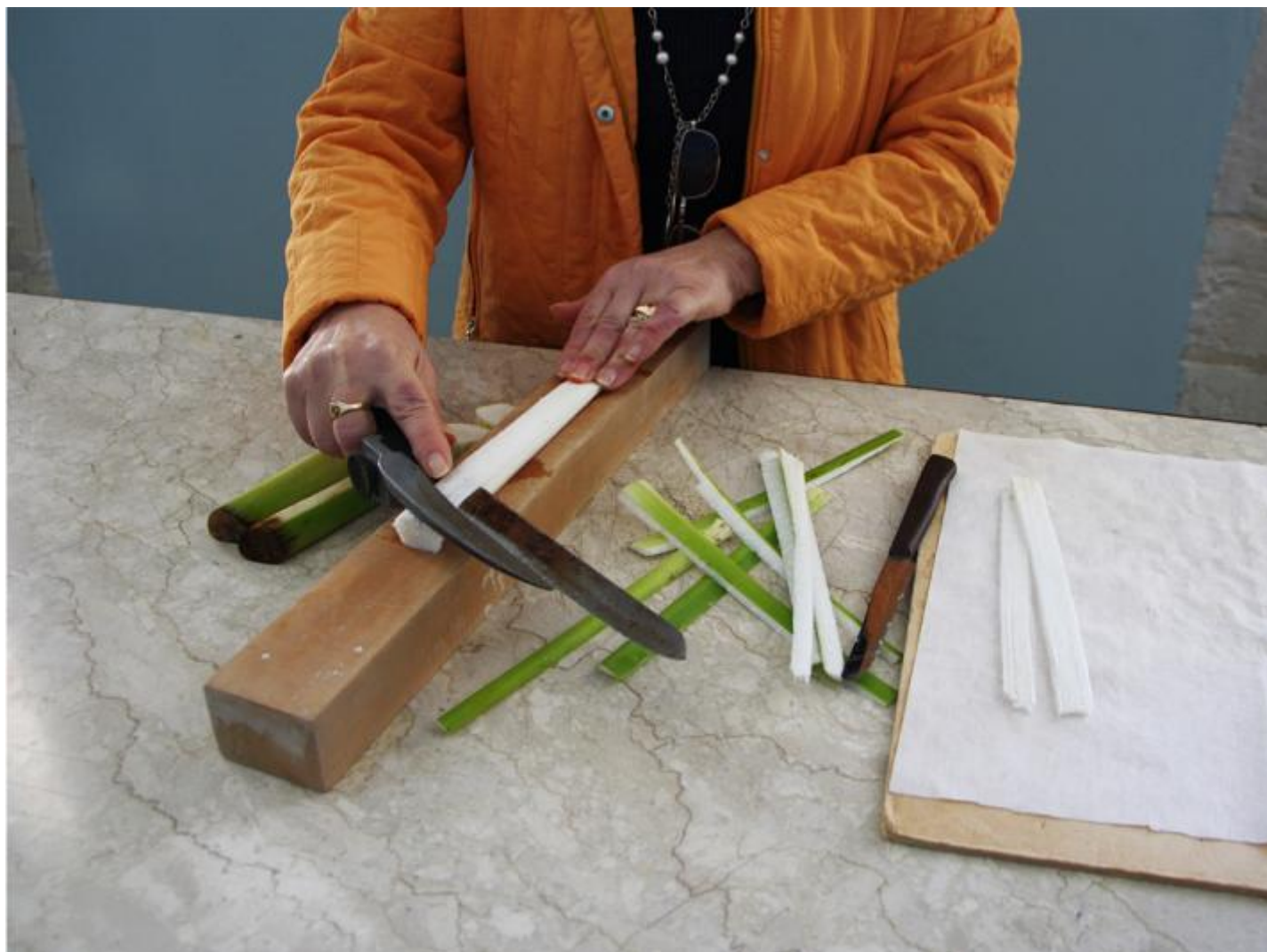
Preparazione della carta di papiro. Museo del Papiro, Siracusa.

Dall'altra parte lo sviluppo della scrittura stessa è il risultato di numerose interferenze e sovrapposizioni, come quella del greco sul demotico che ha generato il copto. Geroglifico, geroglifico corsivo, cuneiforme, ieratico, ieratico anormale, demotico, greco, copto, aramaico, arabo sono forme di scrittura che in questa regione si sono succedute, giustapposte e sovrapposte a causa di campagne militari, scambi economici, trasformazioni politiche e religiose. La mostra ricostruisce con cura scientifica queste sovrapposizioni e compenetrazioni a partire da quelli che alcuni studiosi considerano dei proto-geroglifici. La scrittura dell'antico Egitto utilizzata per registrare terre coltivabili, lavoratori ed entrate fiscali, per comunicare a distanza e anche per etichettare beni e materiali.