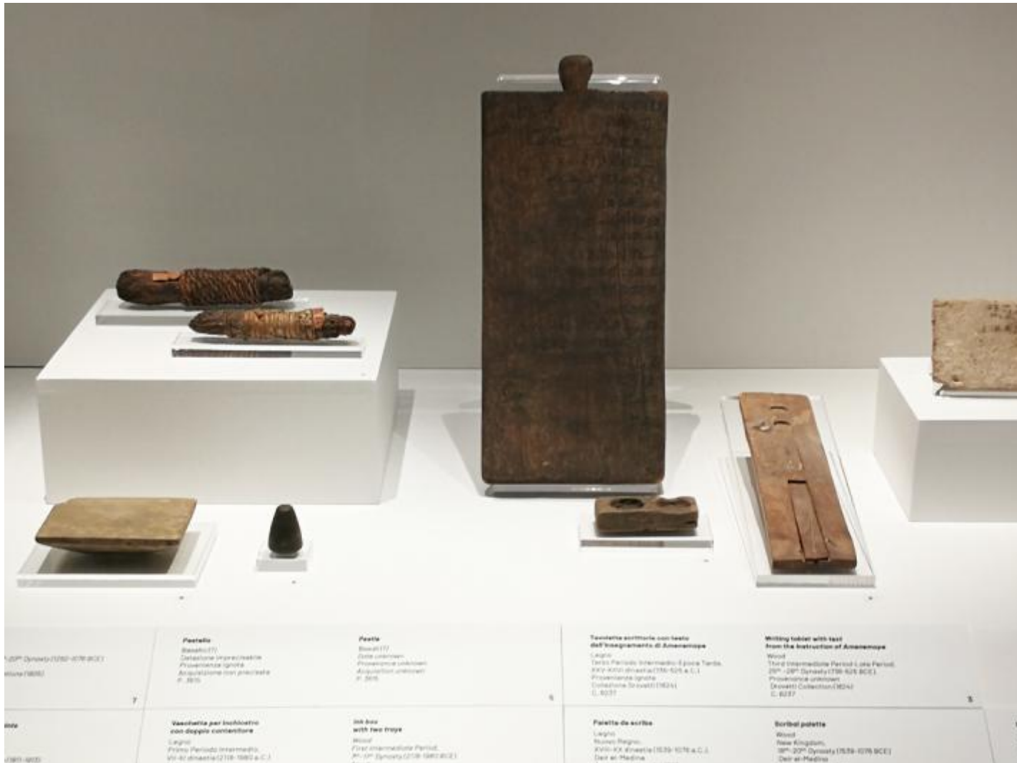
Vetrina espositiva con strumenti utilizzati dallo scriba (a destra un modello di tavoletta da scriba del Primo Periodo Intermedio, VII-XI dinastia (2118-1990 a.C.). Museo Egizio di Torino.

Segni o simboli? Per la difficoltà posta a linguisti e semiologi nel definire i meccanismi di rinvio questi segni vengono chiamati anche simboli. Molti usano infatti i due termini come sinonimi. Nel simbolo opera un meccanismo di rinvio che ricongiunge (come suggerisce l'etimologia del termine ἵπῆρ ἱκίῆρ ἱκίῆρ ἱκίῆρ ἱκίῆρ), mentre nel segno la dialettica di significante e significato, che si attiva ad ogni interpretazione, divarica anziché accostare e riunire. Non è per questa una questione che avrebbe potuto interessare lo scriba, attento piuttosto al potere magico delle parole che agiscono direttamente sulla realtà e la influenzano. A questo proposito è significativo il fatto che nel Papiro della Congiura , il riassunto di un processo ai congiurati che hanno tentato di suscitare una rivolta e attentare alla vita del faraone, si usano giri di parole per evitare di usare l'espressione "uccidere il re". La parola non descrive la realtà ma la determina.