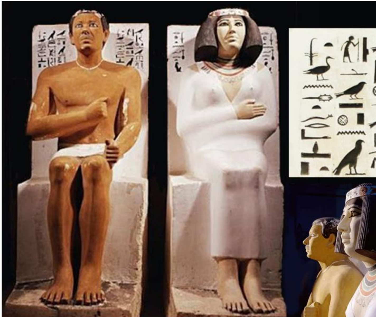
Stature di Rahotep e Nofret (con dettagli), Antico Regno, IV dinastia (2650-2610 a.C.). Museo Egizio del Cairo.