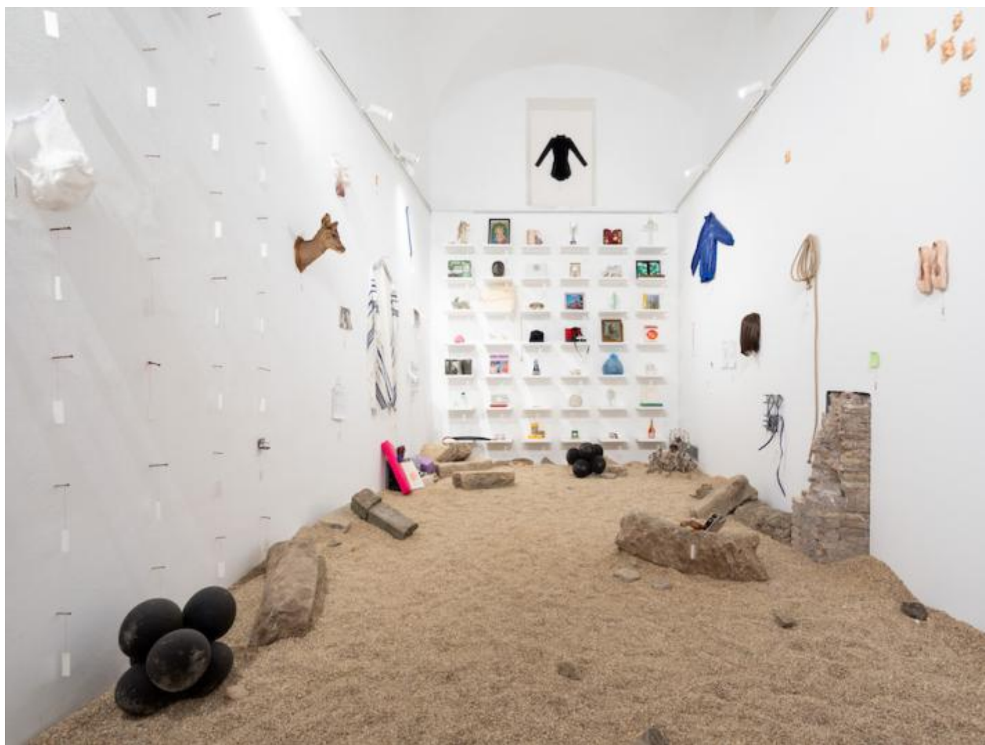
Una linea storta tesa, ph. Daniele Molajoli.

Monte di Pietà , invece, è un'installazione performativa allestita all'interno della mostra collettiva dei borsisti di Villa Medici del periodo 2022-2023. In una stanza chiara col pavimento ricoperto di ghiaia fine, come in un piccolo museo sono esposti e catalogati oggetti di ogni tipo. Ogni oggetto, di cui i possessori hanno deciso di liberarsi, è connesso a un fatto, un evento oppure un torto subito. Dietro a questa collezione ci sono più di duecento testimonianze d'ingiustizia. La giustizia è, infatti, il tema cardine della residenza romana di Lorraine de Sagazan che nella sua ricerca esplora, sfruttando una metodologia compatibile con quella del suo teatro, l'impossibilità di considerare come unica e singolare ogni verità a favore dell'emersione di ogni possibile realtà attorno a ciascun oggetto. Entrando nello spazio, ogni spettatore attiva il ricordo di un'ingiustizia attraverso la propria presenza e può fare esperienza diretta di un materiale-reliquia il cui abbandono si auspica che sia stato, per il proprietario, un vero e proprio rituale di liberazione. Anche qui, la spettatorialità non è passiva ma engagée e in dialogo con l'opera. Tra museo, performance e rituale, Monte di pietà è un'ulteriore prospettiva sul teatro e sulla performance come spazio di relazione che connette il piano individuale a quello collettivo.