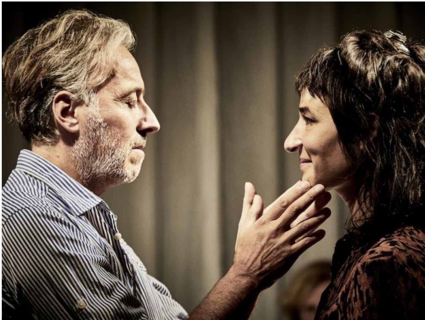
La Vie invisible.