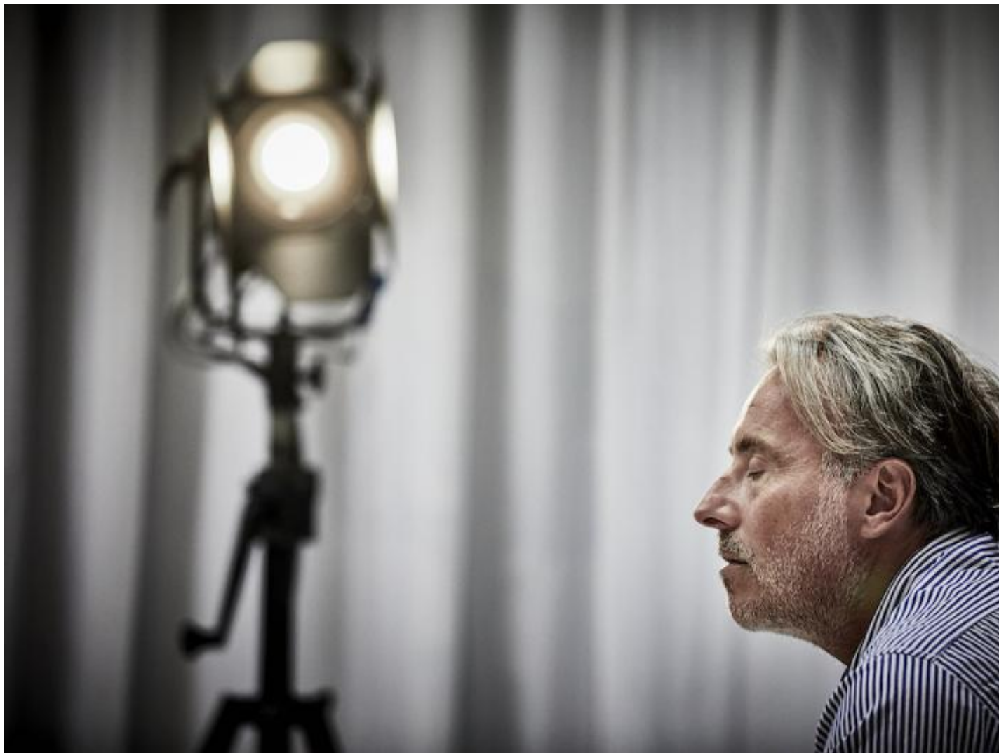
La Vie invisible