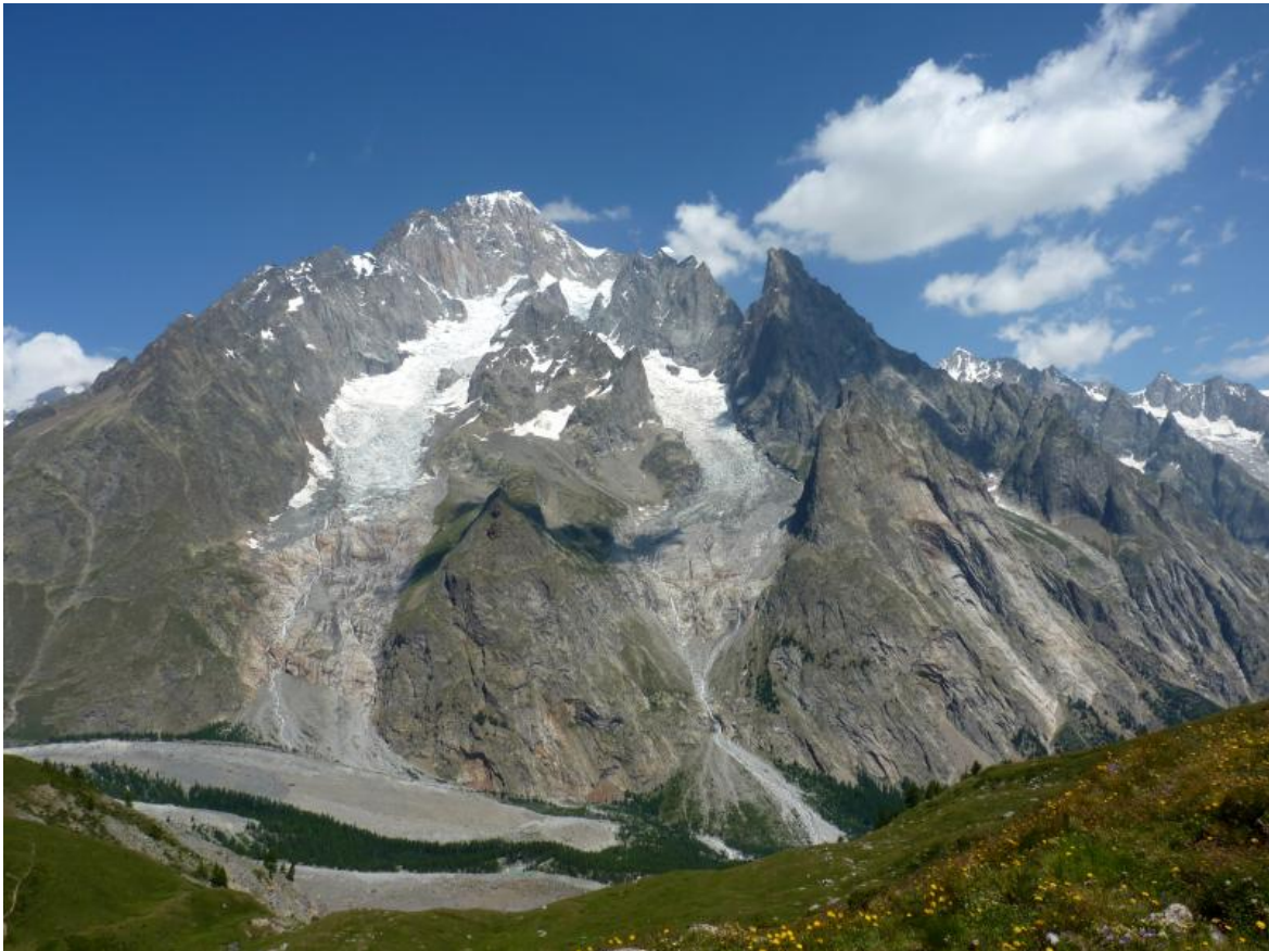
Massiccio del Monte Bianco