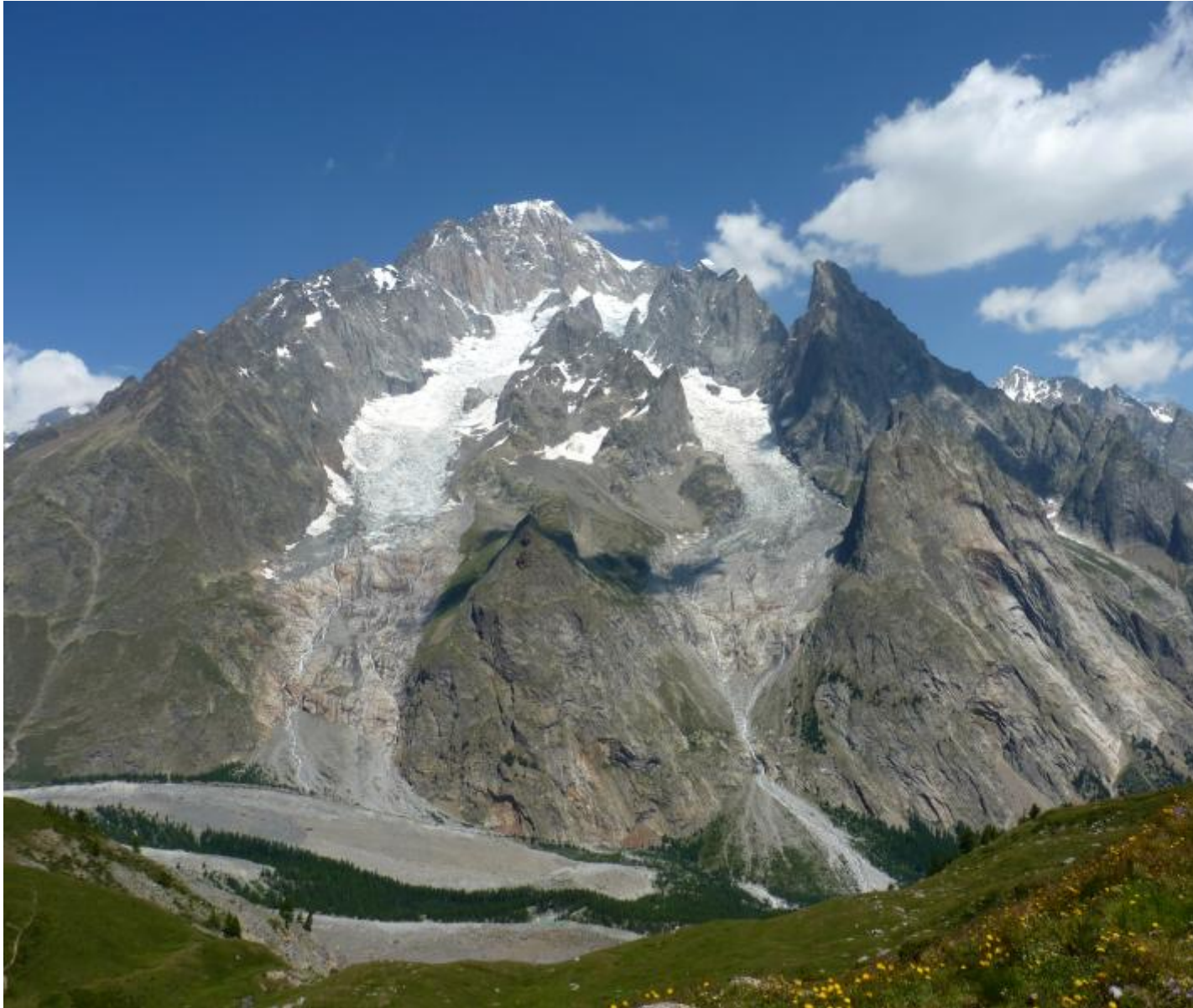
Massiccio del Monte Bianco.

sfida la morte. Lugubre anticipazione del soldato-eroe con la quale di lì a pochi anni i giovani italiani si troveranno a fare tragicamente i conti.