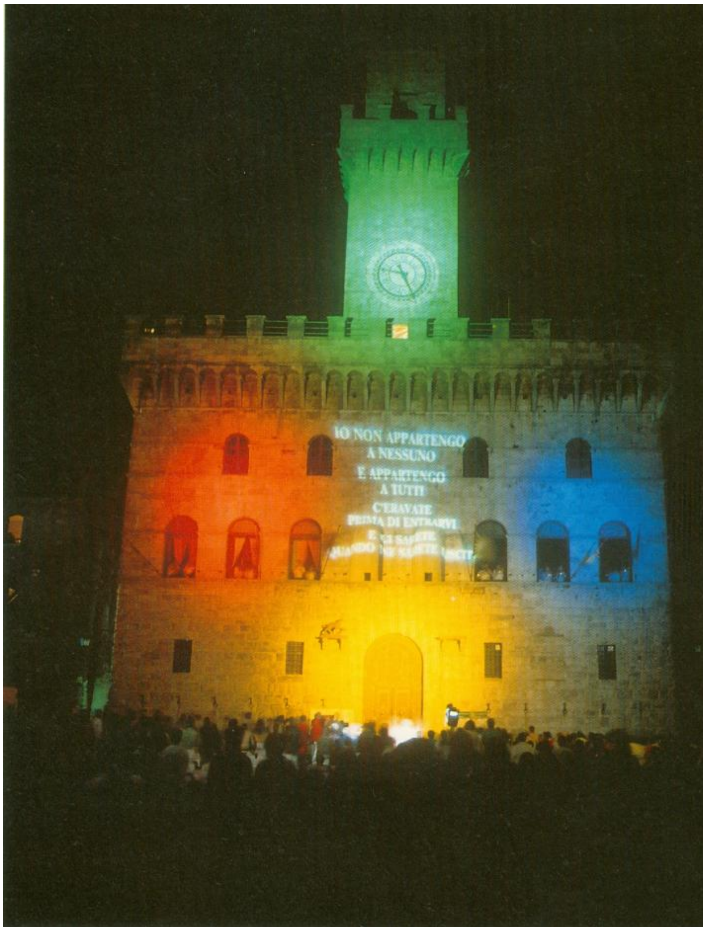
Luca Maria Patella, Omaggio a Diderot, 1983. Proiezione sulla facciata del Palazzo Comunale di Montepulciano.