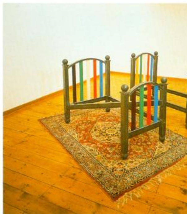
Luca Maria Patella, Letti (The wrong & right), 1990. Materiali vari.

Negli ultimi anni era davvero chiuso in casa, soprattutto a partire da una caduta che gli aveva causato disturbi permanenti a una gamba. E allora lavorava e lavorava, forse anche di più di prima, visto che non aveva più distrazioni. Stava finendo un nuovo libro che spero esca e non passi nel reparto delle attese. Per quanto chiuso in casa, era comunque di una disponibilità assoluta, ha moltiplicato le sue comparse, approfittando della tecnologia, con registrazioni (d'artista, of course) o collegamenti in diretta. Voleva farsi sentire, soprattutto alle ultime generazioni, sicuro che fossero più curiose e interessate.