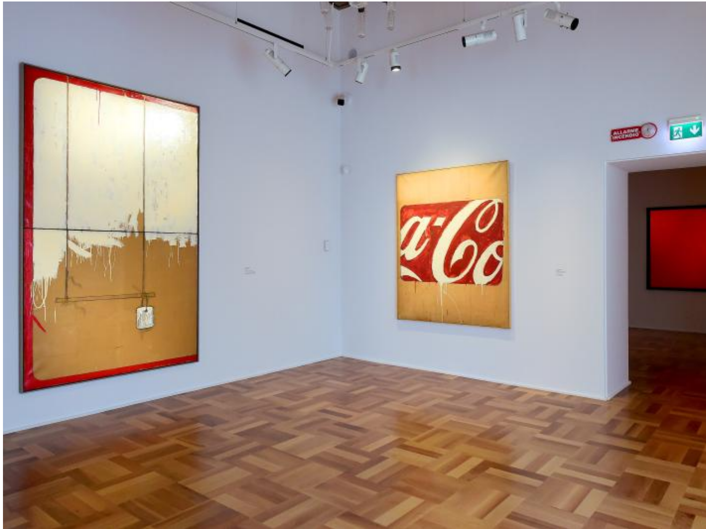
Mario Schifano. Propaganda (1962). Smalto su carta applicato su tela. Collezione Tonelli Terni. Allestimento.

petrolifera statunitense Ã doppiato come fosse visto da un occhio affetto da diplopia. Sono parti di una visione d'insieme, immagini fissate da uno scatto; ritagli di realtÃ che non hanno bisogno di essere visti nella loro interezza per comunicare. Bastano una parte, un trattino e la parte per rimandare a una marca talmente parte del quotidiano che non serve riprodurla per intero. Idem per la scritta della Esso che si riconosce in automatico da qui all'altra parte dell'Oceano. C'Ã un messaggio nelle insegne? Una critica alla societÃ dei consumi che bombarda, manipola, crea falsi bisogni? Come la Pop Art che usa il linguaggio della pubblicitÃ (creato dalla societÃ dei consumi) per criticare questa stessa societÃ, mettendone a nudo i contenuti (vuoti) e le intenzioni (di sfruttamento), c'Ã anche in Schifano (che crea la serie sulla Coca Cola pochi mesi dopo il celebre dipinto Green Coca Cola Bottle (1962) di Warhol) una sorta di stratificazione di messaggi anche se meno polarizzata.