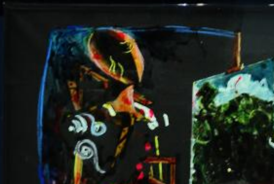
David Lauder "Portrait of the Artist" 1974 Oil on canvas 100 x 100 cm © 1974 David Lauder All rights reserved