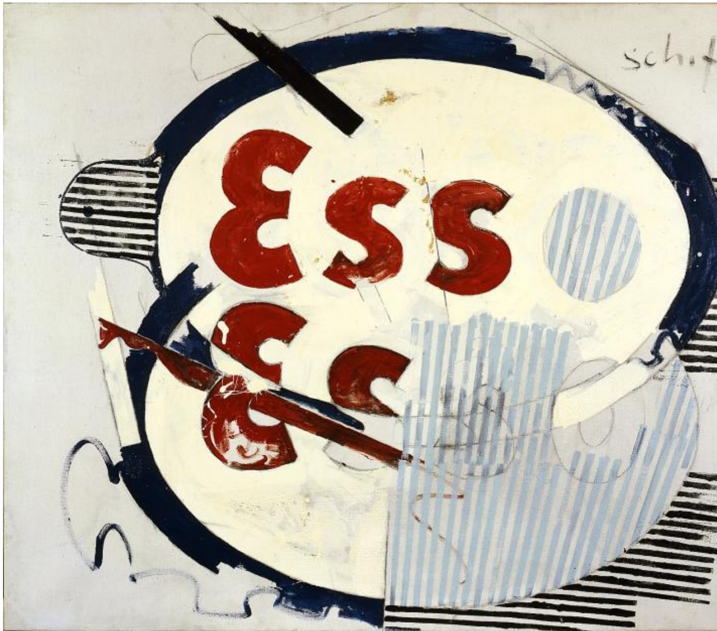
Mario Schifano. Segno d'energia . (1965) Smalto su tela. Collezione Tonelli, Terni.

La fotografia Ã ispirazione tecnica, ma anche riserva di memoria nelle due serie che caratterizzano la fine degli anni â60. Le oasi che rimandano all'infanzia dell'artista nato ad Homs durante un soggiorno della famiglia in Libia dovuto ad un incarico del padre archeologo a Leptis Magna. Quella sul futurismo che omaggia e riattualizza un movimento di grande ispirazione per Schifano appassionato - come i futuristi - di modernitÃ , velocitÃ , della cittÃ . Futurismo Rivisitato (1966) Ã una delle tante versioni di un lavoro ricavato da una foto famosa del gruppo dove i fantastici 6 sono resi in sagome di un nero opaco e rosso acceso dai contorni sfumati su cui lo spray crea un effetto da street art ; una sorta di patina urbana per il gruppo metropolitano. Palma e stelle e Tutte le stelle entrambi del 1967, sono immagini che ancora una volta collegano classicitÃ e modernitÃ , i celi stellati del mediterraneo, ma anche le stelle fluorescenti del nuovo mondo.