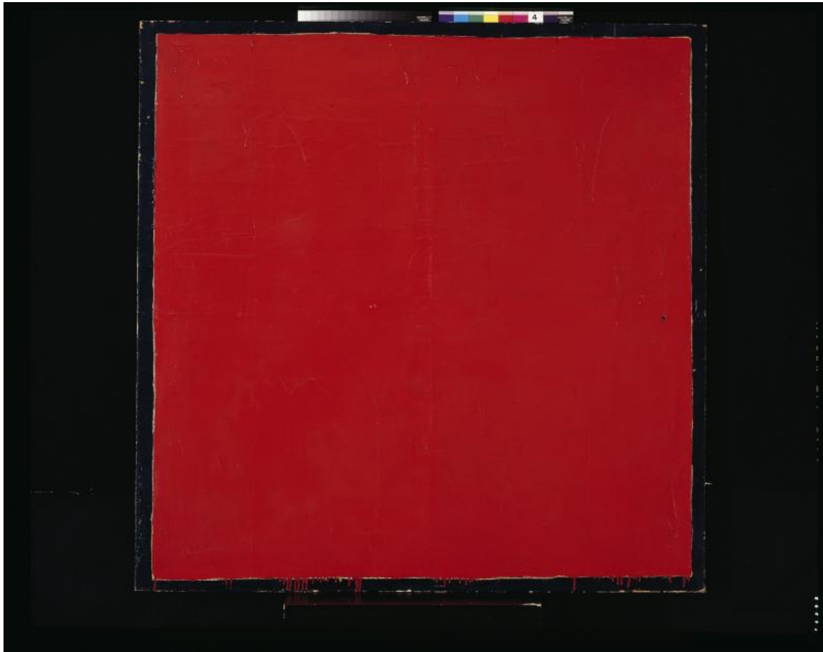
Mario Schifano. Analogo (1961). Smalto su carta applicata su tela. Collezione Luigi e Peppino Agrati - Intesa San Paolo.

Curata da Massimo Barbero ed in collaborazione con l'archivio Schifano che proprio pochi mesi fa ha pubblicato il primo volume del catalogo ragionato: Mario Schifano, le opere pittoriche, anni '60 (2023), la mostra raggruppa circa 50 opere provenienti dalla collezione di Intesa Sanpaolo (Agrati), dal museo del Novecento di Milano, dalla Galleria d'Arte Moderna di Venezia, da collezioni private e di galleristi storici. "Scegliere 55 opere che rappresentano 30 anni dell'artista forse più vitale dell'arte italiana è stata l'impresa più appassionante" - spiega Barbero. - "Il pubblico vedrà opere mai esposte prima"