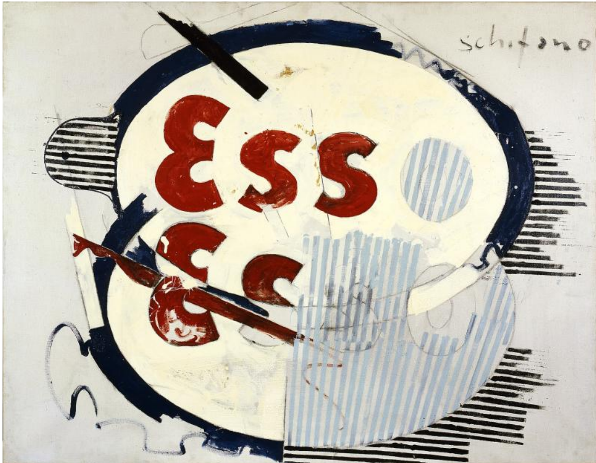
Mario Schifano. Segno d'Energia . (1965) Smalto su tela. Collezione Tonelli, Terni.

La fotografia è ispirazione tecnica, ma anche riserva di memoria nelle due serie che caratterizzano la fine degli anni '60. Le oasi che rimandano all'infanzia dell'artista nato ad Homs durante un soggiorno della famiglia in Libia dovuto ad un incarico del padre archeologo a Leptis Magna. Quella sul futurismo che omaggia e riattualizza un movimento di grande ispirazione per Schifano appassionato - come i futuristi - di modernità, velocità, della città. Futurismo Rivisitato (1966) è una delle tante versioni di un lavoro ricavato da una foto famosa del gruppo dove i fantastici 6 sono resi in sagome di un nero opaco e rosso acceso dai contorni sfumati su cui lo spray crea un effetto da street art ; una sorta di patina urbana per il gruppo metropolitano. Palma e stelle e Tutte le stelle entrambi del 1967, sono immagini che ancora una volta collegano classicità e modernità, i cieli stellati del mediterraneo, ma anche le stelle fluorescenti del nuovo mondo.