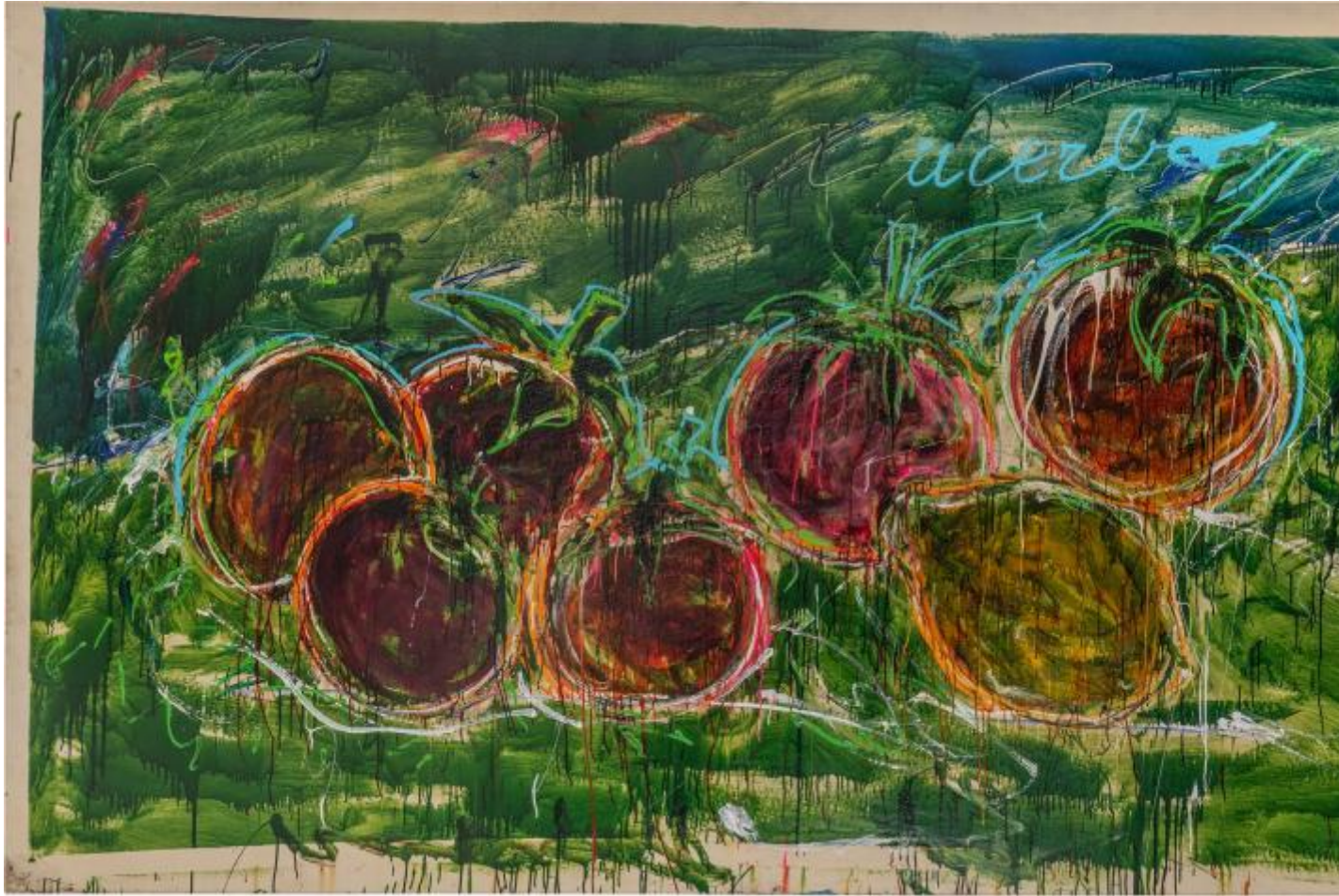
Mario Schifano. Acerbo (1987). Smalto su tela. Collezione Tonelli, Terni.

La mostra termina qui lasciando aperta la possibilità di un finale sulla quarta decade: gli anni '90, preannunciata dal monumentale Per esempio (1990), della collezione Jacorossi. Un immenso collage di schermi (650 x 500 x 4 cm) che fissano il presente (l'ormai già lontano 1990). È un'immagine di dinamismo, di inafferrabilità, irriducibile ad una coerenza che sembra nascere dal desiderio di Schifano di venirne almeno un po' a capo mettendo in gioco tutta la sua esperienza da archeologo con il padre a Villa Giulia, da fotografo, da sceneggiatore e nevrotico ossessionato dalla televisione per lasciare ai posteri il senso del passato che parla e la fiducia nel futuro che ascolta.