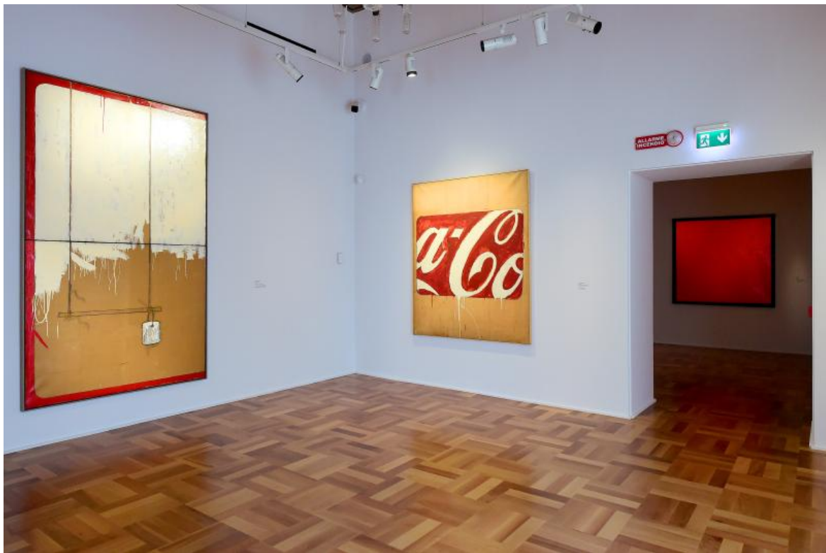
Mario Schifano. Propaganda (1962). Smalto su carta applicato su tela. Collezione Tonelli Terni. Allestimento.

famosa società petrolifera statunitense è doppiato come fosse visto da un occhio affetto da diplopia. Sono parti di una visione d'insieme, immagini fissate da uno scatto; ritagli di realtà che non hanno bisogno di essere visti nella loro interezza per comunicare. Bastano una "a", un trattino e la "C" per rimandare a una marca talmente parte del quotidiano che non serve riprodurla per intero. Idem per la scritta della Esso che si riconosce in automatico da qui all'altra parte dell'Oceano. C'è un messaggio nelle insegne? Una critica alla società dei consumi che bombarda, manipola, crea falsi bisogni? Come la Pop Art che usa il linguaggio della pubblicità (creato dalla società dei consumi) per criticare questa stessa società, mettendone a nudo i contenuti (vuoti) e le intenzioni (di sfruttamento), c'è anche in Schifano (che crea la serie sulla Coca Cola pochi mesi dopo il celebre dipinto Green Coca Cola Bottle (1962) di Warhol) una sorta di stratificazione di messaggi anche se meno polarizzata.