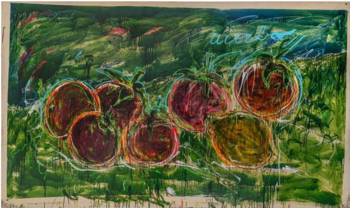
Mario Schifano. Acerbo (1987). Smalto su tela. Collezione Tonelli, Terni.

dall'astrazione. "...una deriva creativa, un edonismo per il colore, una pittura sempre di superficie realizzata spesso all'aperto, a volte davanti al pubblico" - spiega Achille Bonito Oliva sintetizzando così gli anni '80 dell'artista.