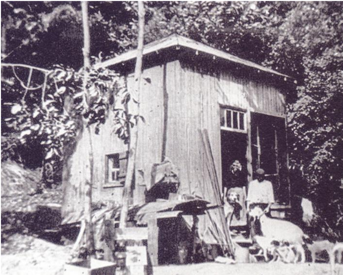
Il «Tripode», baracca di legno edificata nel 1905 da Jarry lungo la Senna, nei pressi della chiusa di Coudray-Montceaux.