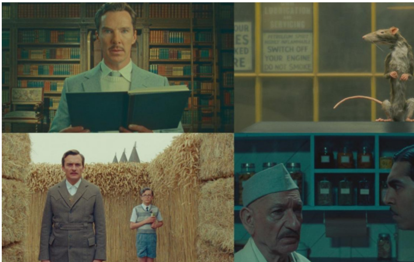
I corti di Wes Anderson tratti da Roald Dahl per Netflix.

In Italia la pubblicazione su Netflix dei quattro cortometraggi Ã coincide con lâuscita nelle sale di Asteroid City che invece, dopo l'invito in concorso a Cannes, nel resto del mondo era stato distribuito a partire dall'estate scorsa; in questo modo ci Ã stata involontariamente offerta un'abbuffata di opere del regista texano. La sceneggiatura del film Ã opera sua, col contributo da soggettista del fedele amico Roman Coppola, e non si rivela nÃ© meno elaborata nÃ© meno stratificata della storia di Henry Sugar. Il primo narratore Ã un conduttore televisivo degli anni Cinquanta che introduce la messa in onda della piÃ teatrale Asteroid City ; il programma televisivo che funge da cornice Ã in bianco e nero, la rappresentazione dell'annunciata piÃce Ã in un Technicolor che non ha nulla di teatrale; tra una scena del testo e l'altra, tra un intermezzo del conduttore e un altro, i dietro le quinte dell'ideazione e dell'allestimento della commedia sono di nuovo in bianco e nero ma anch'essi inscenati come fossero pezzi di teatro.