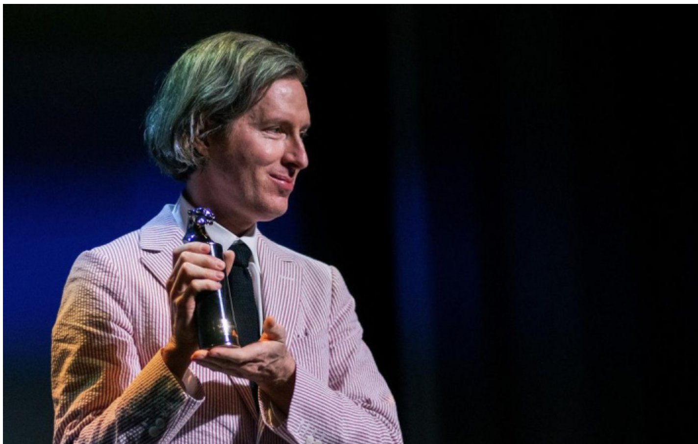
Wes Anderson all'80ma Mostra del Cinema di Venezia, 1° settembre 2023.

Così, nell'anno in cui l'assenza di molti divi da tappeto rosso ha restituito centralità alla figura del regista, Wes Anderson si è confermato tra i più iconici della categoria: si evidenzia spesso l'eleganza dei personaggi dei suoi film ma lui stesso è sempre riconoscibile per il caschetto di capelli ben curato e i raffinati completi color pastello. Eppure, il suo atteggiamento appare schivo, il tono della sua voce negli incontri pubblici è sempre estremamente pacato quasi come se provasse imbarazzo. Il contrasto tra il suo aspetto inconfondibile e l'apparente atteggiamento di chi preferirebbe defilarsi può sembrare anomalo, ma fa pienamente parte del personaggio come lo abbiamo visto anche nella recente versione veneziana.