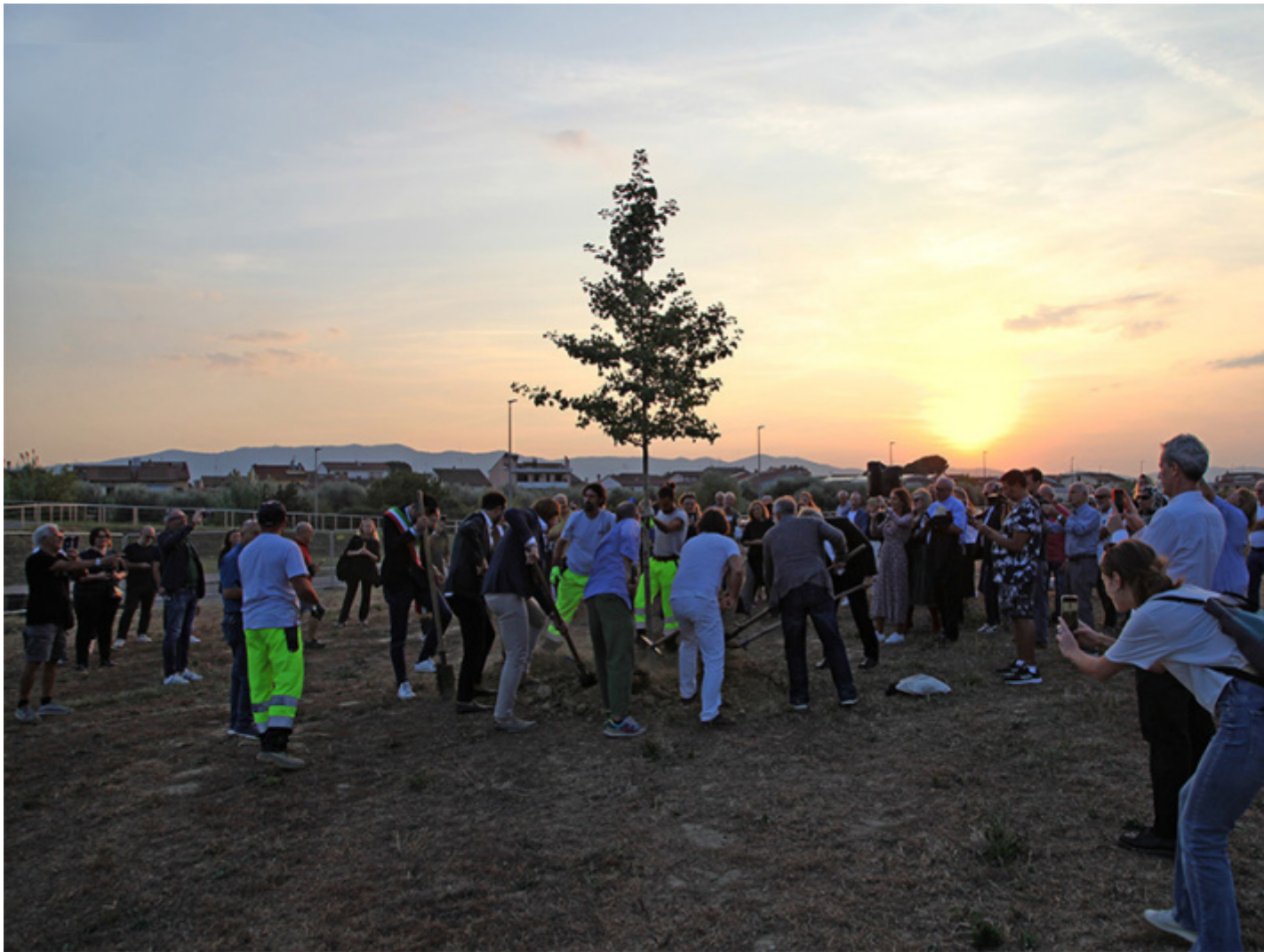
Arte per la riforestazione. Messa a dimora del Ginkgo biloba.

battaglie sâ??inserirono in una mutazione che negli anni della ripresa economica e della ricostruzione diede luogo ad una estensione semantica al concetto di patrimonio e paesaggio includendovi Â«qualsiasi esito del rapporto tra uomo e natura, individuo e societÃÂ».