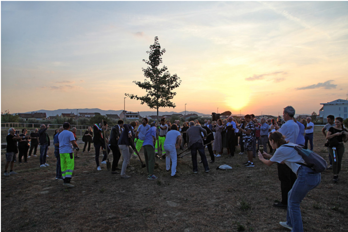
Arte per la riforestazione. Messa a dimora del Ginkgo biloba.

In Le belle arti e i selvaggi. La scoperta dell'altro, la storia dell'arte e l'invenzione del patrimonio culturale (Marsilio, Venezia 2019, p. 200) Simone Verde spiega che «Il concetto di territorio ereditato dalle “bellezze panoramiche” delle leggi Bottai venne tradotto nella Costituzione dal termine “paesaggio” sortendo un doppio effetto. La tutela venne limitata a pochi punti caratterizzati da valore estetico, mentre la pianificazione territoriale finì tra le competenze del Ministero dei lavori pubblici e sotto l'ipoteca dei Comuni», in altri termini si diede licenza al sacco del territorio da parte degli speculatori. Antonio Cederna comprese la necessità di restituire il patrimonio e il paesaggio alla rigenerazione sociale. Le sue epiche battaglie s'inserirono in una mutazione che negli anni della ripresa economica e della ricostruzione diede luogo ad una estensione semantica al concetto di patrimonio e paesaggio includendovi «qualsiasi esito del rapporto tra uomo e natura, individuo e società».