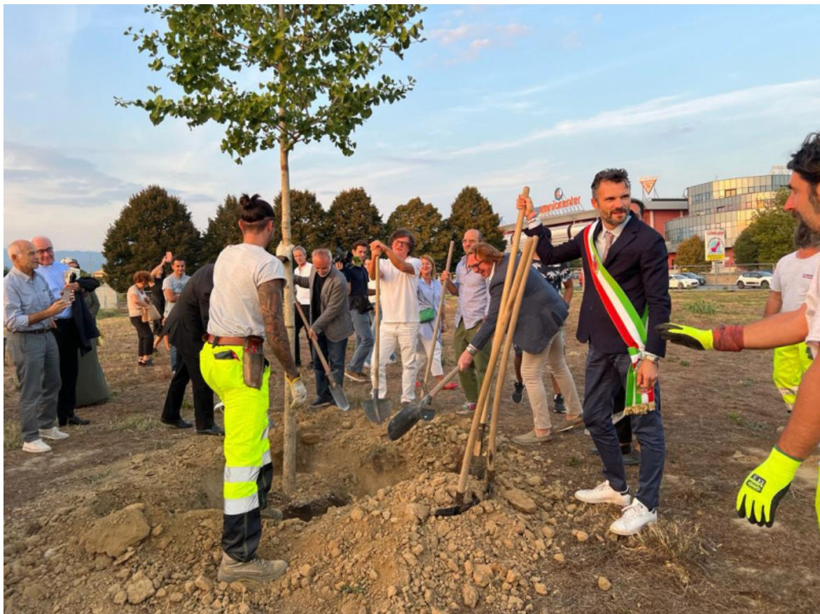
Arte per la riforestazione. Messa a dimora del Ginkgo biloba alla presenza del Sindaco di Prato Matteo Biffoni, dell'Assessore

Abitare un luogo è un'esperienza complessa. Ci sono luoghi che possiamo abitare, attraversare, contemplare, ma anche luoghi che abbiamo interiorizzato o immaginato. È persino possibile diventare luogo a se stessi. Il piano dell'esperienza fisica si compenetra dunque con quello di rappresentazioni estetiche, letterarie, simboliche e psicologiche, determinate anche dalle relazioni sociali e culturali all'interno del quale si istituiscono, si formano e riformano le identità (il fare comunità attraverso l'esperienza di luogo è un obiettivo non secondario del progetto di Cristiani). Prendendo a prestito un'espressione di Giovanni Ozzola, uno degli artisti invitati a collaborare al progetto, per dare forma a un luogo è necessario «fare anima». Ozzola lavora a un concetto esteso di paesaggio che comporta l'assunzione di responsabilità nei confronti della comunità e dell'ambiente in cui l'artista interviene.