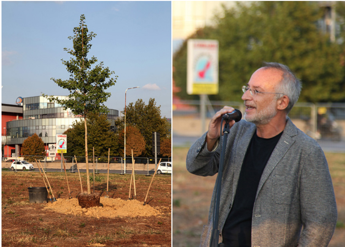
Arte per la riforestazione. Stefano Mancuso.

Le parole di Mancuso richiamano inevitabilmente alla mente il progetto 7000 Eichen di Joseph Beuys che nel 1982, per la manifestazione artistica documenta 7 , propose la piantumazione di 7000 querce. Un progetto di riforestazione urbana concepito dall'artista come «scultura sociale», che ha coinvolto l'intera città di Kassel. Il progetto nacque in seno al programma ecologico e al tempo stesso antropologico della Free International University for Creativity and Interdisciplinary Research (FIU) fondata nel febbraio 1974. Sono gli anni in cui si sviluppò una sensibilità verso l'ambiente coniugata all'utopia della terza via , alternativa sia al sistema fondato sul capitalismo privato, sia a quello fondato sul capitalismo di stato. Anni in cui gli artisti mettevano la loro arte al servizio dell'impegno civile. Nel 1973 Gianfranco Baruchello fondò Agricola Cornelia S.p.A. allo scopo di conciliare l'arte con l'agricoltura e la zootecnia, un progetto nel quale l'arte era allo stesso tempo azione economica, politica e poetica.