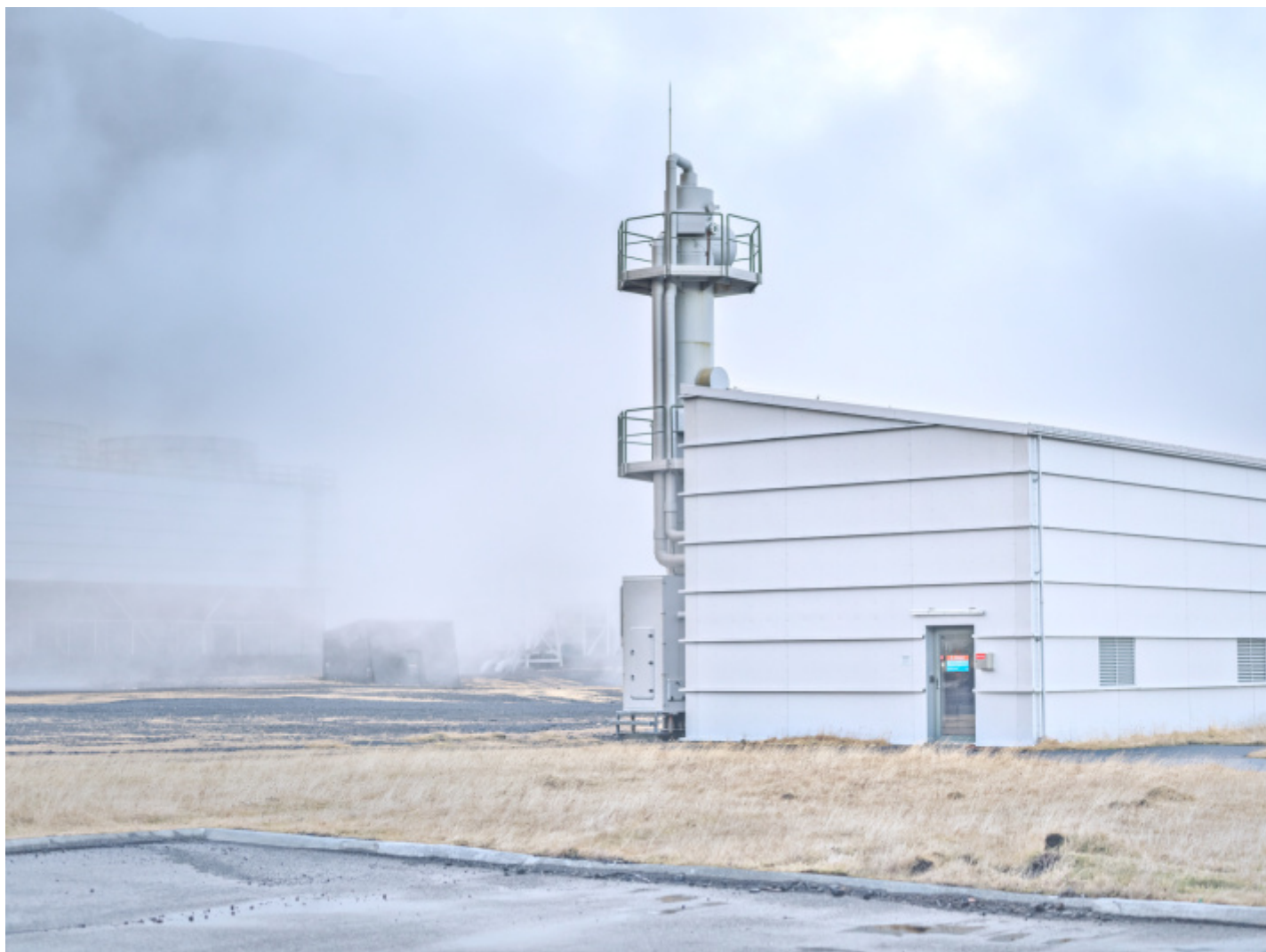
Carbon capture machine #3, Islanda, 2022 © Luca Locatelli.

Luca Locatelli, primo premio nel 2020 del World Press Photo nella sezione “Environment Stories” e interessato da molti anni alla ricerca delle risposte possibili in grado di ribaltare lo stato di crisi in cui verte il nostro ecosistema, è stato l’autore incaricato da Intesa San Paolo per rintracciare nel mondo alcune delle soluzioni più efficaci a uno dei più gravi problemi dell’umanità di oggi portandole in veste fotografica alle Gallerie d’Italia di Torino. Dal 21 settembre al 18 febbraio 2024, a cura di Elisa Medde e col supporto specialistico di Ellen MacArthur Foundation, il risultato dell’ispezione di Locatelli prende forma nella mostra “The Circle. Soluzioni per un futuro possibile”, accompagnata da un catalogo edito da Skira. È infatti il cerchio il simbolo che racchiude le possibili vie evidenziate da Locatelli, evocato nella fattispecie attraverso il tema dell’economia circolare (Circular Economy), che vede al centro del proprio funzionamento, come è facile intuire, il riciclo, quel recupero di tutto ciò che oggi chiamiamo scarto e che un domani può invece essere concepito come nuova fonte di energia e nuovo materiale utilizzabili.