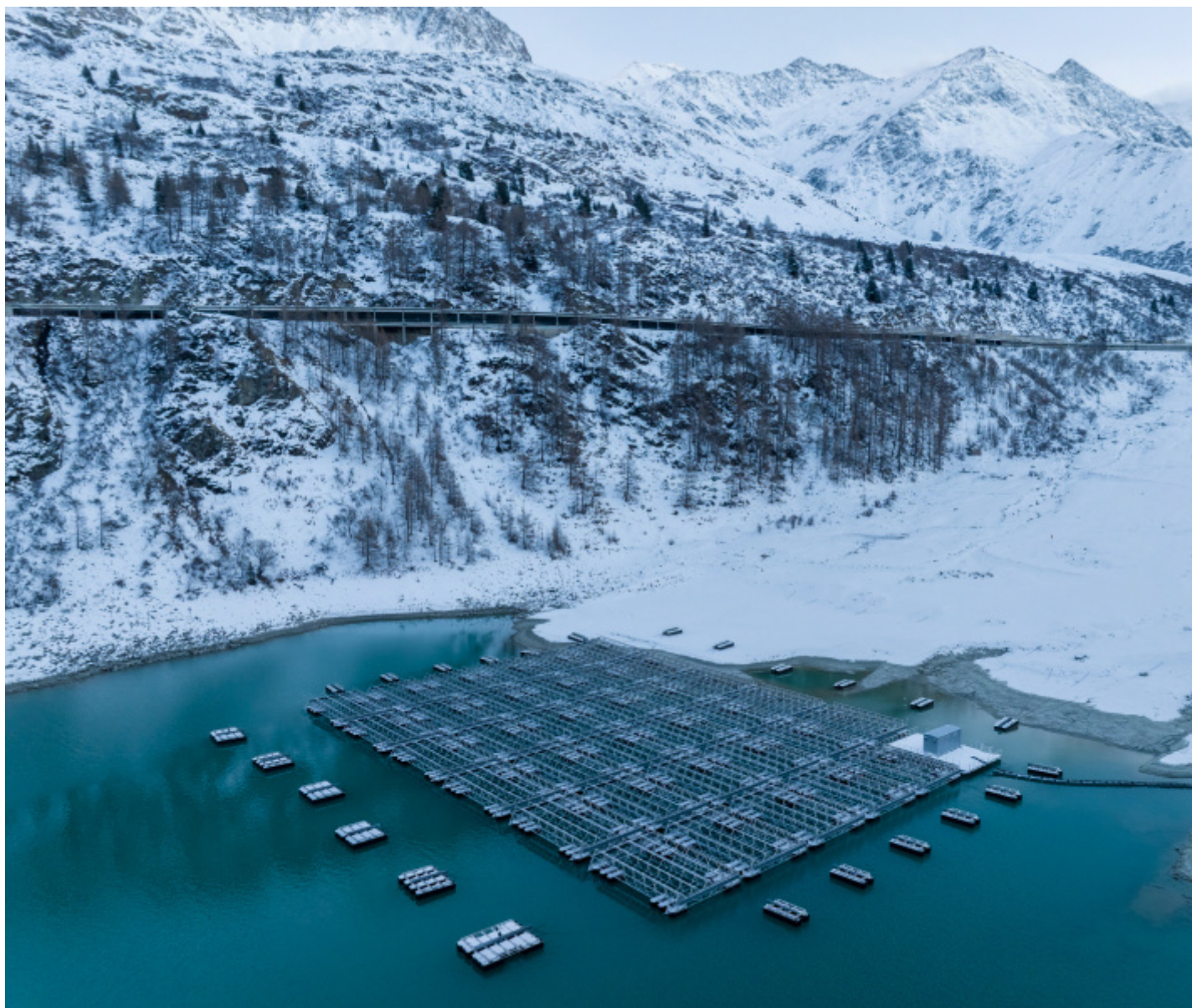
Lac des Toules, Svizzera, 2022 © Luca Locatelli.

della “Circular Economy” che Locatelli ci mostra, il ragionamento produttivo deve essere rivolto all’annullamento del concetto di fine della materia, ma, al contrario, portato a non percepire più il punto della catena che la precede e quello che le segue. Così il riciclo tessile, in Germania, o aeronautico, in Francia, o ancora l’ex miniera di sale in Romania trasformata in attrazione turistica visitabile in piccole barche a remi – di cui lo spettatore può far esperienza attraverso un’ampia documentazione video proiettata a parete – sono solo alcuni delle decine di esempi, tra paesi e settori di produzione, che Locatelli porta a testimonianza.