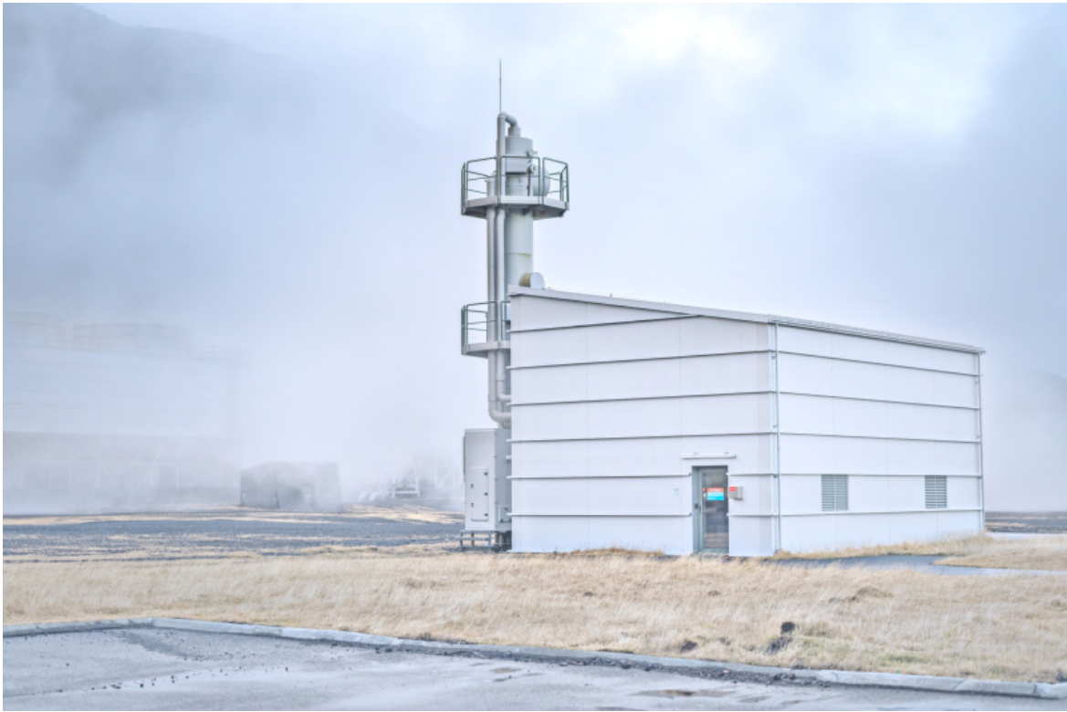
Carbon capture machine #3, Islanda, 2022 © Luca Locatelli.

Luca Locatelli, primo premio nel 2020 del World Press Photo nella sezione “Environment Stories” e interessato da molti anni alla ricerca delle risposte possibili in grado di ribaltare lo stato di crisi in cui verte il nostro ecosistema, è stato l’autore incaricato da Intesa San Paolo per rintracciare nel mondo alcune delle soluzioni più efficaci a uno dei più gravi problemi dell’umanità di oggi portandole in veste fotografica alle Gallerie d’Italia di Torino. Dal 21 settembre al 18 febbraio 2024, a cura di Elisa Medde e col supporto specialistico di Ellen MacArthur Foundation, il risultato dell’ispezione di Locatelli prende forma nella mostra “The Circle. Soluzioni per un futuro possibile”, accompagnata da un catalogo edito da Skira. È infatti il cerchio il simbolo che racchiude le possibili vie evidenziate da Locatelli, evocato nella fattispecie attraverso il tema dell’economia circolare (Circular Economy), che vede al centro del proprio funzionamento, come è facile intuire, il riciclo, quel recupero di tutto ciò che oggi chiamiamo scarto e che un domani può invece essere concepito come nuova fonte di energia e nuovo materiale utilizzabili.