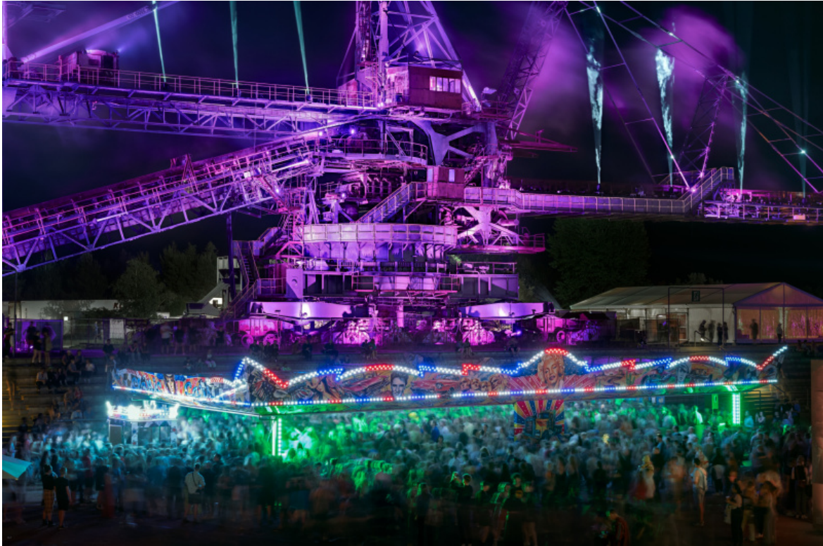
Coal mine future Ferropolis #5, Germania, 2022 © Luca Locatelli.

La fotografia può dunque illustrare i fenomeni su cui intende puntare il riflettore: “lo cerco di tradurli in un modo comprensibile per coinvolgere più persone nel cambiamento, per agire come un’unica forza. Usando mostre, instagram, tutto ciò che può essere utile per diffondere questo messaggio.”