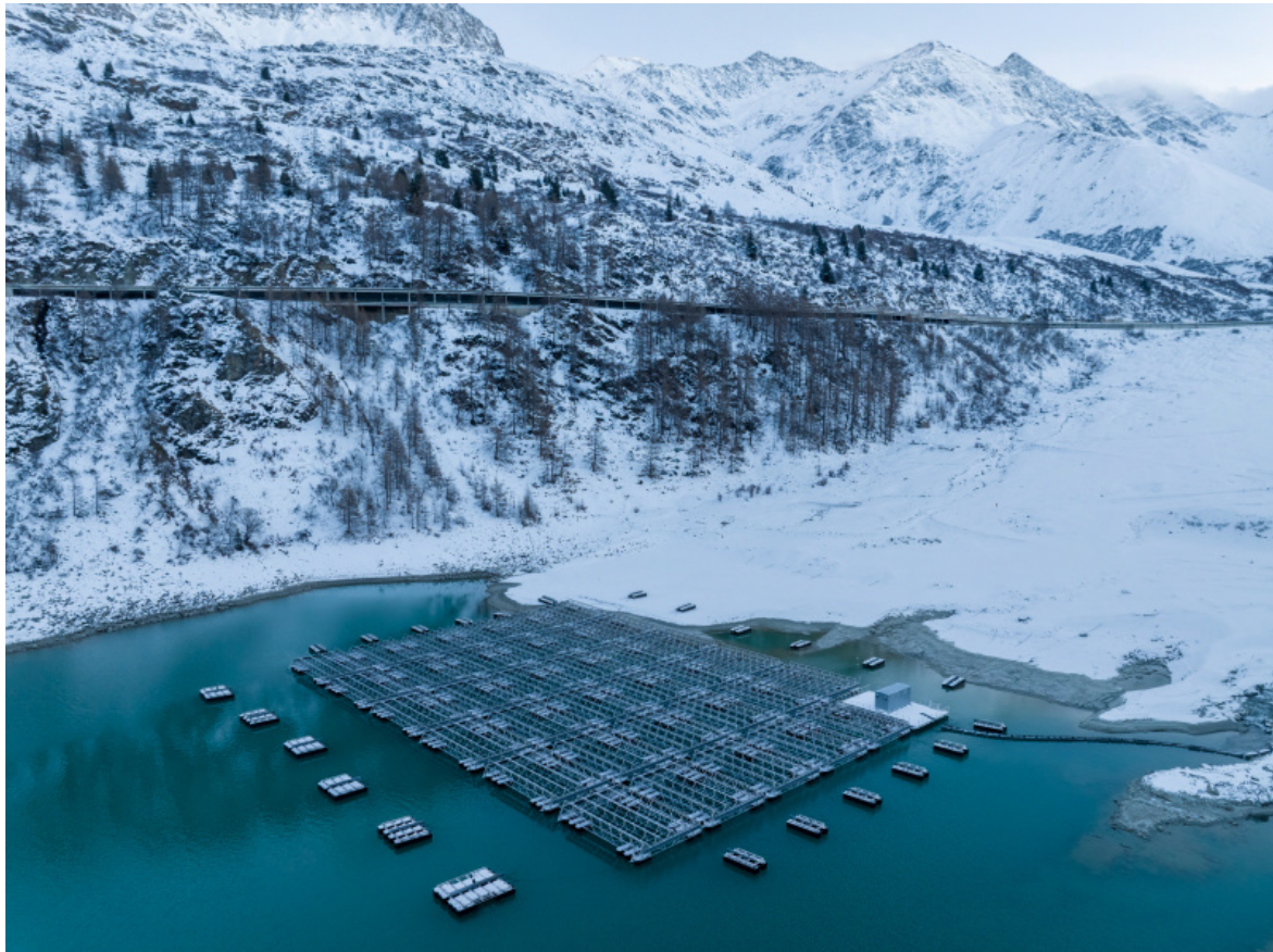
Lac des Toules, Svizzera, 2022 © Luca Locatelli.