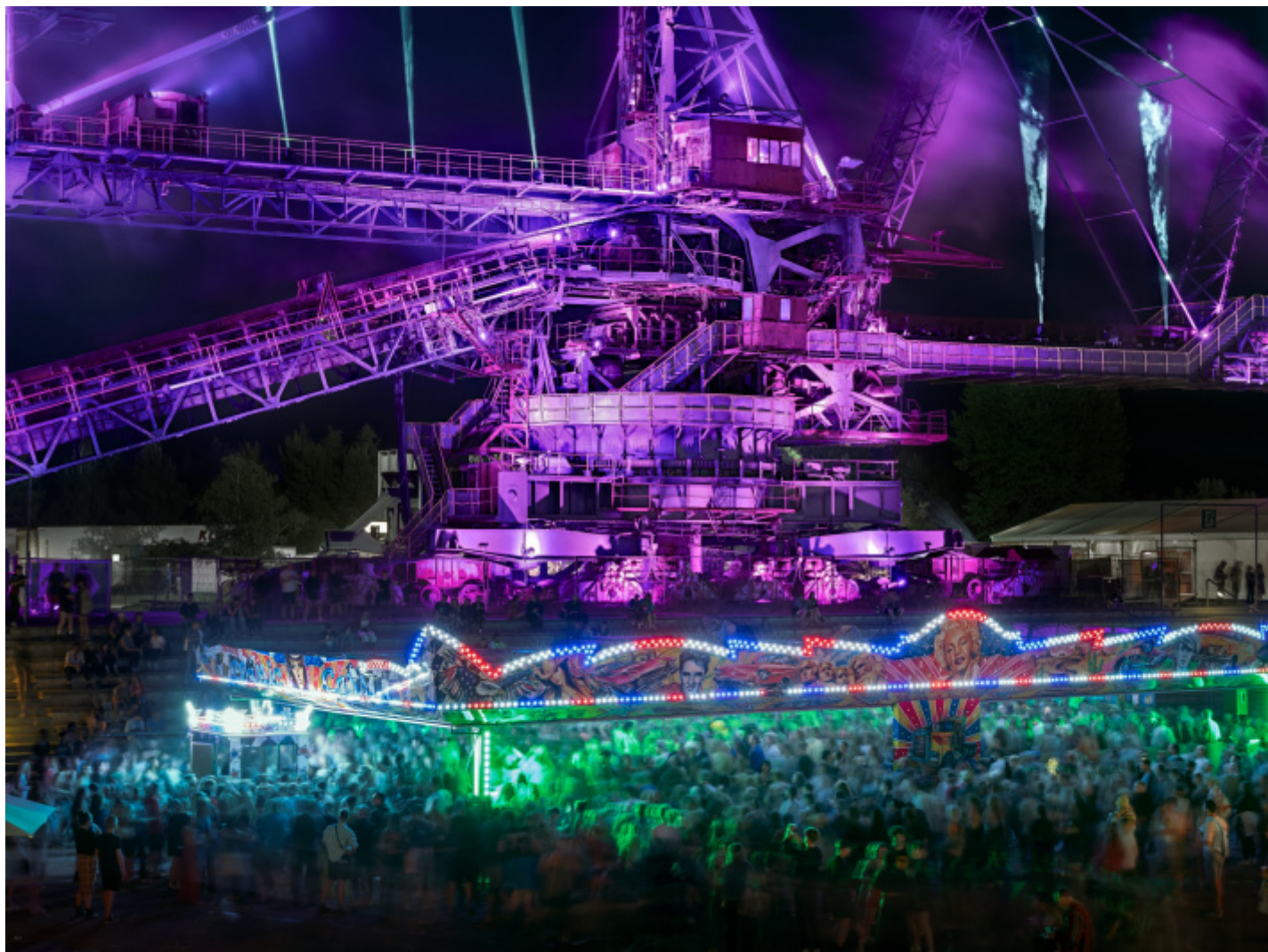
Coal mine future Ferropolis #5, Germania, 2022 © Luca Locatelli.

La fotografia può dunque illustrare i fenomeni su cui intende puntare il riflettore: “Io cerco di tradurli in un modo comprensibile per coinvolgere più persone nel cambiamento, per agire come un’unica forza. Usando mostre, instagram, tutto ciò che può essere utile per diffondere questo messaggio.”