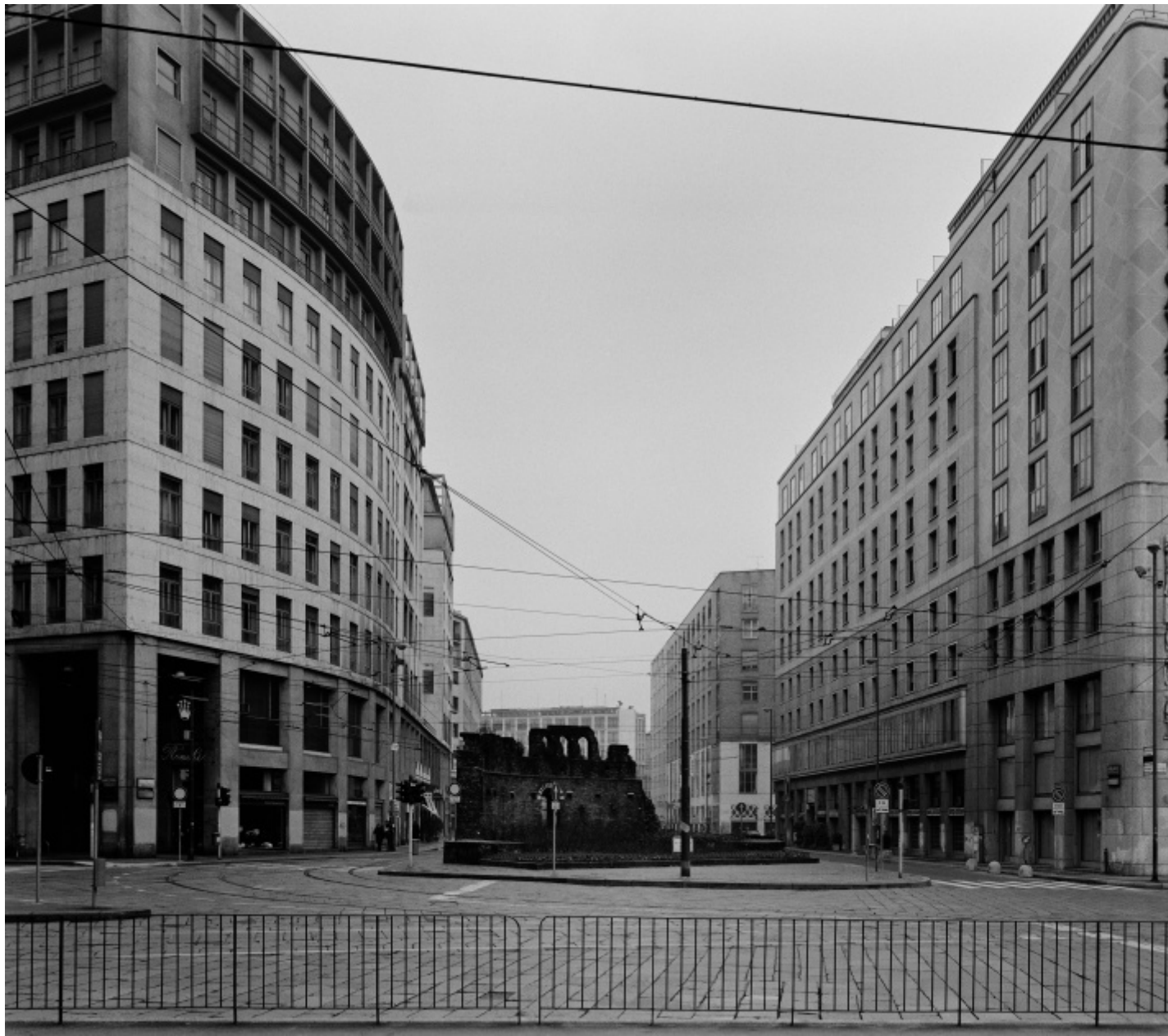
Gabriele Basilico, Milano 1996, Foto di Gabriele Basilico/Archivio Gabriele Basilico.

Torniamo allora a questo suo bisogno di «cogliere i messaggi della città» e cerchiamo di leggere una sua celebre immagine di Milano, appartenente alla serie La città interrotta , per comprendere meglio come Gabriele Basilico riuscisse in una singola fotografia a condensare magicamente la storia di un luogo, attraverso un approccio essenziale, asciutto, che offriva precise tracce interpretative. Si tratta di una fotografia di piazza Missori, vista frontalmente, guardando verso via Albricci: un ampio stradone che si riduce dopo poco in due stretti vicoli contornanti il rudere smangiato di quella che un tempo era stata la grande chiesa romanica di San Giovanni in Conca. Ai due lati degli umili e tristi resti di questa storica chiesa (di cui ora sopravvivono solo la cripta e parti dell'abside) si ergono in posizione eminente due imponenti edifici della fine degli anni '40, simili a due giganteschi generali saldamente ancorati al terreno, ma protesi verso un'avanzata che... non riescono a compiere e in effetti non compiranno mai. Con un tocco da maestro, infatti, tutto il primo piano di questa fotografia risulta genialmente occupato da un leggero sbarramento a transenna che indica l'impossibilità di ulteriori conquiste: qualcosa come un'esile ringhiera che avrebbe potuta essere spazzata via quasi in un soffio. Se non fosse che tutto però si è davvero interrotto lì, lungo la linea invalicabile di tale sottile transenna.