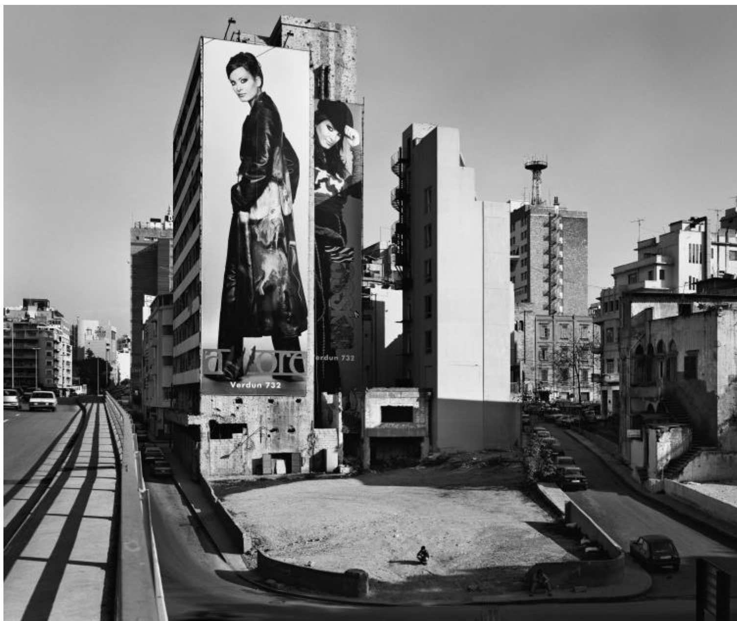
© Gabriele Basilico | Beirut 2003.

apparentemente repentino a una condizione opposta rispetto alla precedente. Ecco, dunque, una città nuova: Beirut ha di nuovo strade, parcheggi, abitazioni, incastonati tra i segni ancora evidenti dello scontro sui palazzi non ancora restaurati o ricostruiti. Senza mai drammatizzare ostentatamente, attraverso le immagini di Beirut Basilico restituisce un pezzo di storia dell'uomo riflessa sui muri, delegando alle cose immobili il compito di narrare lo stravolgimento che hanno visto e subito negli anni. Tra il 2003, il 2008 e il 2011, Beirut rinasce a un nuovo presente in mezzo ai cantieri, trasformando radicalmente la propria percezione visiva. Il passato viene cancellato e ridefinito dalle nuove lastricature in favore, come dice Pascal, di un presente passeggero che guarda però già al futuro, di un presente che accade per permettere una nuova costruzione, e che pare avere in bocca – il presente può allora essere anche un cippo con un'epigrafe incisa a monito di chi lo attraverserà – le parole del poeta italiano Attilio Lolini: "La rivoluzione non era / dietro l'angolo / vanno distrutte anche le rovine."