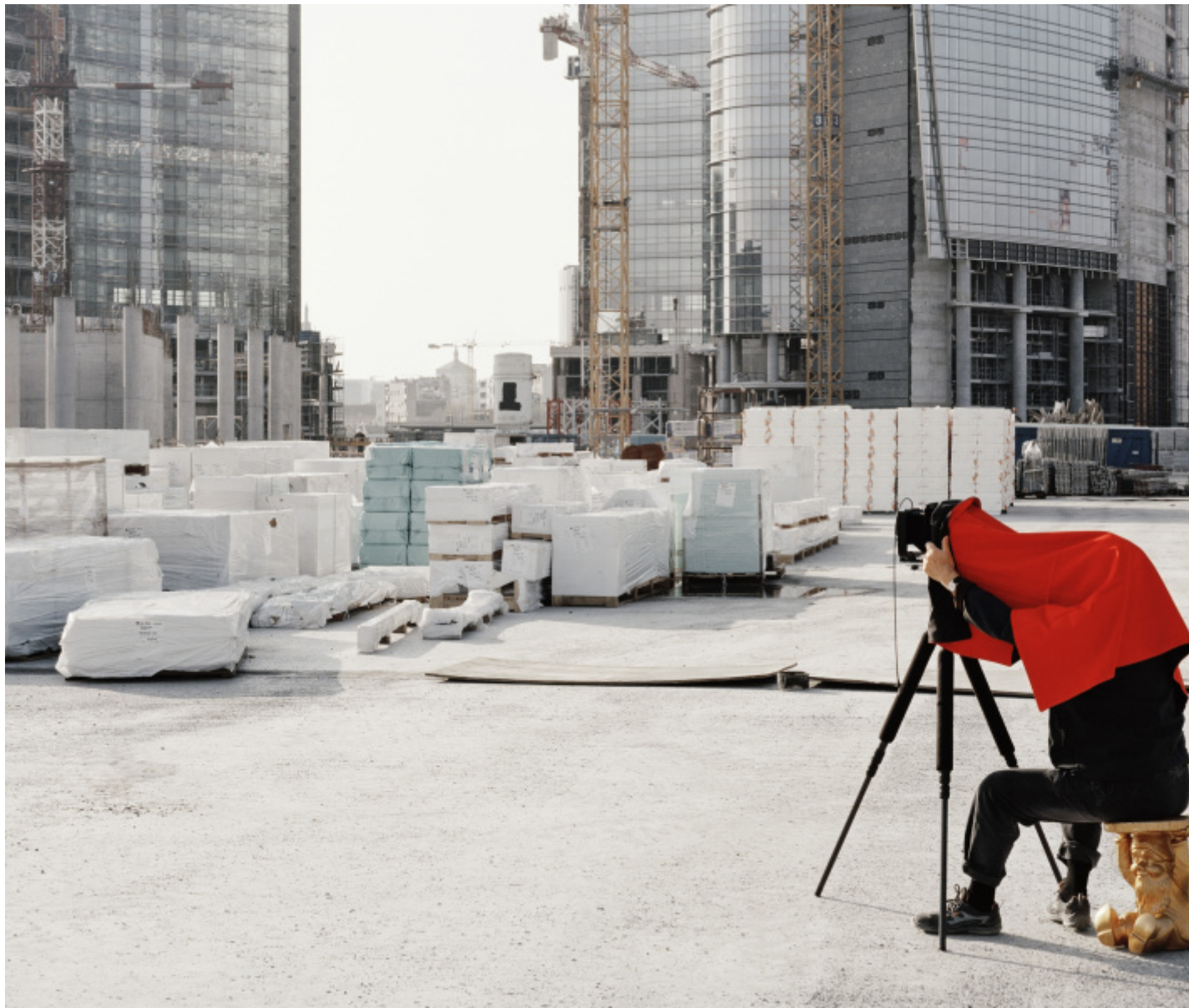
Gabriele Basilico, Autoritratto/Self portrait, 2011

Piccola nota a margine: allontanati da piazza Missori, i valdesi ottennero come risarcimento dal Comune un terreno in via Francesco Sforza, dove erigere il loro nuovo tempio. L'antica facciata della chiesa di San Giovanni in Conca venne allora smontata pezzo dopo pezzo, recuperata e ricostruita così com'era prima, ma nella nuova sede. E infatti la si può ammirare ancora adesso, come ingresso principale del tempio valdese di via Sforza, inaugurato nel 1952. Mentre il resto dell'abside e la splendida cripta romanica sono ancora in piazza Missori. All'insegna di "miracoli a Milano" abbiamo da allora una chiesa sdoppiata, con una cripta da una parte e una facciata dall'altra!