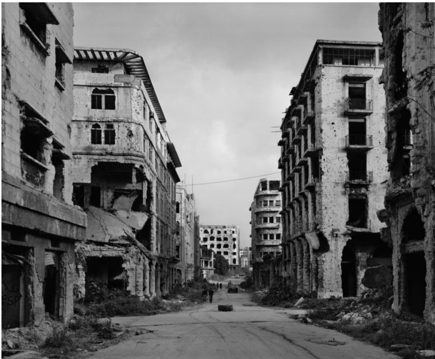
© Gabriele Basilico | Beirut 1991.