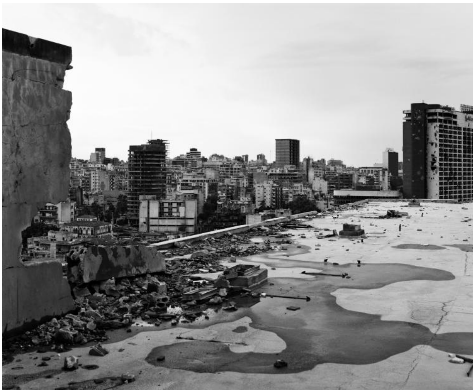
© Gabriele Basilico | Beirut 1991.

La distruzione porta via con sé parti numerose di ciò che prima era stato intero: provoca, in altri termini, l'eliminazione da un paesaggio originario di quelle porzioni necessarie per completarlo, conducendolo a una sintesi bestiale della propria anatomia. A metà del XIX secolo, John Ruskin – pittore e scrittore britannico, nonché grande studioso di architettura – rappresentava la selezione naturale operata dalle rovine degli edifici storici in carte dipinte con tecniche miste facendo celare dal bianco stesso della carta tutto il resto del paesaggio che rovina non era – il mare, la terra, tutti gli altri edifici che le circondavano; a Beirut, dove tutto è rovina di fronte agli occhi di Basilico, niente va cancellato più di quanto il conflitto abbia fatto, e va fatto emergere tutto ciò che fin lì è riuscito a sopravvivere: questa la scelta, pare, di fronte al compito di rappresentarla.