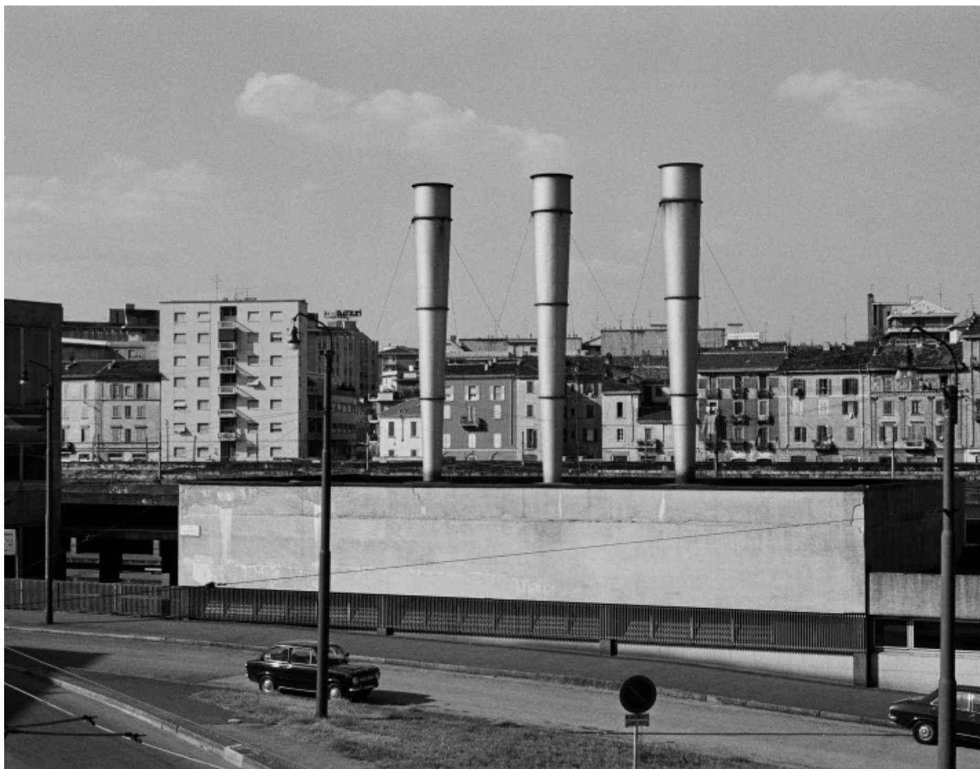
Gabriele Basilico, Milano 1978-80, Foto di Gabriele Basilico/Archivio Gabriele Basilico.