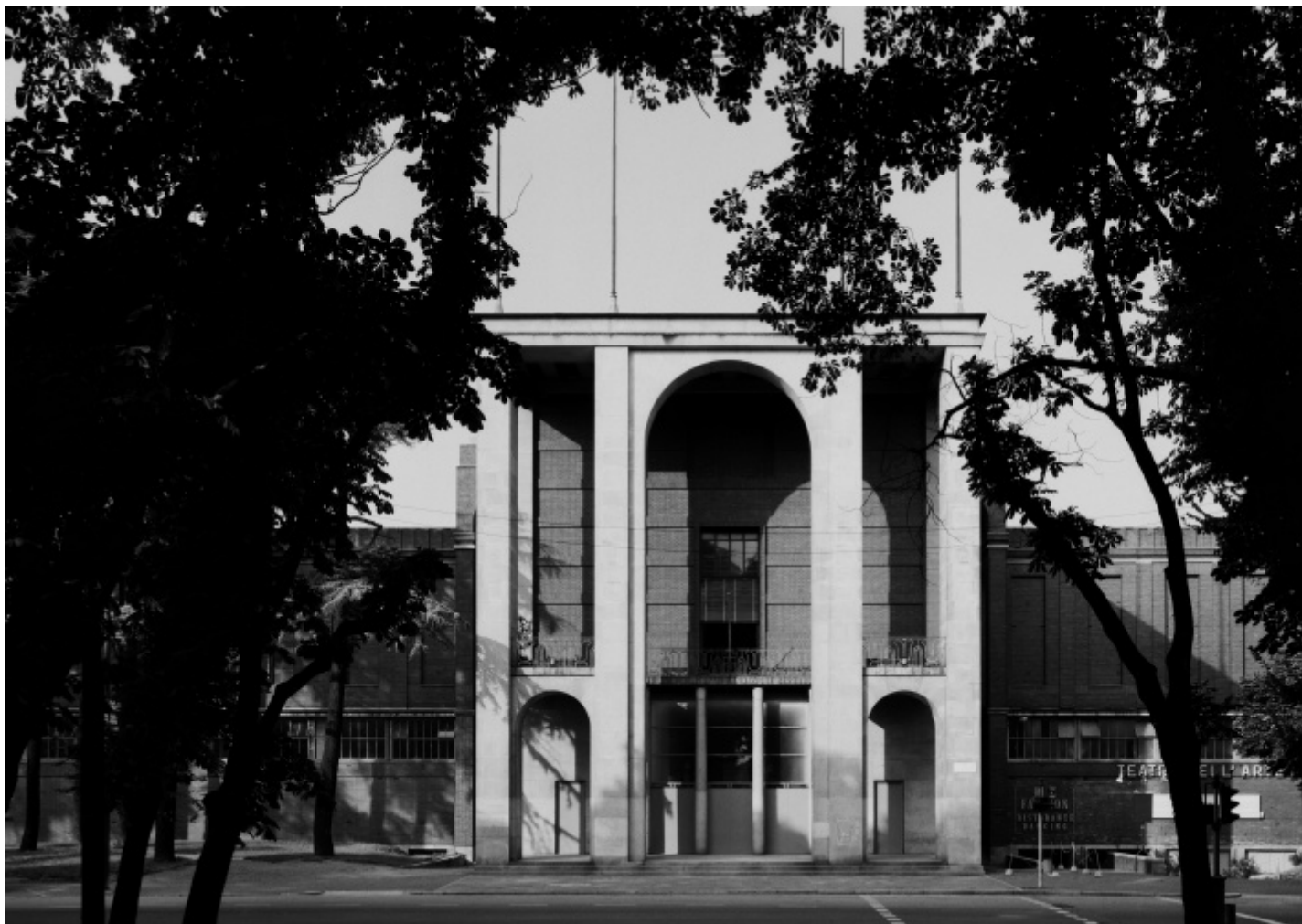
Gabriele Basilico, Milano 1980, Foto di Gabriele Basilico/Archivio Gabriele Basilico.

capire senza giudicare. «Penso che nella mia fotografia non ci sia un giudizio sulla qualità dell'architettura. Alla fine non è troppo importante se una città è bella o brutta, se l'architettura è di qualità o mediocre, m'interessa la convivenza, lo scenario esistenziale degli esseri umani» – raccontava Basilico in un'intervista raccolta da Roberta Valtorta (curatrice e storica della fotografia che ha da sempre seguito il suo lavoro) e poi riportata in: Gabriele Basilico. Scritti e conversazioni sulla fotografia 1970-2012 , a cura di Roberta Valtorta (Dario Cimorelli Editore, Milano, 2023, pp.440), un libro appena uscito, in felice coincidenza con la doppia mostra di cui stiamo parlando.