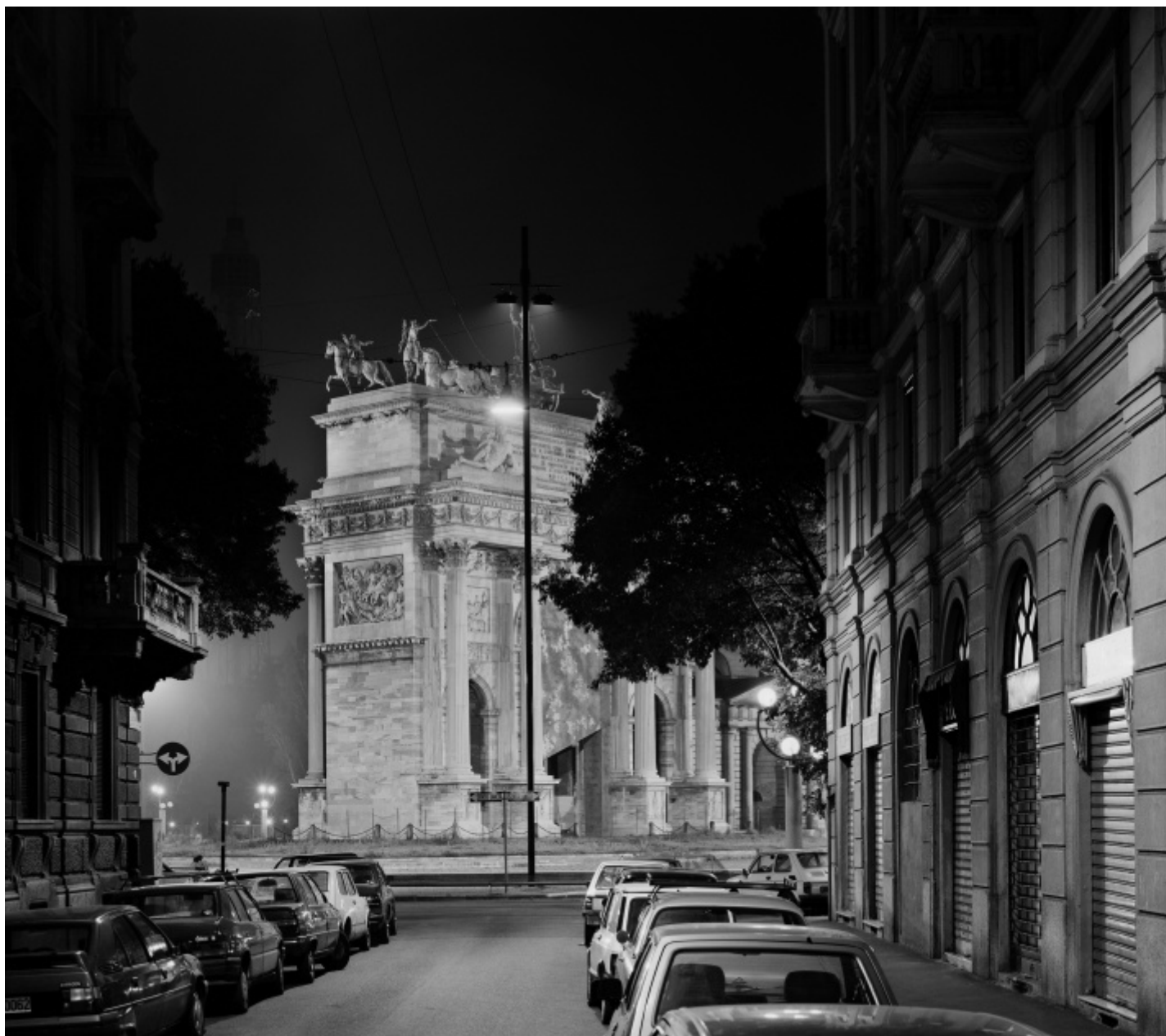
Gabriele Basilico, Milano 1989, Foto di Gabriele Basilico/Archivio Gabriele Basilico.

Con umiltà confessava :«Mi piace pensare di aver imparato, in quanto fotografo, a mettermi da parte, rinunciando a una rappresentazione troppo soggettiva e spesso artificiosa in favore di una riproduzione apparentemente oggettiva della realtà e caratterizzata da un grande rispetto verso le cose». Il suo era un mettersi da parte anti-narcisistico, per dare maggiore voce ai luoghi che aveva di fronte: abbassava la propria voce in modo da comprendere meglio la storia di un dato tessuto urbano, fino a coglierne il segreto genius loci . Un approccio, questo, che però non implicava un'assenza di coinvolgimento, anzi. Nel 1994, quando lo intervistai per l'Unità, mi raccontò che dopo l'importante esperienza della Mission Photographique de la Datar (per la quale aveva documentato le coste del nord della Francia su incarico del governo) «mi sono sentito sempre più avvolto dai luoghi, nutrito da essi, come dilatato fisicamente, tanto che la fotografia si è trasformata in un esercizio spirituale, dove riscoprire l'importanza della contemplazione e della lentezza dello sguardo». Nel caso di quella particolare ricerca (poi confluita nel libro Bord de Mer ) il suo sguardo faceva in effetti emergere un nuovo «bisogno di scorrevolezza verso l'infinito (...) è come se fossi passato da un meccanismo prospettico rinascimentale al vedutismo fiammingo, dove il paesaggio è dilatato, naturalistico».