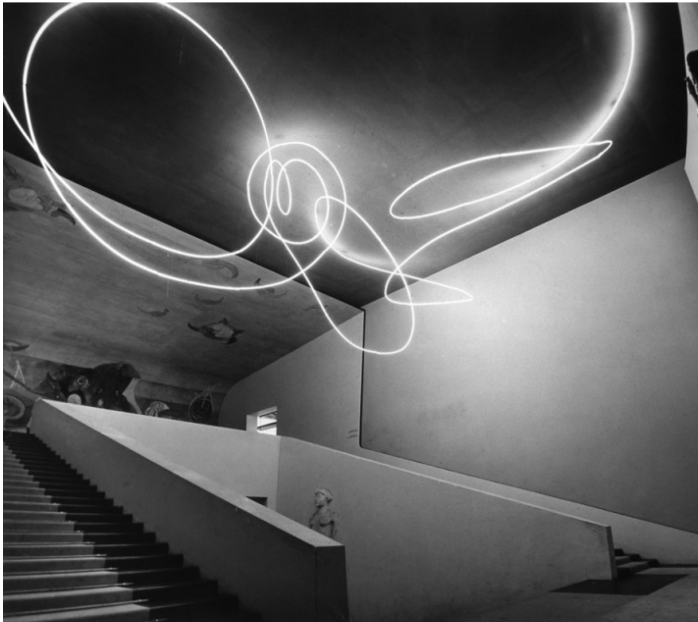
Struttura al neon, Triennale di Milano, 1951.

Dello Spazialismo di Fontana, per 2 , pi 1 che le idee, contano le incarnazioni, il modo in cui i concetti si traducono in opere: i celebri «Buchi» e i celeberrimi «Tagli» , esposti per la prima volta rispettivamente nel '52 e nel '59; ma anche i rivoluzionari Ambienti del '49 e '51, l' Ambiente a luce nera , presentato alla Galleria del Naviglio, e la Struttura al neon l'arabesco luminoso realizzato per lo scalone della Triennale. (A proposito della quale, alla voce Luce , scopriamo che una delle sue fonti dirette sono le fotografie di Gjon Mili, pubblicate su Life nel 1949, in cui Picasso disegna nello spazio con una torcia; quel Picasso di cui Fontana riconobbe la grandezza solo quando anch'egli raggiunse la consacrazione: «Anche lui ha cambiato molte cose» ). Giustamente, il Dizionario dedica molte pagine a questi e agli altri ambienti di Fontana, la cui visionarietà « è stata recentemente confermata anche dalla bella mostra all'Hangar Bicocca del 2017 (ne ha scritto Silvia Bottani qui » ).