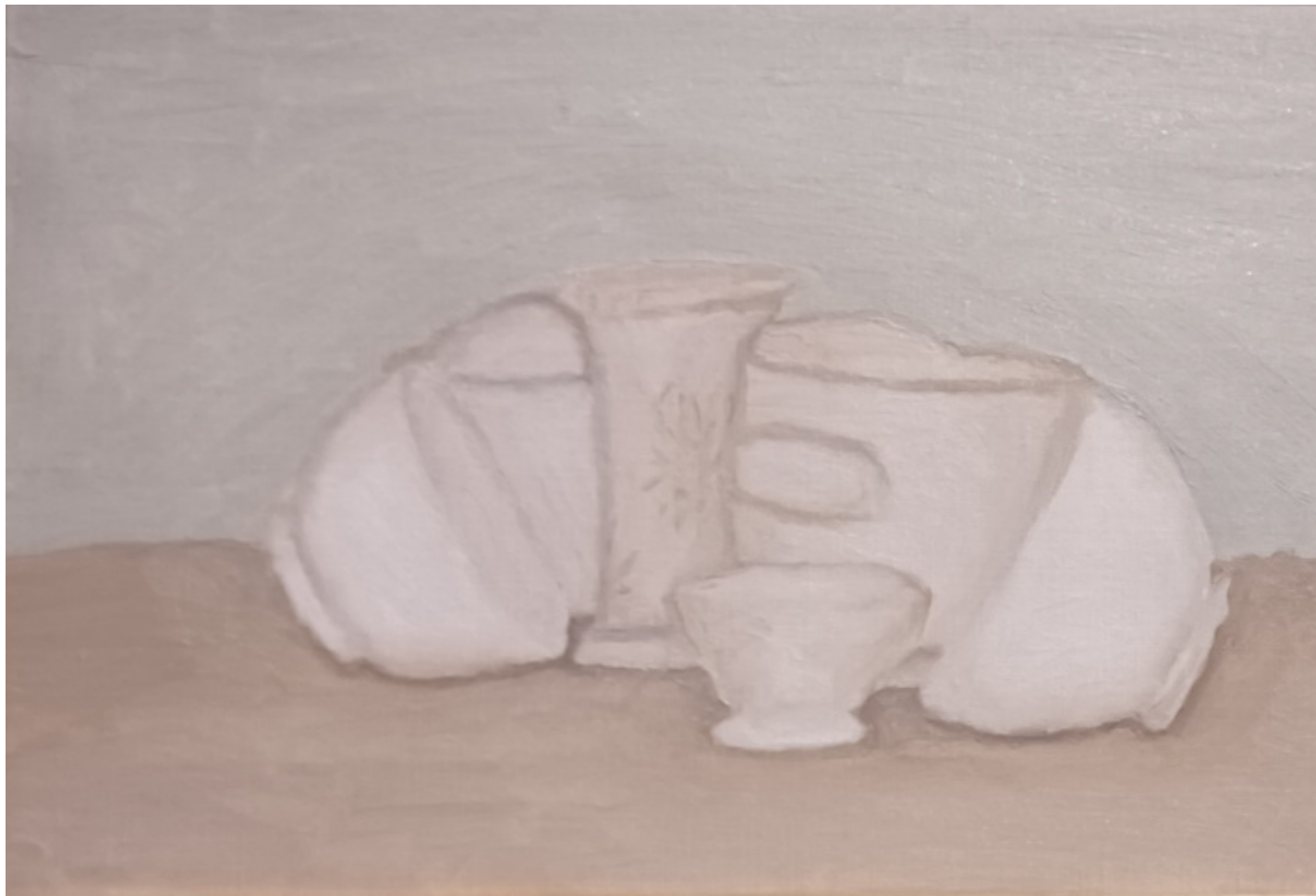
Giorgio Morandi, Natura morta , 1942.

«Lavoro costantemente dal vero», ha scritto Morandi, «quello che importa è toccare il fondo, l'essenza delle cose». Ma dov'è il fondo? Qual è l'essenza? È il movimento della luce a produrre quello stato di necessità che l'artista riconosce definitivo? Che sia per questo stato d'attesa giunto a compimento che in alcune tele gli oggetti non proiettano ombra, messi a nudo e trafitti in piena luce? Vano, allora, parlare di forme e di geometrie, di astrazione e di calcolo. Si tratterebbe piuttosto di un rapporto istintivo e sensuale con l'atmosfera e il suo ordine instabile, perennemente provvisorio. Nulla, per Morandi, è più astratto del reale. Tanto che i suoi paesaggi sembrano frutto di un'orchestrazione, di un processo compositivo, tanto quanto le sue nature morte. Questione di sguardo, di ritmo dell'osservazione, di capacità di instaurare un dialogo con la cosa guardata, a sua volta mai statica, mai passiva, mai per sempre uguale e chiusa in se stessa. Come, nel bel testo della curatrice che inaugura il catalogo, una notazione cruciale: Morandi «rigetta ogni compiacimento vedutistico». Ed è così. Morandi guarda a lungo e aspetta di essere visto. A fare da tramite tra lui e le cose, la potenza alchemica della luce, la sua funzione relazionale.