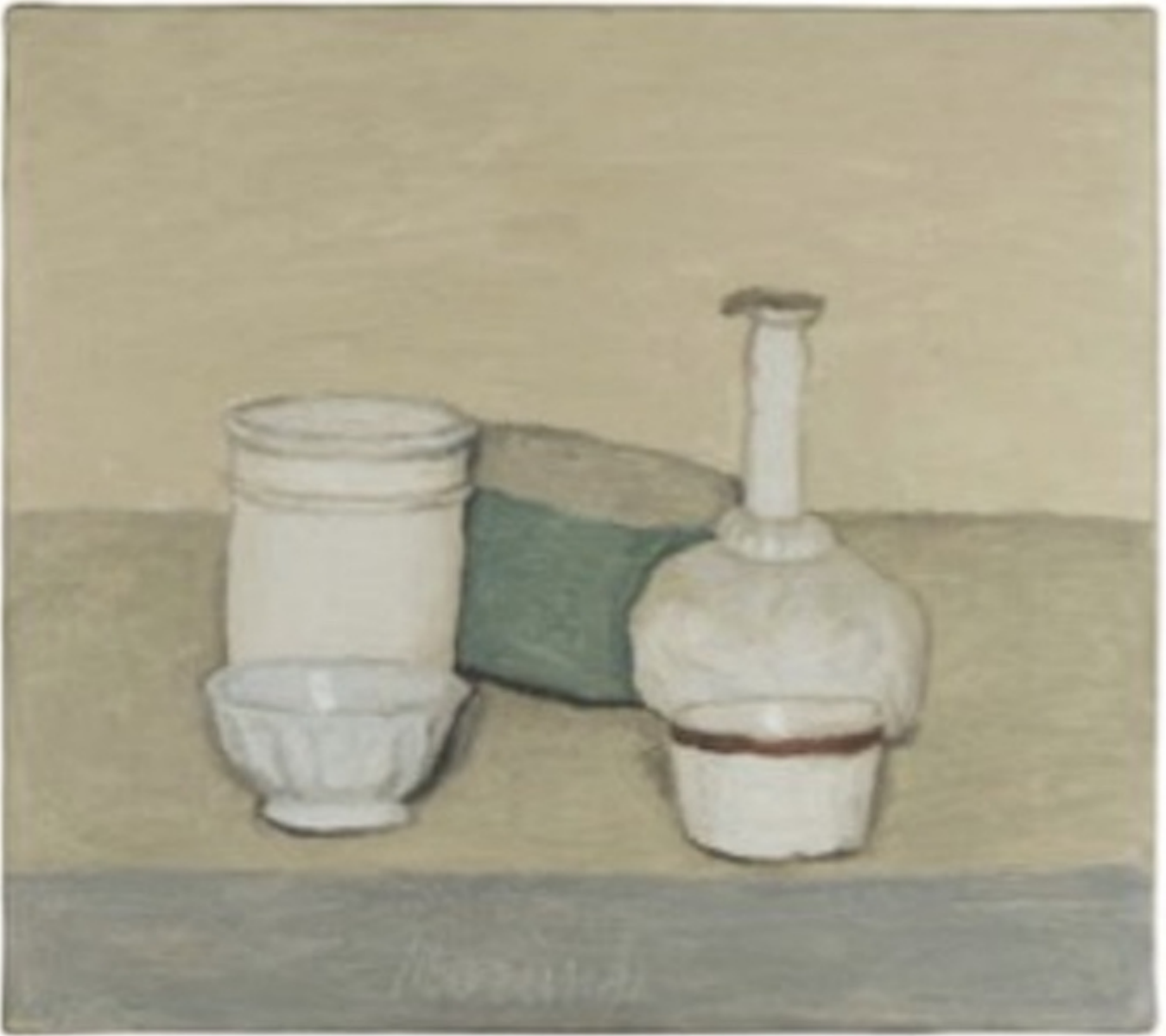
Giorgio Morandi, Natura morta (Still Life) , 1952, olio su tela, ©2015 Artists Rights Society (ARS), New York/Siae, Roma/Collezione privata

Nelle sue acqueforti Morandi usa contrasti tonali piÃ¹ forti che nei suoi dipinti. Ma il loro soggetto Ã¨ il medesimo ed esse implicano lo stesso distacco e la stessa sensazione che gli oggetti raffigurati siano preziose reliquie di un qualche tipo. Tecnicamente sono magistrali. Ancora una volta in contrasto con tanti suoi contemporanei, Morandi rifiuta di affidarsi alla retorica. Non c'Ã¨ una lotta epica con il rame e l'acido: il mezzo vince alcuni round e l'artista altri. Ogni centimetro quadrato della lastra viene corrosa come previsto. La gradazione del tratteggio da un tono mussola grigia a un nero profondo Ã¨ impeccabile; i punti bianchi e le linee tra la griglia del tratteggio non sono mai sfocati o imperfetti. Sono fatte queste acqueforti con lo spirito con cui alcune donne anziane sanno fare il merletto.