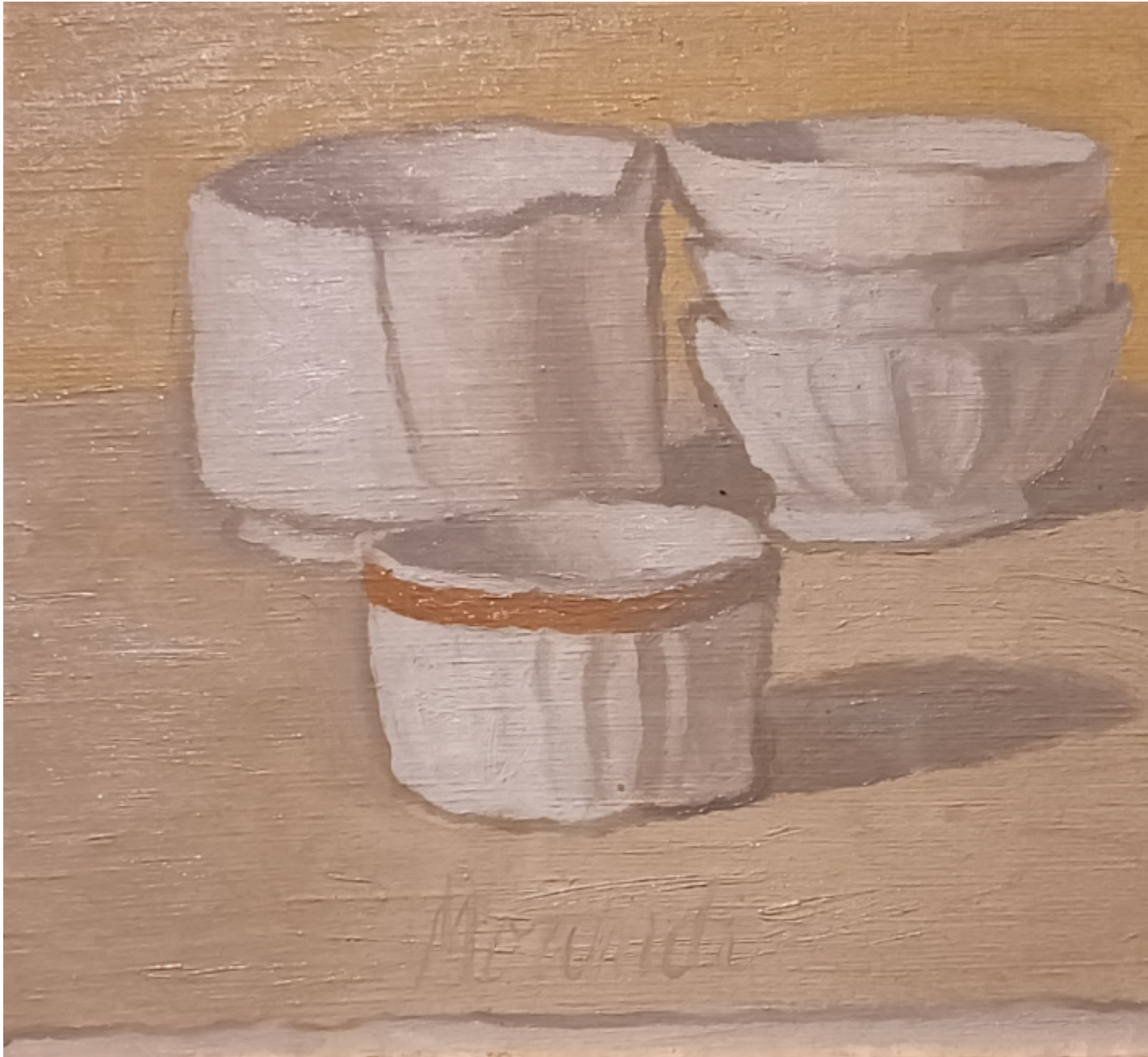
Giorgio Morandi, Natura morta , 1943.

Anche questo, a ben vedere, fa parte di quell'amore di precisione e di quel disdegno della parola superflua o tautologica, chiassosa, che il bergeriano zio Edgar attribuisce al pittore di Via Fondazza. La variazione o fuga, impercettibile come una brezza o un sospiro, non può essere segnalata da un titolo. Se a costruirla con intatto stupore l'artista, paziente sperimentatore di spazi, distanze, intervalli, contiguità e slittamenti, sarà l'osservatore a coglierla e decifrarla con altrettanta intatta sorpresa, come si fa con un messaggio in codice o con un segreto.