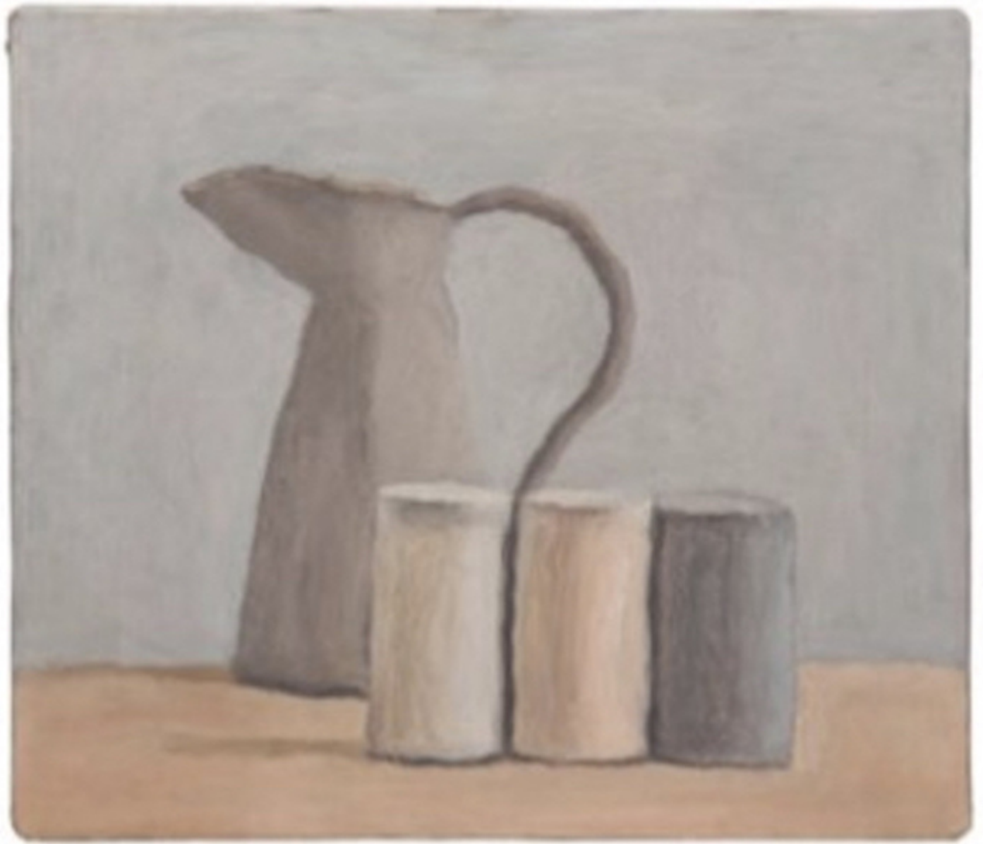
Giorgio Morandi, Natura morta , 1962, olio su tela ©2015 Artists Rights Society (ARS), New York/Siae, Roma/Collezione privata, Svizzera

Non voglio spingere troppo oltre questa osservazione. Tuttavia non riesco a immaginare come descrivere in altro modo quanto l'arte di Giorgio Morandi sia tipicamente italiana. Potrebbe diventare facilmente ultrasoggettivo. Ma non riesco a vederla che in questo modo. L'opera di Giorgio Morandi non contiene echi romani o rinascimentali evidenti. E non esprime neppure energia e entusiasmo propri del temperamento italiano. La sua opera è specificamente italiana solo perché i suoi dipinti e le sue acqueforti evocano cos'è precisamente questa particolare qualità della luce — la stessa qualità, benché interpretata in maniera assai diversa, che si trova, ad esempio, nell'opera di Piero della Francesca o di Giovanni Bellini.