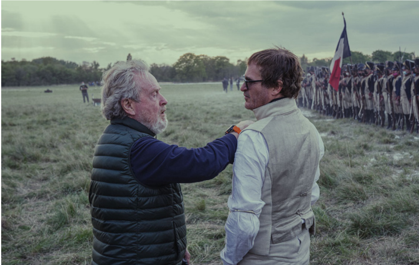
Ridley Scott con Joaquin Phoenix sul set.

codice Napoleonico al motto secondo cui nel suo esercito «ogni soldato semplice aveva nello zaino un bastone di maresciallo», le armate di Napoleone erano soprattutto l'immagine del cambiamento.