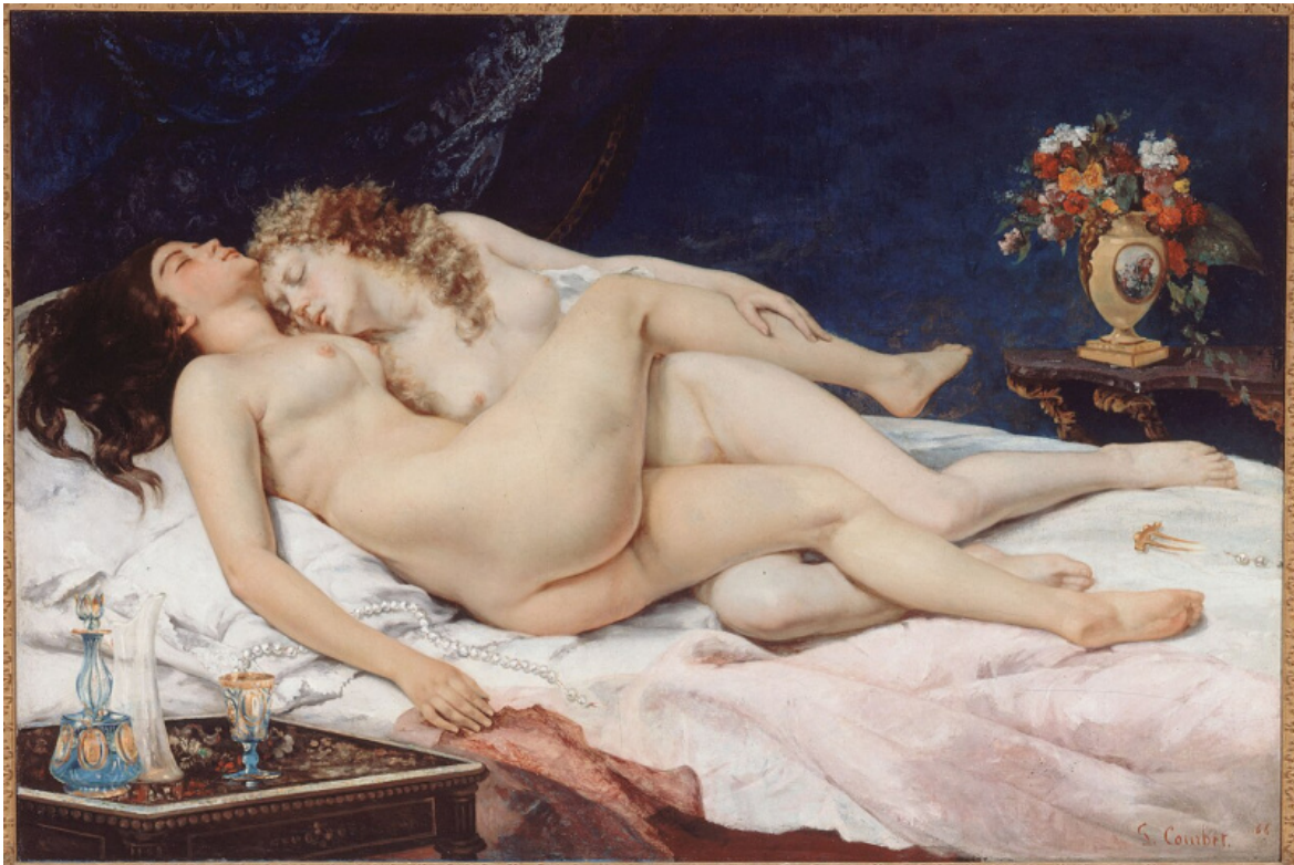
Gustave Courbet, Le sommeil (1866)