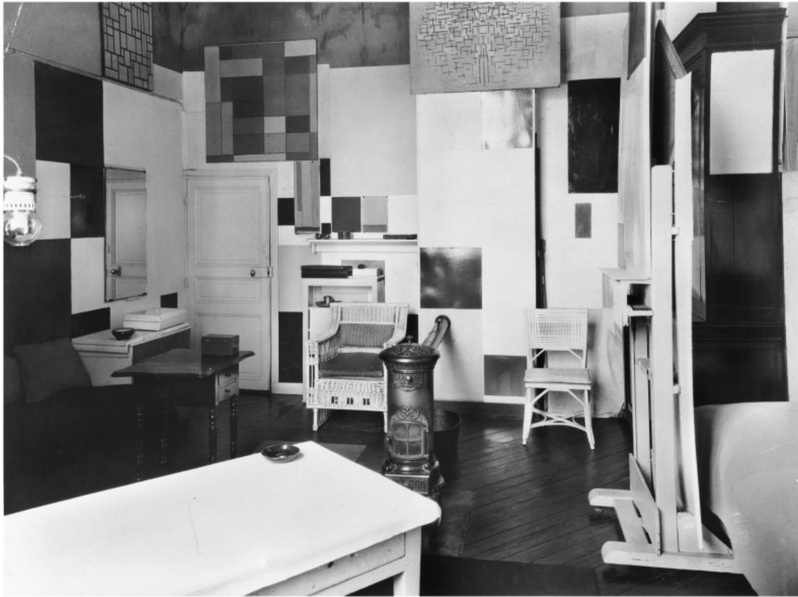
Atelier di Mondrian a Montparnasse