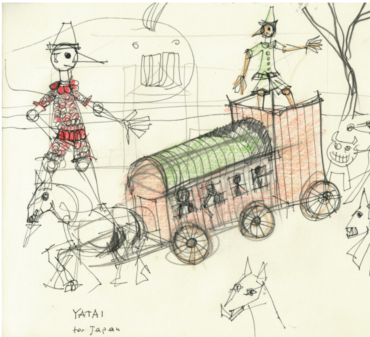
© Eredi Aldo Rossi, courtesy Fondazione Aldo Rossi.

Pinocchio è un eroe della fame. Figlio di un paese sempre affamato, come era l'Italia alla fine del XIX secolo, e ancora all'inizio del XX, Pinocchio è sempre alla ricerca di cibo. La sua non è solo la fame dello stomaco. Si tratta della fame dell'infanzia, qualcosa che ha a che fare con la natura animale che alberga nei bambini. Come fa un essere vegetale – Pinocchio-Pinolo – ad avere una fame animalesca? Perché è anche un asinello, come si scopre a un certo punto. Indossando i panni dell'infanzia, lui che è senza età, essendo nato dal nulla, formato da Geppetto, suo magico artefice, s'impadronisce della fame infantile, quella che sorge improvvisa, senza preavviso, che spinge il bambino, prima buono e tranquillo, a strillare e piangere di colpo: voglio mangiare! Lo stimolo è in lui così potente e imperioso che nulla può opporsi al suo soddisfacimento.