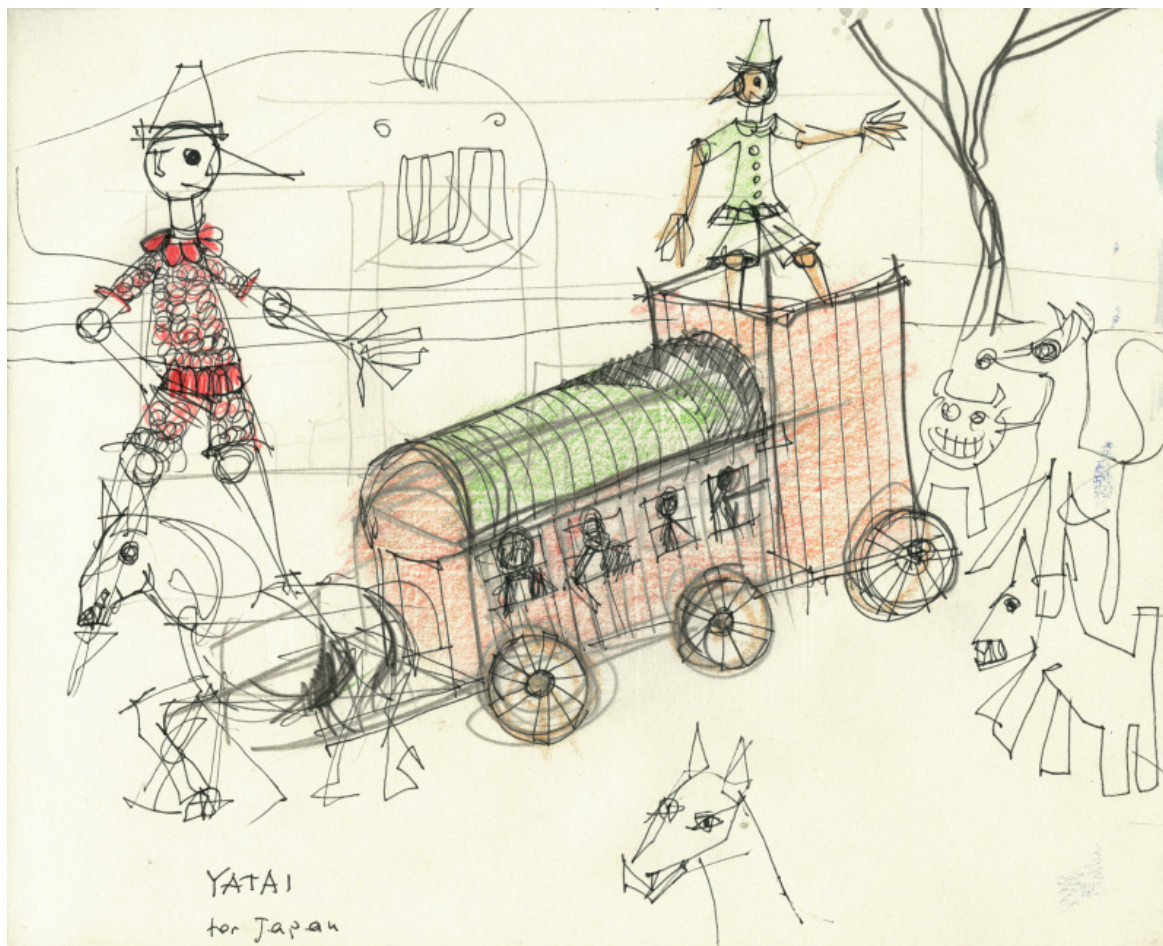
© Eredi Aldo Rossi, courtesy Fondazione Aldo Rossi.

Pinocchio è un eroe della fame. Figlio di un paese sempre affamato, come era l'Italia alla fine del XIX secolo, e ancora all'inizio del XX, Pinocchio è sempre alla ricerca di cibo. La sua non è solo la fame dello stomaco. Si tratta della fame dell'infanzia, qualcosa che ha a che fare con la natura animale che alberga nei bambini. Come fa un essere vegetale - Pinocchio-Pinolo - ad avere una fame animalesca? Perché è anche un asinello, come si scopre a un certo punto. Indossando i panni dell'infanzia, lui che è senza età, essendo nato dal nulla, formato da Geppetto, suo magico artefice, s'impadronisce della fame infantile, quella che sorge improvvisa, senza preavviso, che spinge il bambino, prima buono e tranquillo, a strillare e piangere di colpo: voglio mangiare! Lo stimolo è in lui così potente e imperioso che nulla può opporsi al suo soddisfacimento.