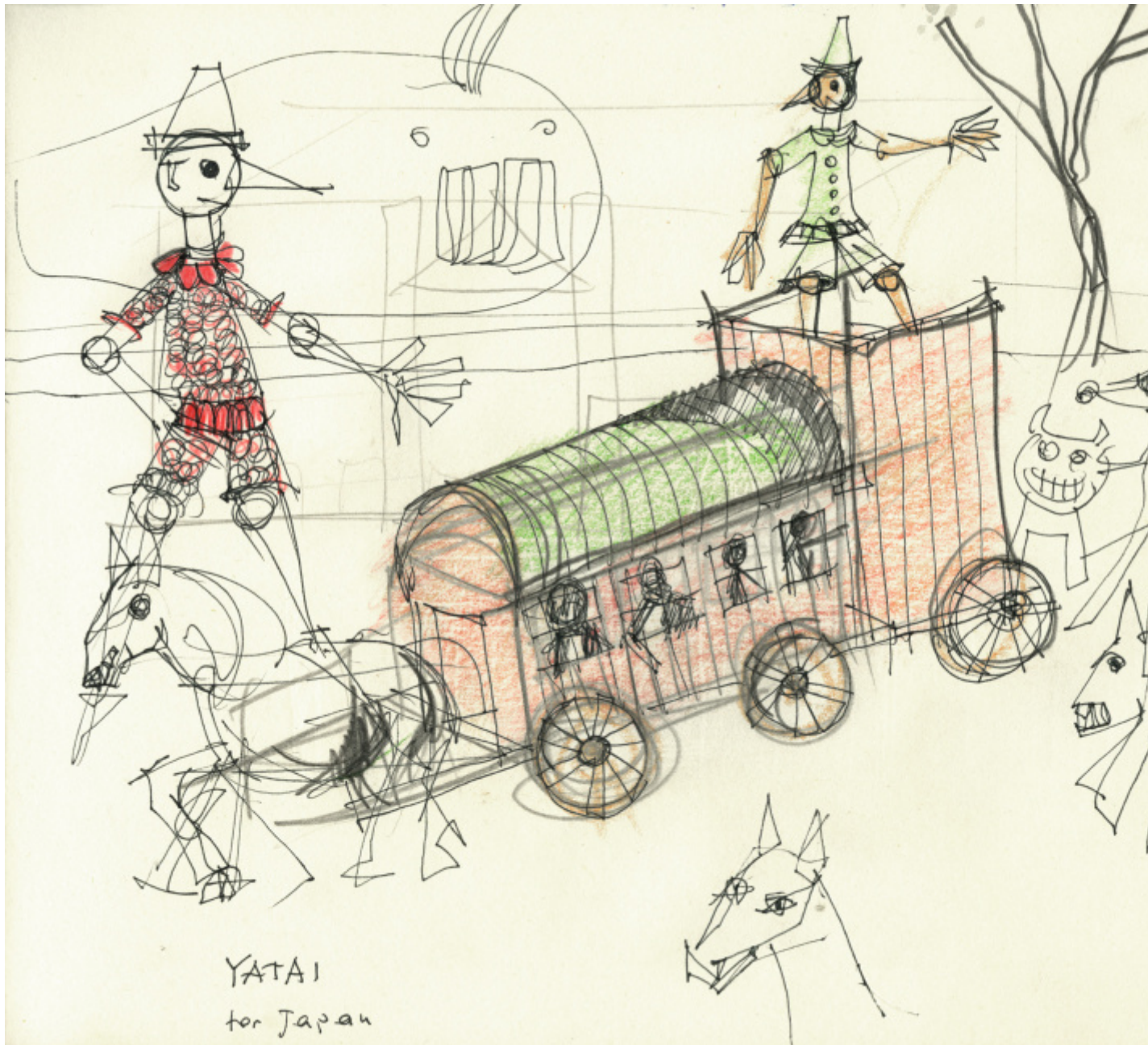
© Eredi Aldo Rossi, courtesy Fondazione Aldo Rossi.

Pinocchio è un eroe della fame. Figlio di un paese sempre affamato, come era l'Italia alla fine del XIX secolo, e ancora all'inizio del XX, Pinocchio è sempre alla ricerca di cibo. La sua non è solo la fame dello stomaco. Si tratta della fame dell'infanzia, qualcosa che ha a che fare con la natura animale che alberga nei bambini. Come fa un essere vegetale a Pinocchio-Pinolo ad avere una fame animalesca? Perché è anche un asinello, come si scopre a un certo punto. Indossando i panni dell'infanzia, lui che è senza età, essendo nato dal nulla, formato da Geppetto, suo magico artefice, si impossessa della fame infantile, quella che sorge improvvisa, senza preavviso, che spinge il bambino, prima buono e tranquillo, a strillare e piangere di colpo: voglio mangiare! Lo stimolo è in lui così potente e imperioso che nulla può opporsi al suo soddisfacimento.