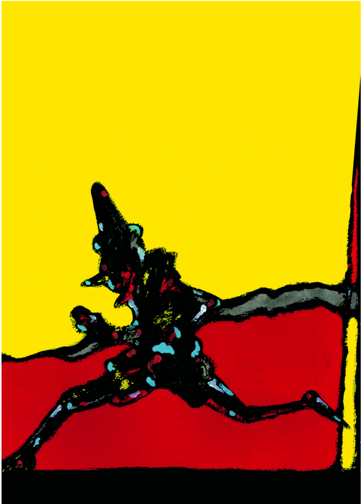
172 x 123 Collodi, Le avventure di Pinocchio: Storia di un Burattino, NUAGES, Milano, 2006, Illustrazioni di Andrea Rauch

Pinocchio è un pezzo di legno; meglio, il seme di un albero, un “pinolo”. Secondo il Tommaseo-Bellini, imprescindibile dizionario, si tratta appunto di un “seme del pino chiuso in un guscio, o nocciolo, detto parimenti Pinocchio, fin che ha in sé il