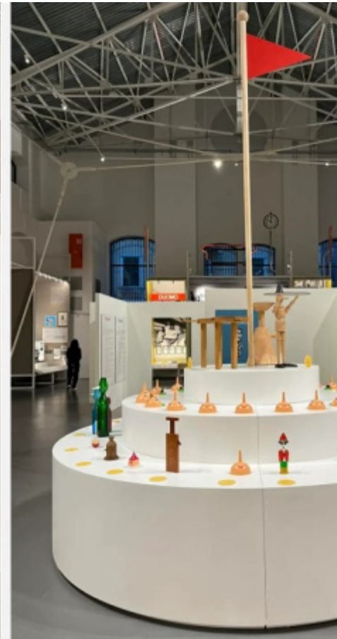
ADI Design Museum, due scorci della mostra: l'introduzione storico-iconografica e lo ziggurat con i prodotti di design ispirati a Pinocchio.

Entrati nel museo, ci accoglie la sezione storico-iconografica, in cui Marco Belpoliti con riproduzioni fotografiche di disegni, di copertine di libri, di riviste e di manifesti pubblicitari ci documenta sulla fortuna editoriale di Pinocchio.