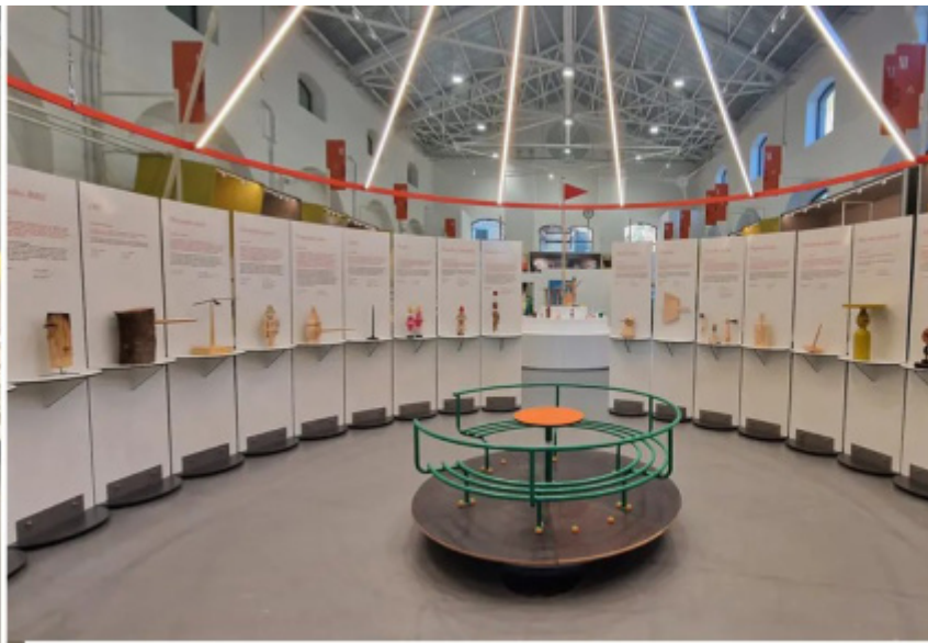
ADI Design Museum, il tendone di Mangiafuoco con all'esterno i 31 progetti di grafica e all'interno i 31 Pinocchi tridimensionali.

Il clou della kermesse è costituito dal secondo capitolo, in cui vengono presentati al pubblico 62 nuovi progetti di altrettanti artisti, 31 product designer e 31 graphic designer che si sono cimentati, su invito del curatore, nell'ideazione tridimensionale e bidimensionale di altrettanti Pinocchi.