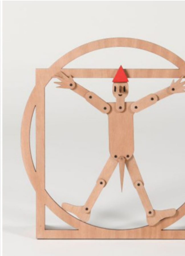
ADI Design Museum, Lorenzo Damiani, Pinocchio vola . Franco Raggi, Vitrocchio .

In fondo, qual più, qual meno, son tutti belli i Carissimi Pinocchi del circo di Mangiafuoco, perché, come ha scritto il curatore della mostra, rappresentano un'icona aggiornata alla nostra contemporaneità. Una moltitudine di Pinocchi, con nasi che crescono e gambe che si accorciano, polemici e irriverenti, snodabili, ridotti all'essenziale (cilindro, sfera, cono), primordiali, leonardeschi, che invitano al gioco, che si prestano a giochi grafici, colorati e seri in bianco e nero, cinetici, semplicemente inutili. O meglio: utili per strappare un sorriso, per distoglierci per un momento dai nostri affanni e riportarci a pensare che ognuno di noi, per un momento nella vita, avrebbe voluto essere come il nostro burattino.