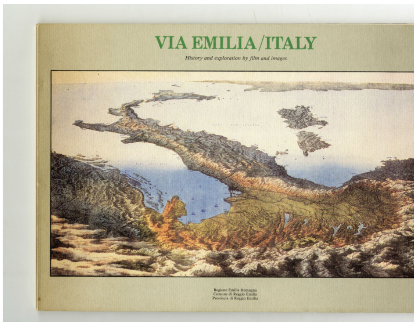
Giulio Bizzarri #B25.1, Esplorazioni della via Emilia , 29x21cm.

Ne scaturì anche una mostra al riguardo, partendo da una prospettiva antropologico-mitologica, che al tempo stesso divenne una fantasmagoria del maiale in tutte le sue declinazioni. E ancora nella manifestazione Fatto a Parma , sottolinea Dario Apollonio in catalogo: "le varie sapienze artigiane venivano trattate e rilette da autori attraverso disegni, manufatti, performance" e in Esplorazioni sulla via Emilia , le tante narrazioni artistiche, si intrecciano e come scrive Paolo Barbaro "si inventò un racconto percettivo a più dimensioni del territorio". Ecco, la migliore amicizia, stimolata nei progetti, si alzava, assieme alle occasioni della vita, per creare arte. Proprio in Esplorazioni sulla via Emilia , Bizzarri, coinvolse Ghirri suo grande amico, nella curatela del lavoro fotografico e in quello di scrittura ricordiamo tra gli altri, Tabucchi, Celati, Cavazzoni, Faeti, Del Giudice, Niccolai.