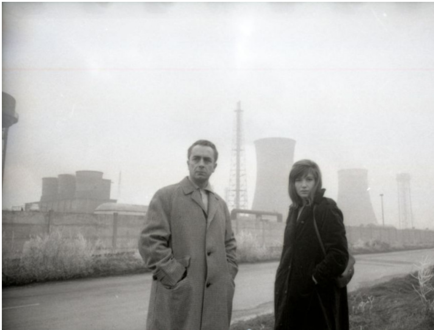
Michelangelo Antonioni e Monica Vitti sul set di Deserto rosso .

La crisi di quell'amore segnò il cambio di genere cinematografico per il regista e per l'attrice. Antonioni passò al ciclo estero con Blow-up , Zabriskie point e Professione reporter . Ancora grandi film, di pregio formale e narrativo, tra i quali Blow-up spicca per la ricerca delle inquadrature, i colori pop, il mistero della realtà imprevedibile. E naturalmente il fascino della swinging London . Il film vinse la Palma d'oro a Cannes. Tra gli interpreti, con David Hammings e Jane Birkin, una giovanissima Vanessa Redgrave. La grande attrice inglese ha dichiarato: «Prima ancora di lavorare con Michelangelo, lui per me era come un dio! Quando ho saputo che mi voleva per Blow-Up ho pensato: Mio Dio, avrà un ruolo come la Vitti! Lei un'attrice eccellente: la adoravo, volevo essere come lei, e anche bionda come lei... ma non avevo nulla di Monica! Le mie speranze infatti erano davvero scarse, e Michelangelo disse che mi voleva con i capelli neri e delle strisce bianche».