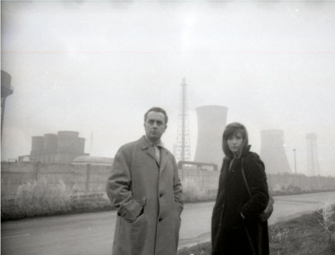
Michelangelo Antonioni e Monica Vitti sul set di Deserto rosso .

La crisi di quell'amore segnò il cambio di genere cinematografico per il regista e per l'attrice. Antonioni passò al ciclo estero con Blow-up , Zabriskie point e Professione reporter . Ancora grandi film, di pregio formale e narrativo, tra i quali Blow-up spicca per la ricerca delle inquadrature, i colori pop, il mistero della realtà imprevedibile. E naturalmente il fascino della swinging London . Il film vinse la Palma d'oro a Cannes. Tra gli interpreti, con David Hammings e Jane Birkin, una giovanissima Vanessa Redgrave. La grande attrice inglese ha dichiarato: «Prima ancora di lavorare con Michelangelo, lui per me era come un dio! Quando ho saputo che mi voleva per Blow-Up ho pensato: Mio Dio, avrò un ruolo come la Vitti! Lei un'attrice eccellente: la adoravo, volevo essere come lei, e anche bionda come lei... ma non avevo nulla di Monica! Le mie speranze infatti erano davvero scarse, e Michelangelo disse che mi voleva con i capelli neri e delle strisce bianche».