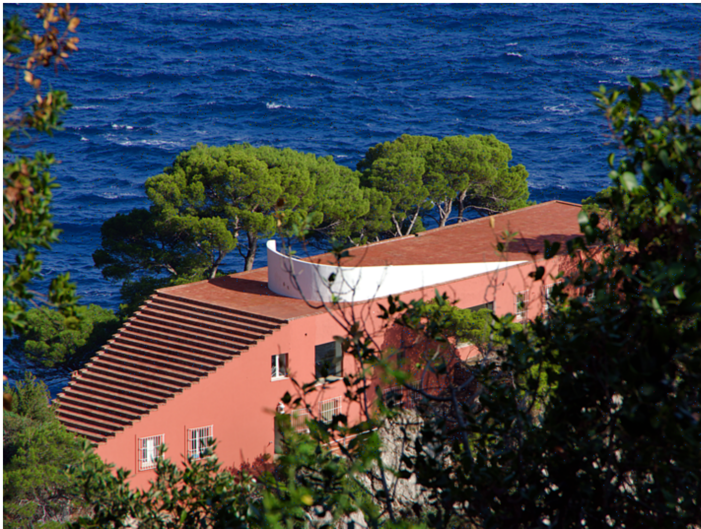
Adalberto Libera-Curzio Malaparte, Villa Malaparte, Capri, 1938-42.

Un anno dopo, nel 1964, Michelangelo Antonioni e Monica Vitti volarono in Sardegna per le riprese di Deserto Rosso sulla spiaggia rosa di Budelli. E sâ??innamorarono di Costa Paradiso. Insomma, tra le due abitazioni câ??Ã un gioco, una danza, di coincidenze, ma anche di inquadrature, di campi lunghi e di particolari, di interni ed esterni, di giorni e di notti, che raccontano vite vissute e clamorosi abbandoni.