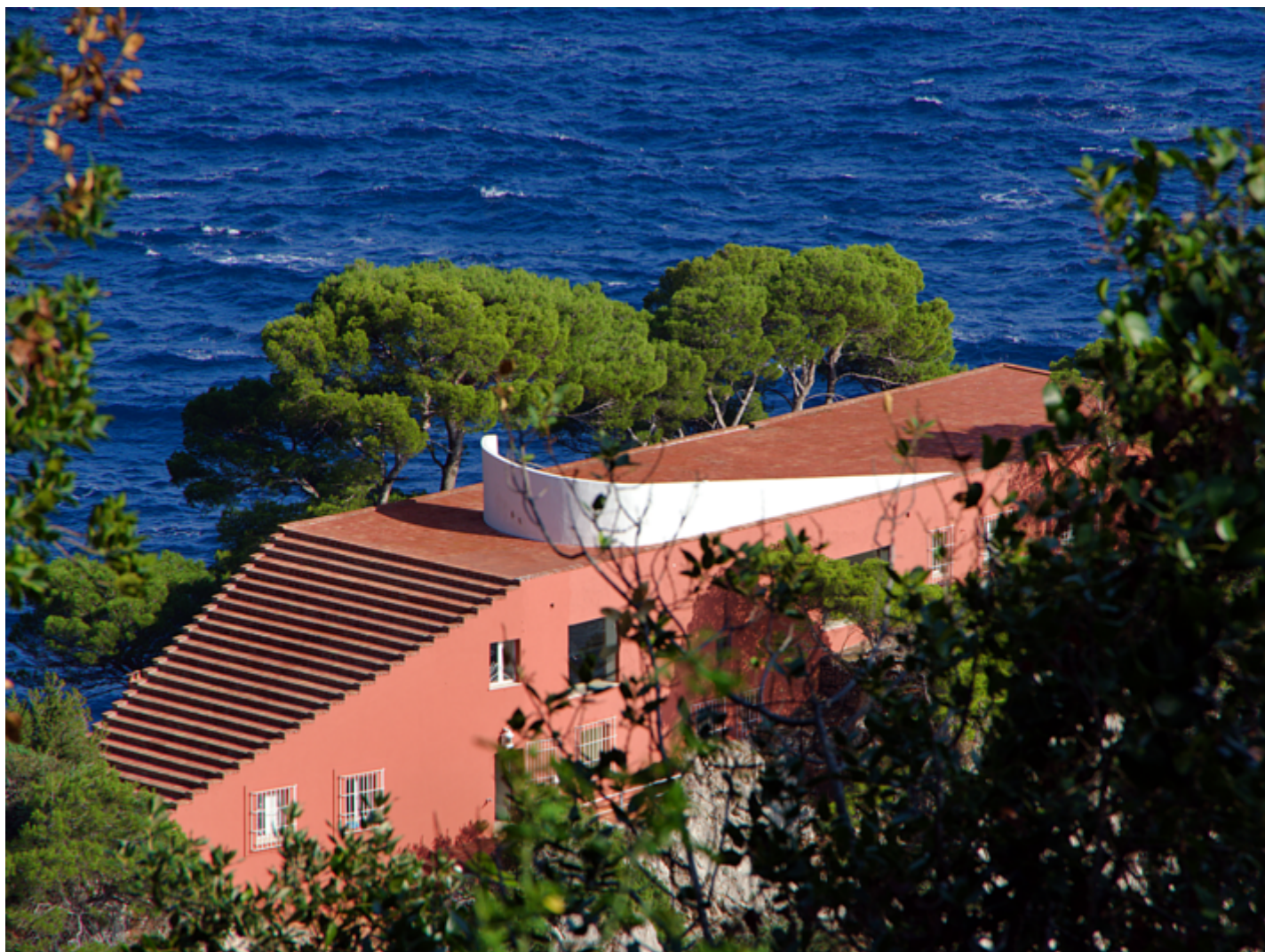
Adalberto Libera-Curzio Malaparte, Villa Malaparte, Capri, 1938-42.

Un anno dopo, nel 1964, Michelangelo Antonioni e Monica Vitti volarono in Sardegna per le riprese di Deserto Rosso sulla spiaggia rosa di Budelli. E sâ??innamorarono di Costa Paradiso. Insomma, tra le due abitazioni câ??Ã un gioco, una danza, di coincidenze, ma anche di inquadrature, di campi lunghi e di particolari, di interni ed esterni, di giorni e di notti, che raccontano vite vissute e clamorosi abbandoni.