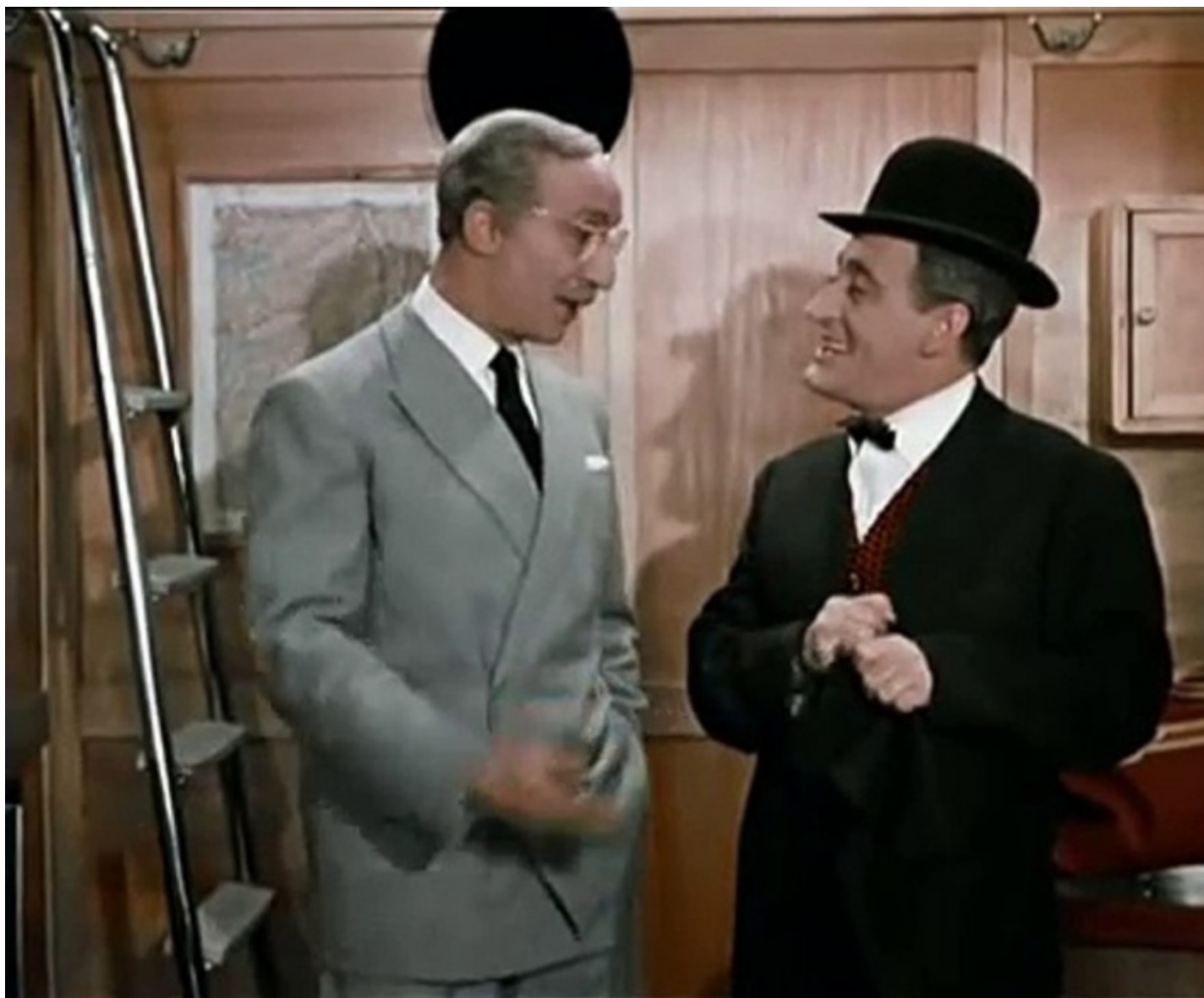
Sketch Totò e l'onorevole.

Però sarebbe un errore madornale pensare che tutto ciò dipendesse dal fatto che allora c'erano alcune personalità geniali e oggi no. Ciò che accadeva in campo teatrale era uno degli effetti di un processo politico e culturale che riguardava tutte le arti e prima ancora tutta la cultura e la società. Gli anni sessanta, almeno fino al '68, sono stati quasi dappertutto e per tutte le arti un crogiuolo di incredibili novità; dunque per pensare in modo costruttivo al presente e al futuro prossimo non basta evocare i caratteri di ciò che ci piacerebbe, dovremmo piuttosto partire dalla conoscenza del campo di forze nel quale oggi ci troviamo e, tenuto conto di quel contesto, prefigurare l'attivazione di nuovi bisogni e desideri.