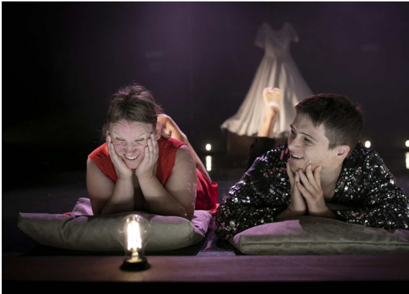
Lo specchio della regina, compagnia La Ribalta, rappresentato a Olinda, ph. Vasco Dell'Oro.

Il pubblico popolare di oggi è quello che affolla le arene per il teatro canzonatorio di Checco Zalone, quello di ieri riempiva i grandi teatri di varietà per divertirsi con Totò e i suoi colleghi del tempo. La differenza tra i due ci fa capire molte cose. Ad esempio, non credo che gli originali democristiani dell'onorevole Cosimo Trombetta massacrato comicamente da Totò fossero contenti, mentre le vittime più o meno illustri di Zalone, da Muti a Jovanotti, da Al Bano a Bocelli e giù giù sino ai prostituti del rango più basso, presenziano entusiasti agli spettacoli di Zalone, nella platea del quale è dato di vedere (in Amore + iva su Netflix) anche un prete che si sganascia dal ridere alla canzone Bucchinhu [pompino] rigatu . Mi sembra un dato rivelatore del nostro stato culturale. I due comici hanno lo stesso tipo di successo, il che dimostra quanto sia cambiato quel popolo che una volta sosteneva convintamente uno o l'altro partito politico e che ora in maggioranza non vota più e se vota predilige i nuovi fascisti. Il bisogno diffuso – e in un certo senso sacro – del politicamente scorretto ha cambiato di segno.